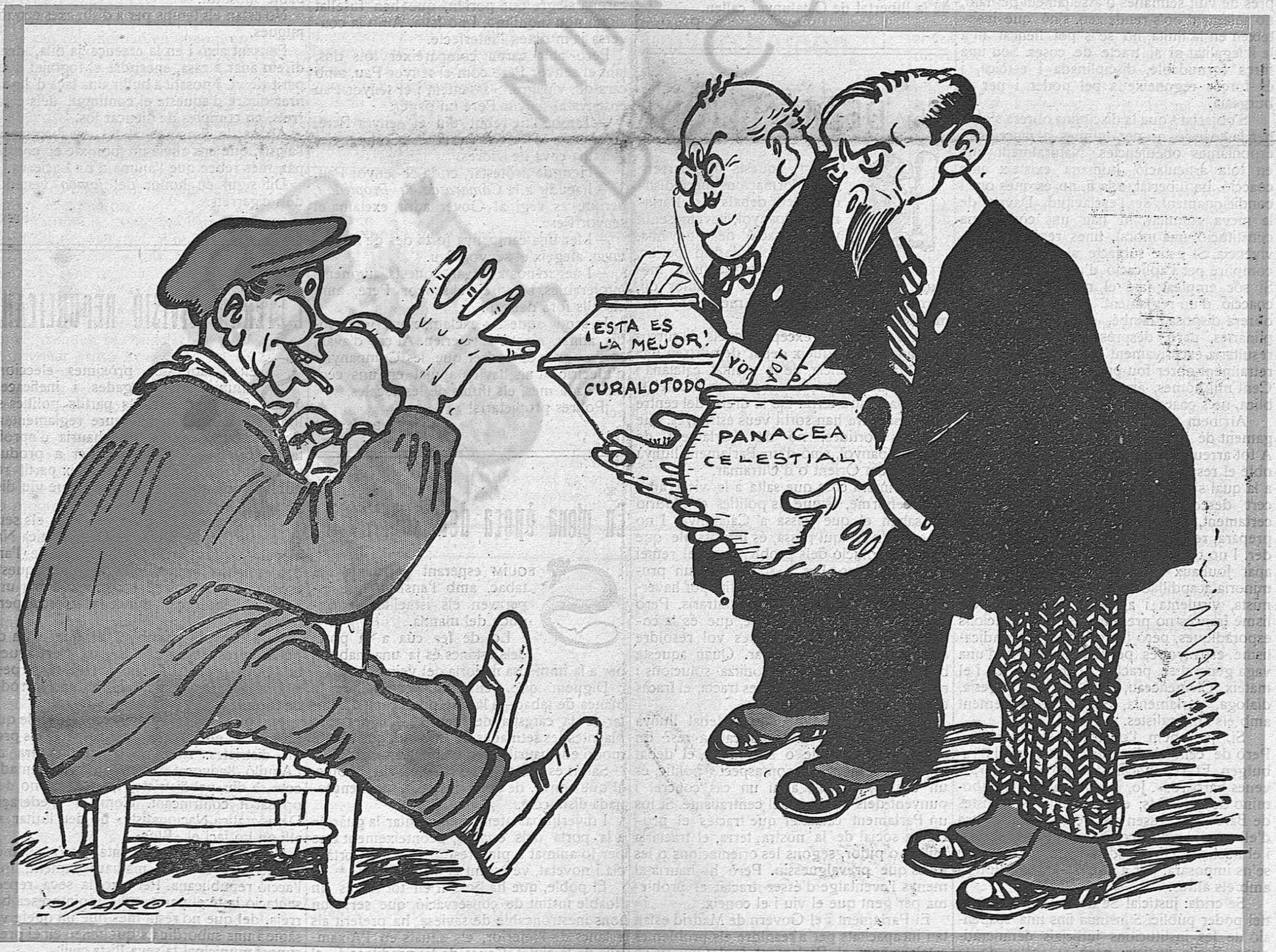
— Quan pateixo no'm voleu escoltar, i ara jo us haig d'escoltar a vosaltres?... Aneu a enganyar al diable!