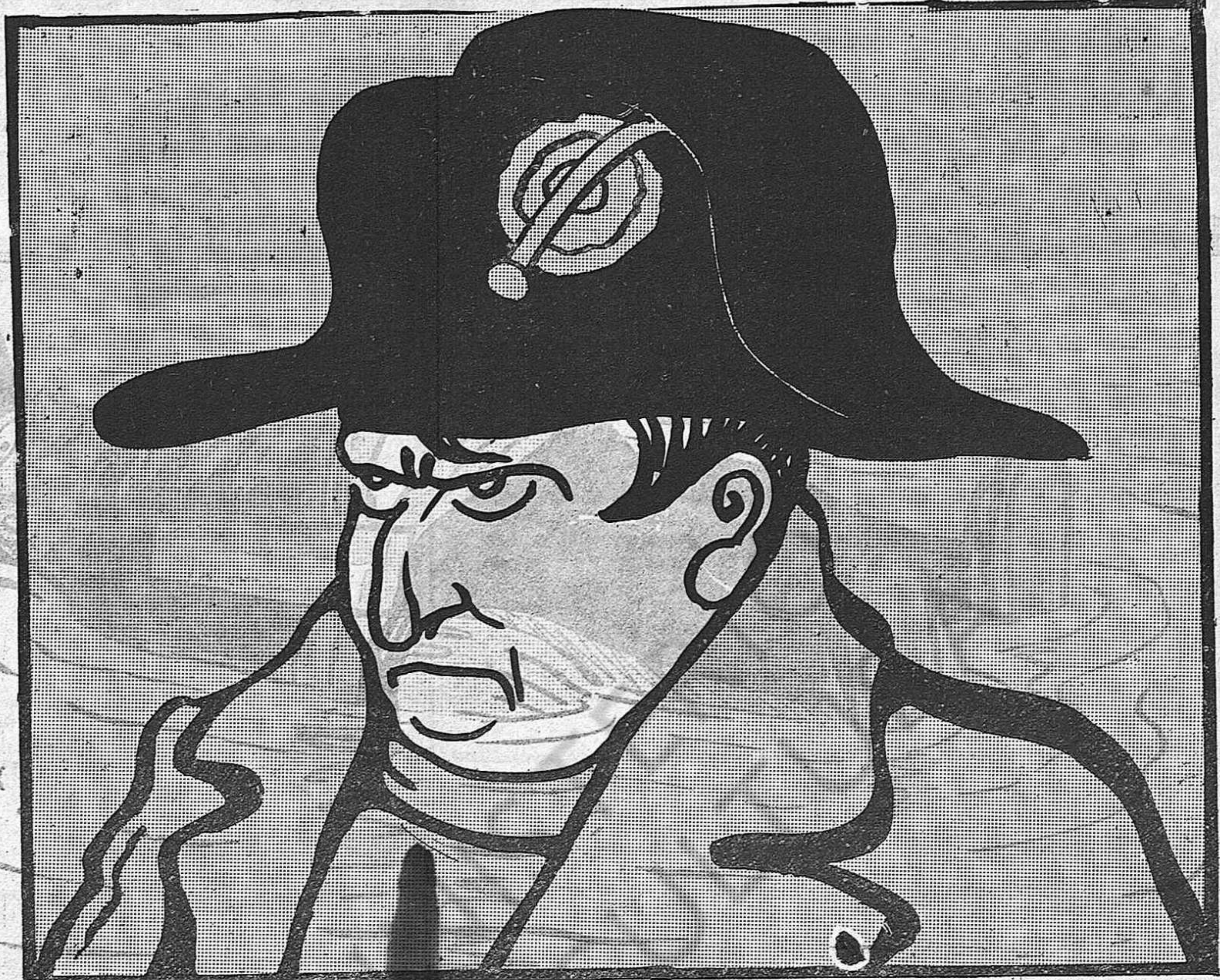
— Si t'envien a Santa Elena, protesto!... Això es sortir-te'n massa barato!...

I el burxa en la panxeta. Després segueix: —Que poco negocio haria usted, amigo Batusans, en lugar de tenerlos vale más que esten en las cuevas frigorificas.