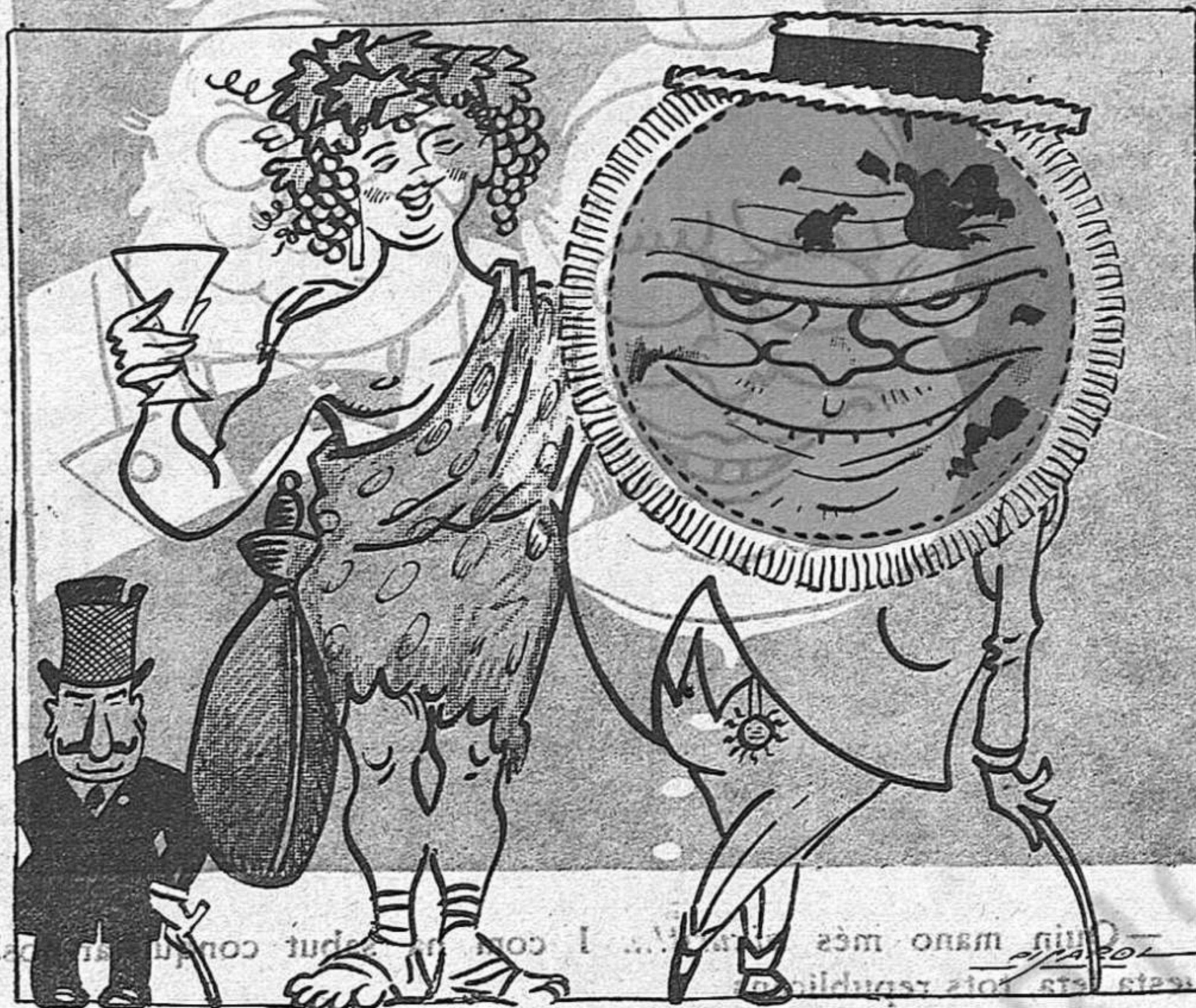
El Sol, el ví i En Sánchez Toca