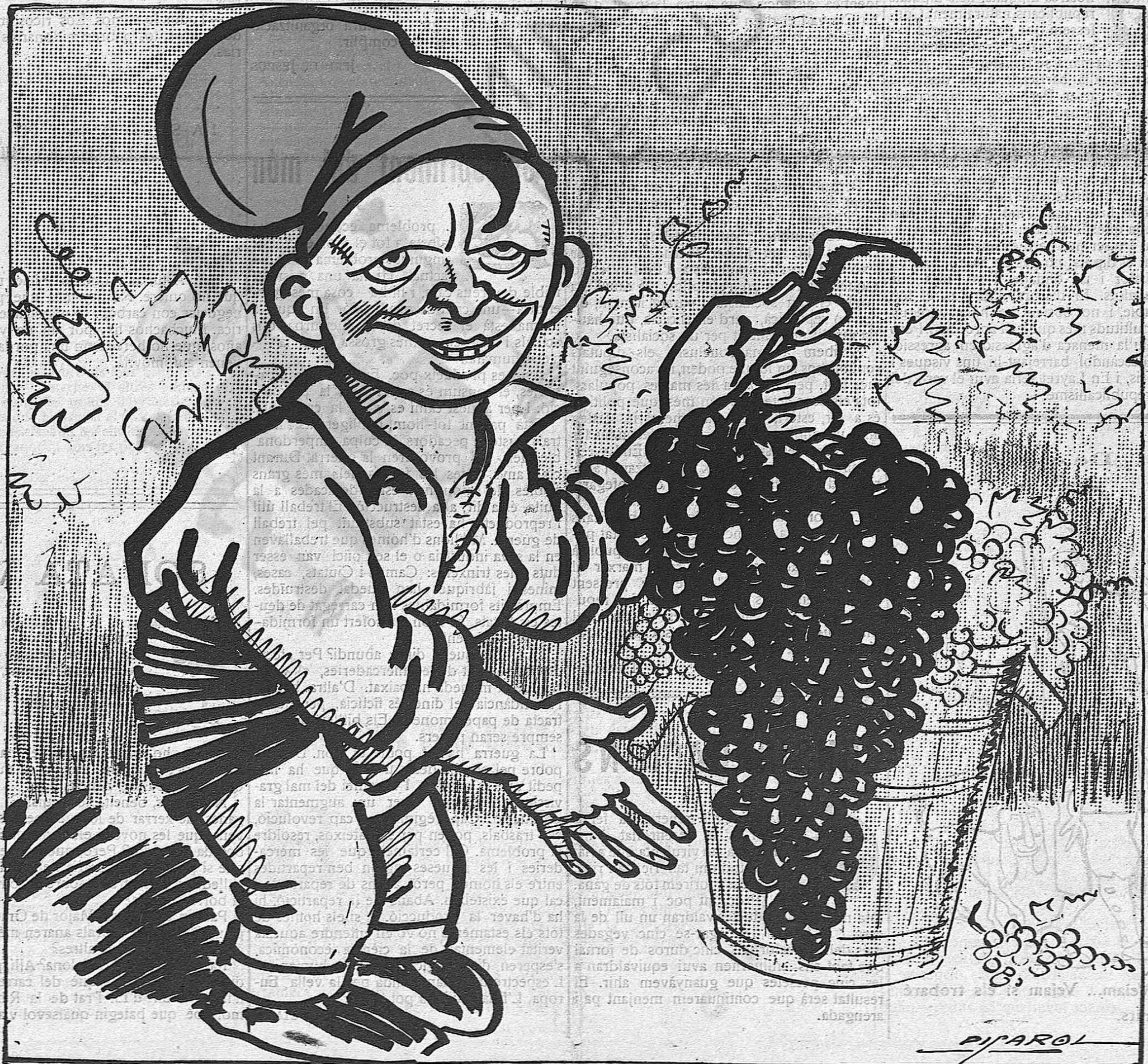
— Aixó és una "vinya", sí sinyor,... però'm costa les meves suors; vui dir que els raims han d'ésser per a mí.