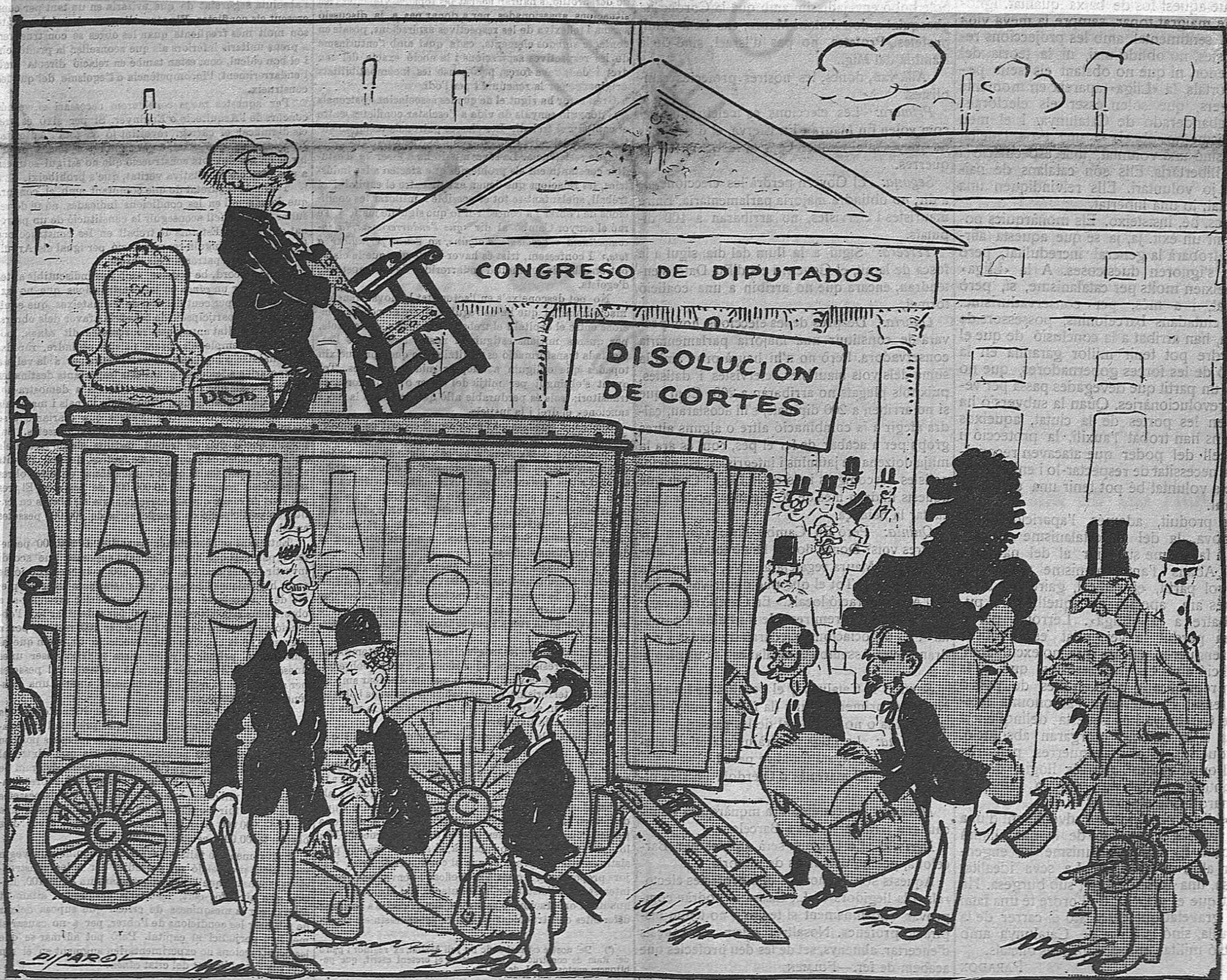
—Ansia, companys; carreguem la conductora i cap a casa falta gent.