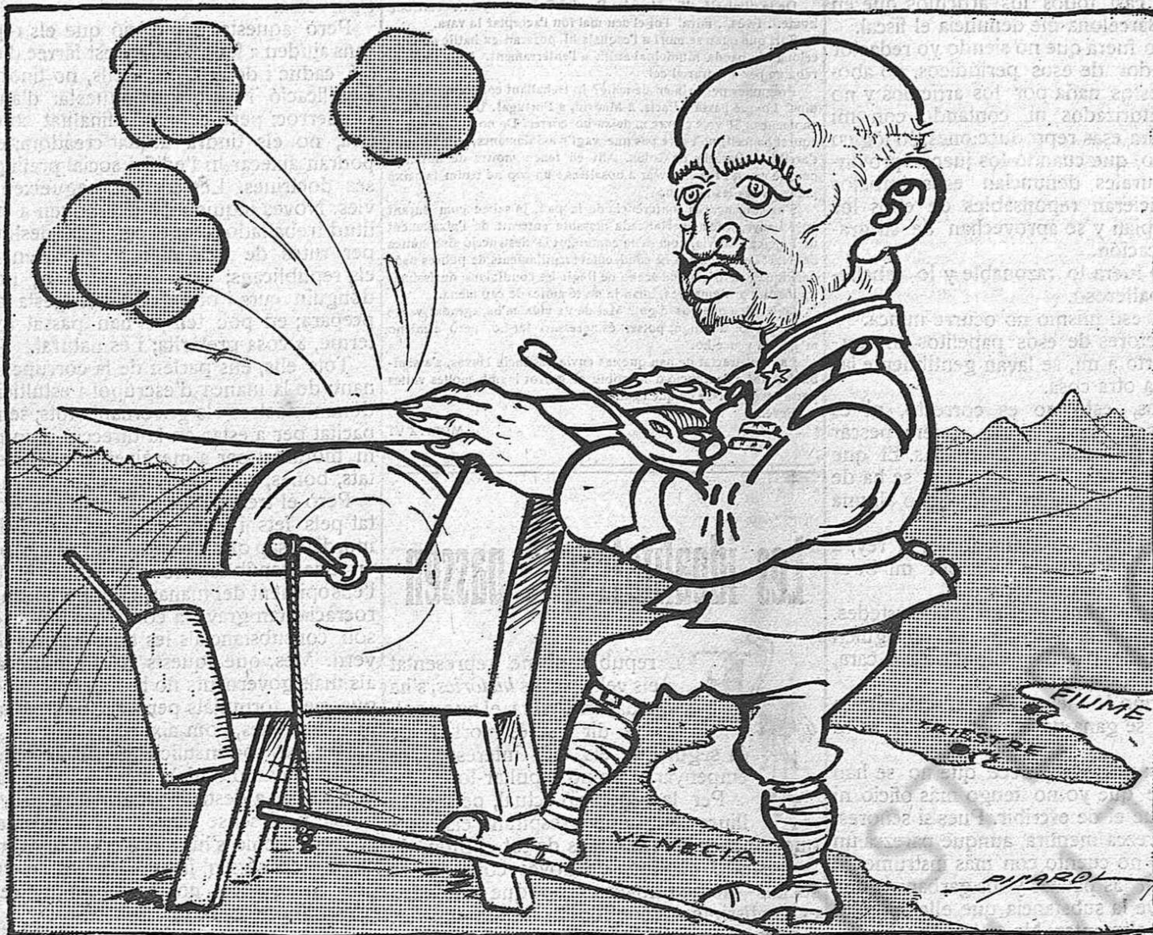
—Aquí l'únic mal, que hi ha és que, esmolant-lo, esmolant-lo, aviat se'ns gastarà.