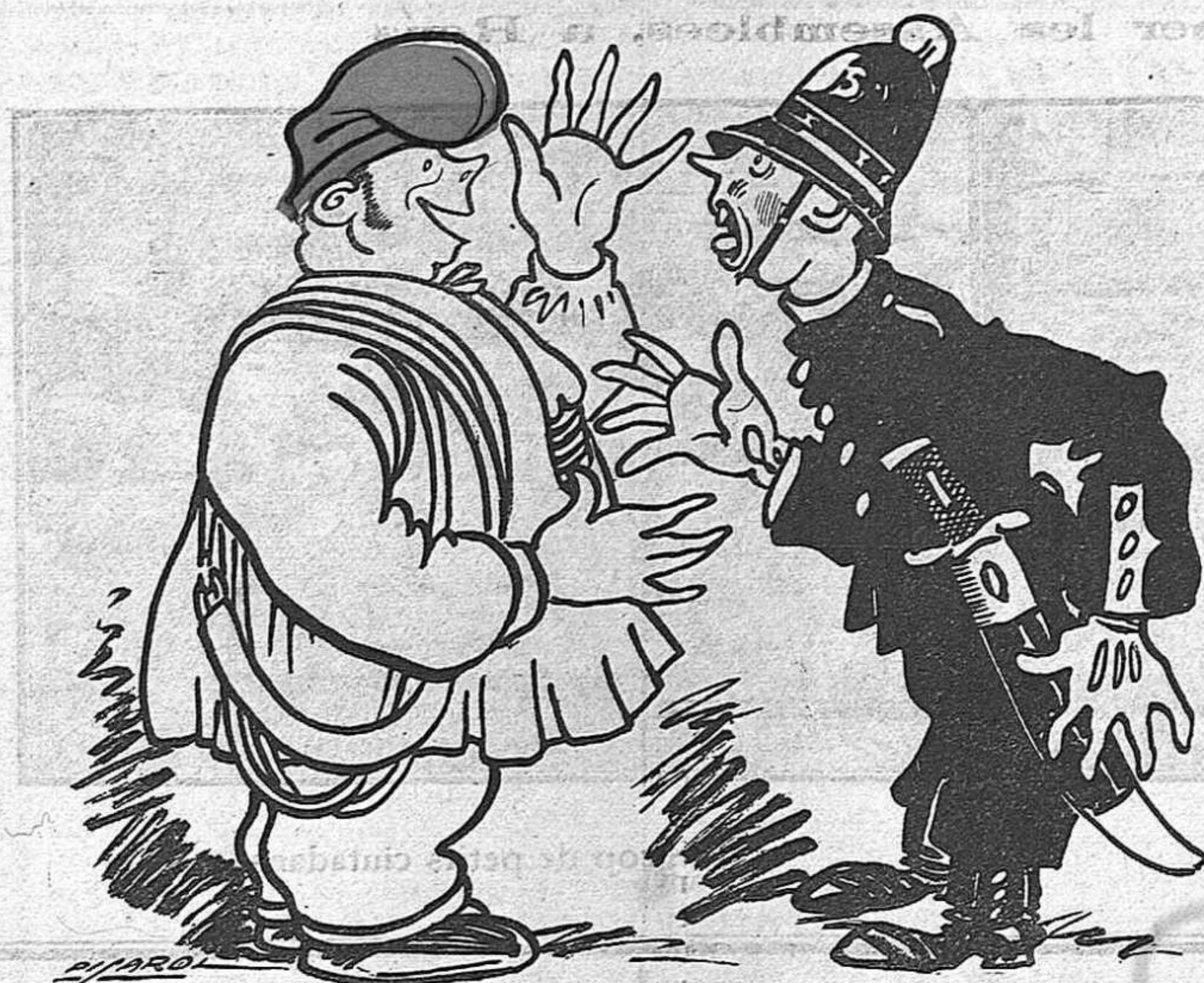
—No me confundá usted, que servidort es mosso de cuerda.

¿Que es la ciudad de más mendigos del universo? Eso no quita. ¿Que es la ciudad de los golfos y de las puñaladas a las muje-