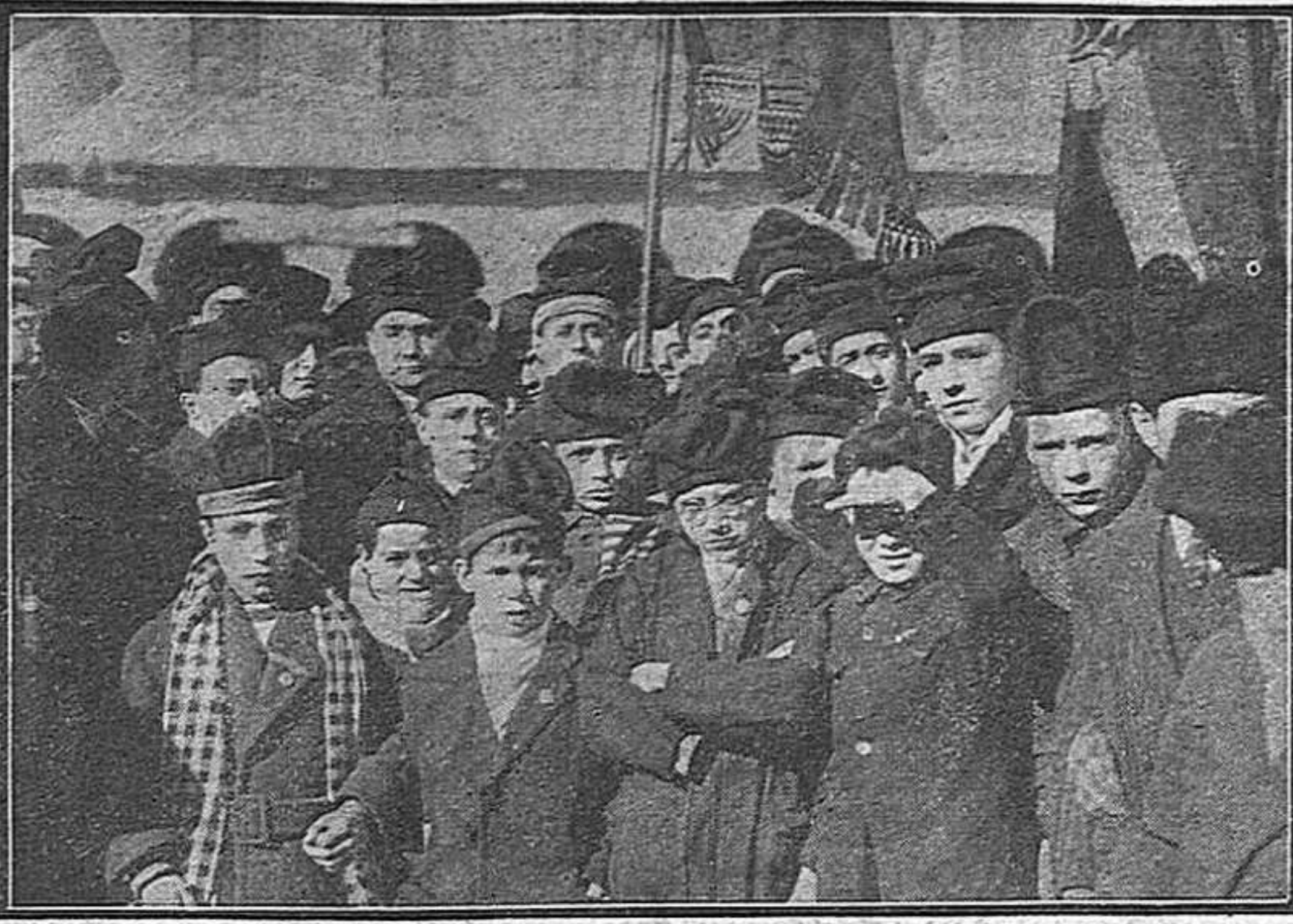
Un grup de petits ciutadans