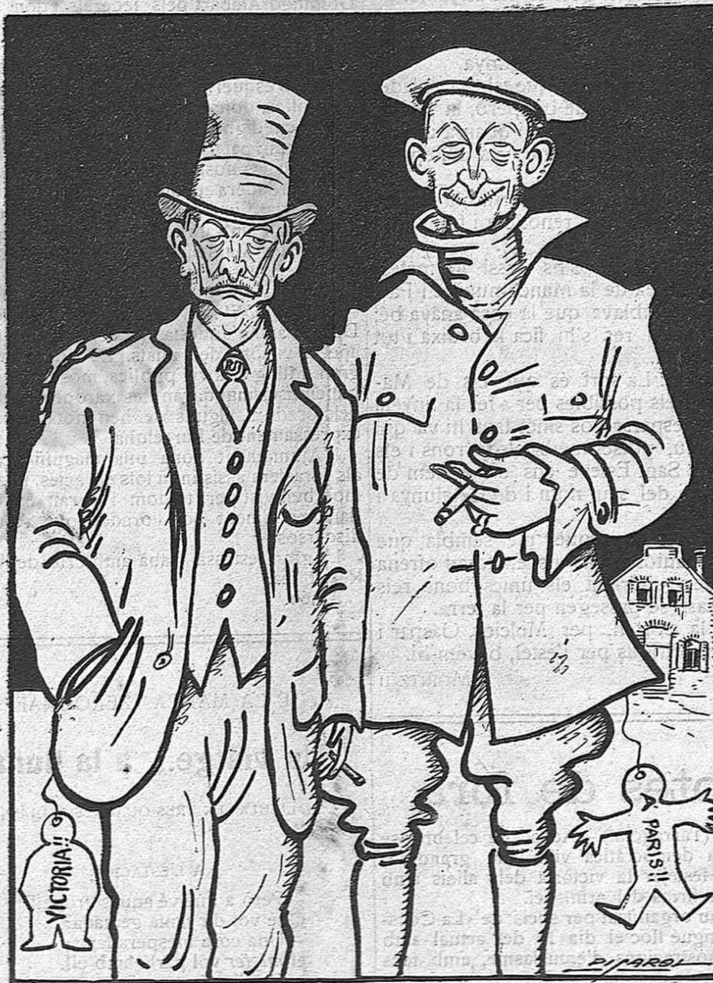
—No dissimulem, papà. Nosaltres som els dos més grans innocents de l'any.

Absurde!... Absurde!... Els veïns de la Plaça Nova han dedicat una gran festa a Sant Roc «pel motiu d'haver sigut en aquell barri molt escasses les víctimes de la passa».