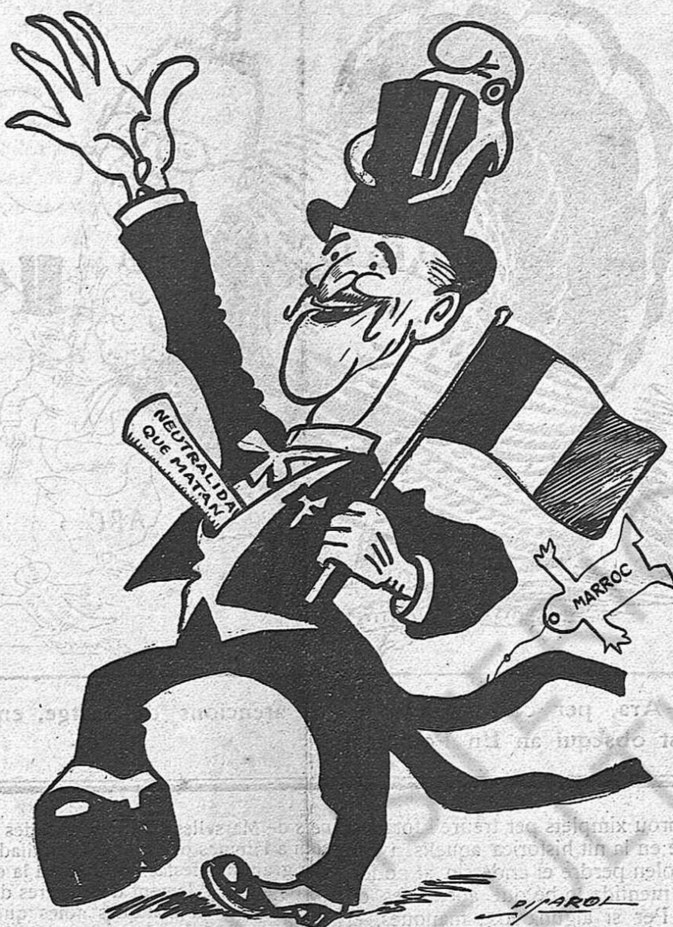
—«Allons, enfants de la Patrie!...»