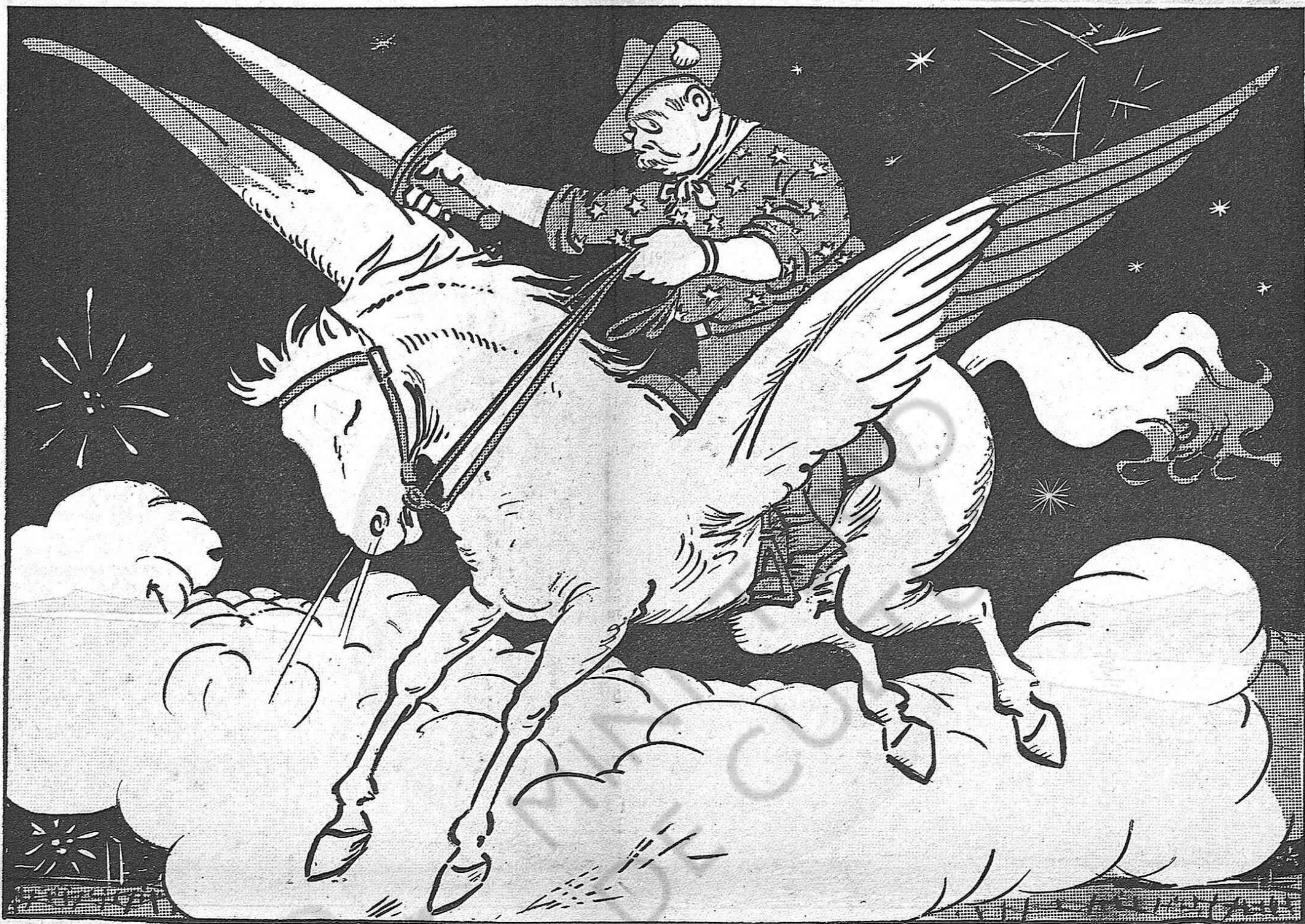
El Sant Jaume Americà

han fet uns 25,000 presoners alemanys i han pres més de 400 canons. Es tracta, doncs, de la segona victòria del Marne. Tota la situació estratègica apareix ara canviada en favor dels al·liats.