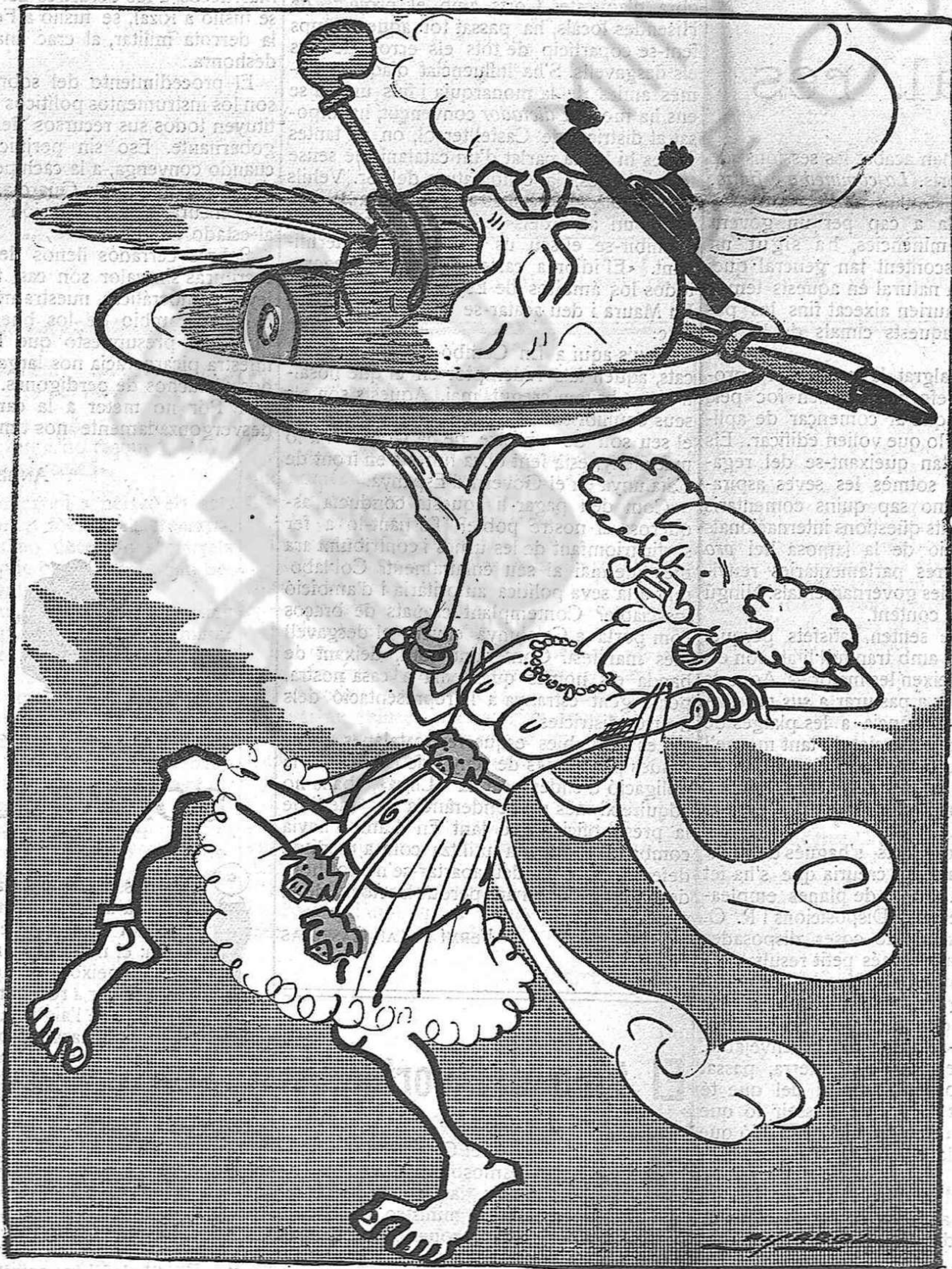
Salomé en la dança dels sets vels