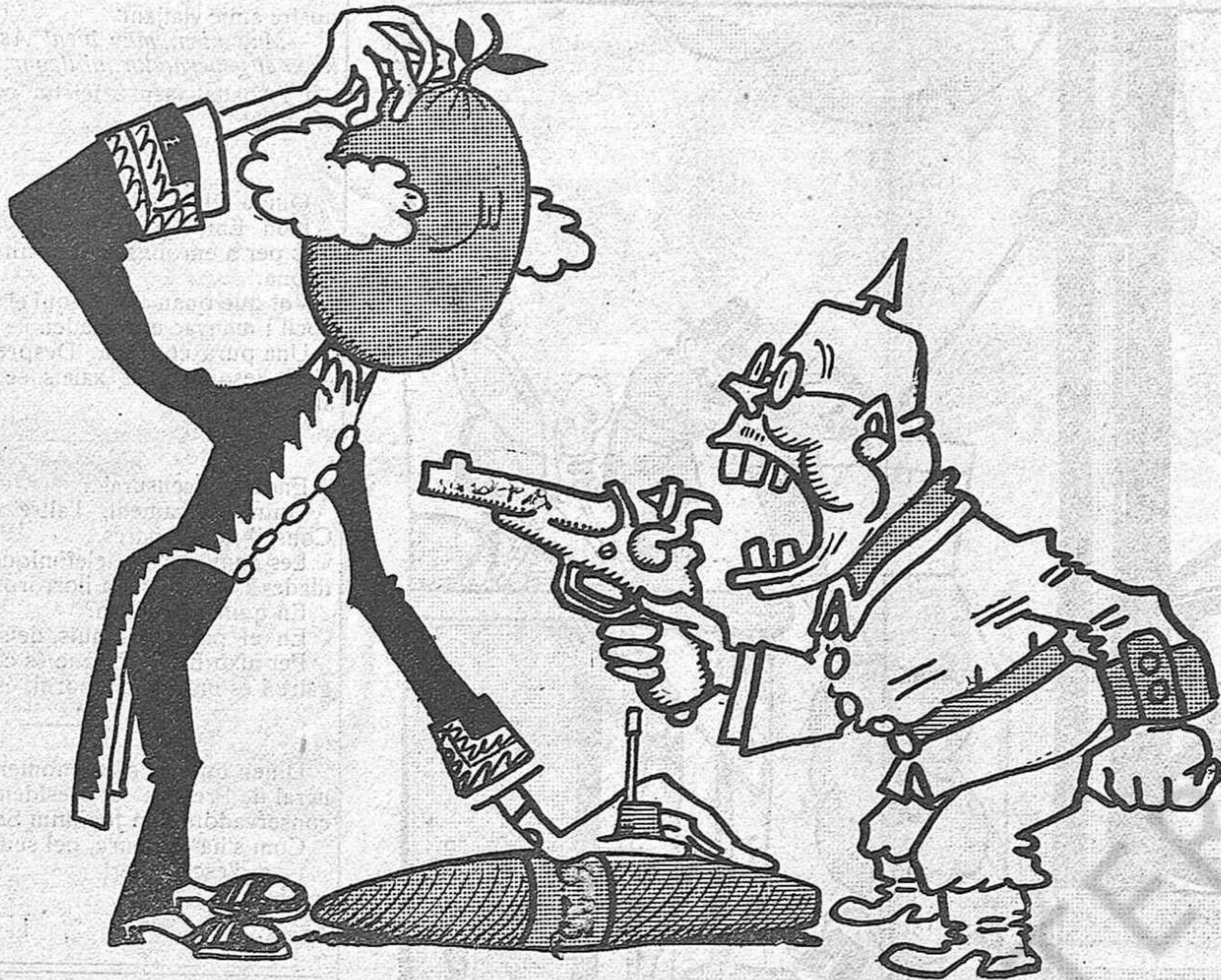
- No, home, si és un encenedor automàtic per a encendre el puro!...

han inaugurado los hermanos Quintero con una cuyo tema era «Españolismo». Solo le faltaba a Zaragoza que ese par de cretinos andaluces fueran a acabar de embrutecerla el alma, sembrando en ella la mala semilla de su patriotismo mentidor y de su españolismo de zarzuela. Los Quintero han ido a Zaragoza a recrear con su guitarra morisca los oídos de Paraíso y a hacer más pesado el sueño de Aragón, el encanto maléfico que embota sus sentidos. El patriotismo de los Quintero nos parece para el espíritu lo que los higos de Royo para el cuerpo, un alimento insuficiente. ¡Miserable pueblo! ¿Quieres pan? ¿Quieres cultura? Pues toma higos, o mejor higas; toma chistes y sensiblerías de los Quintero.