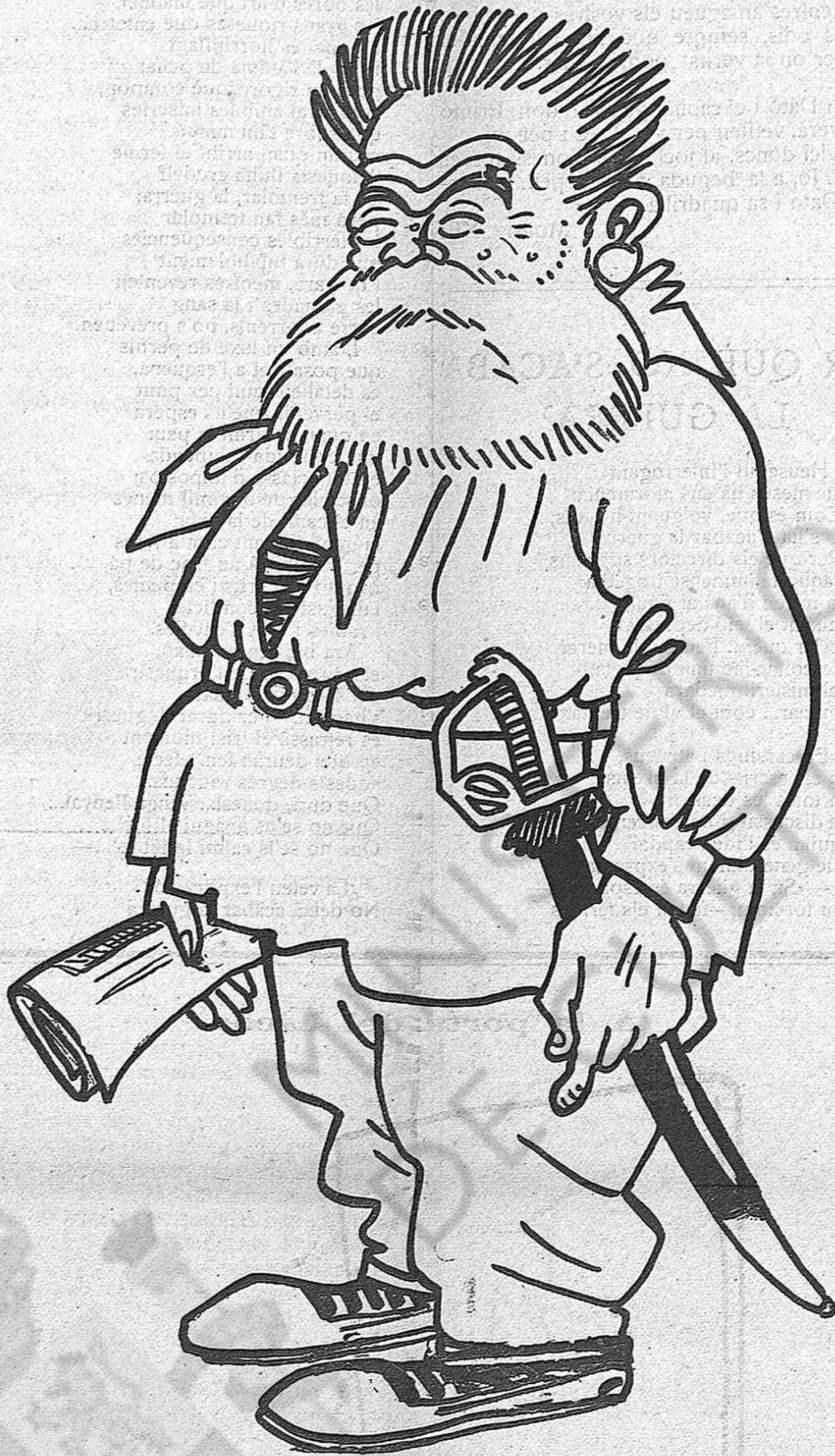
Uniforme de guarda-passeyos que aquest any se portarà molt

dors catòlics: en comptes de pensar en els hos- pitals pels pobres, pensen en les fàbriques de capellans.