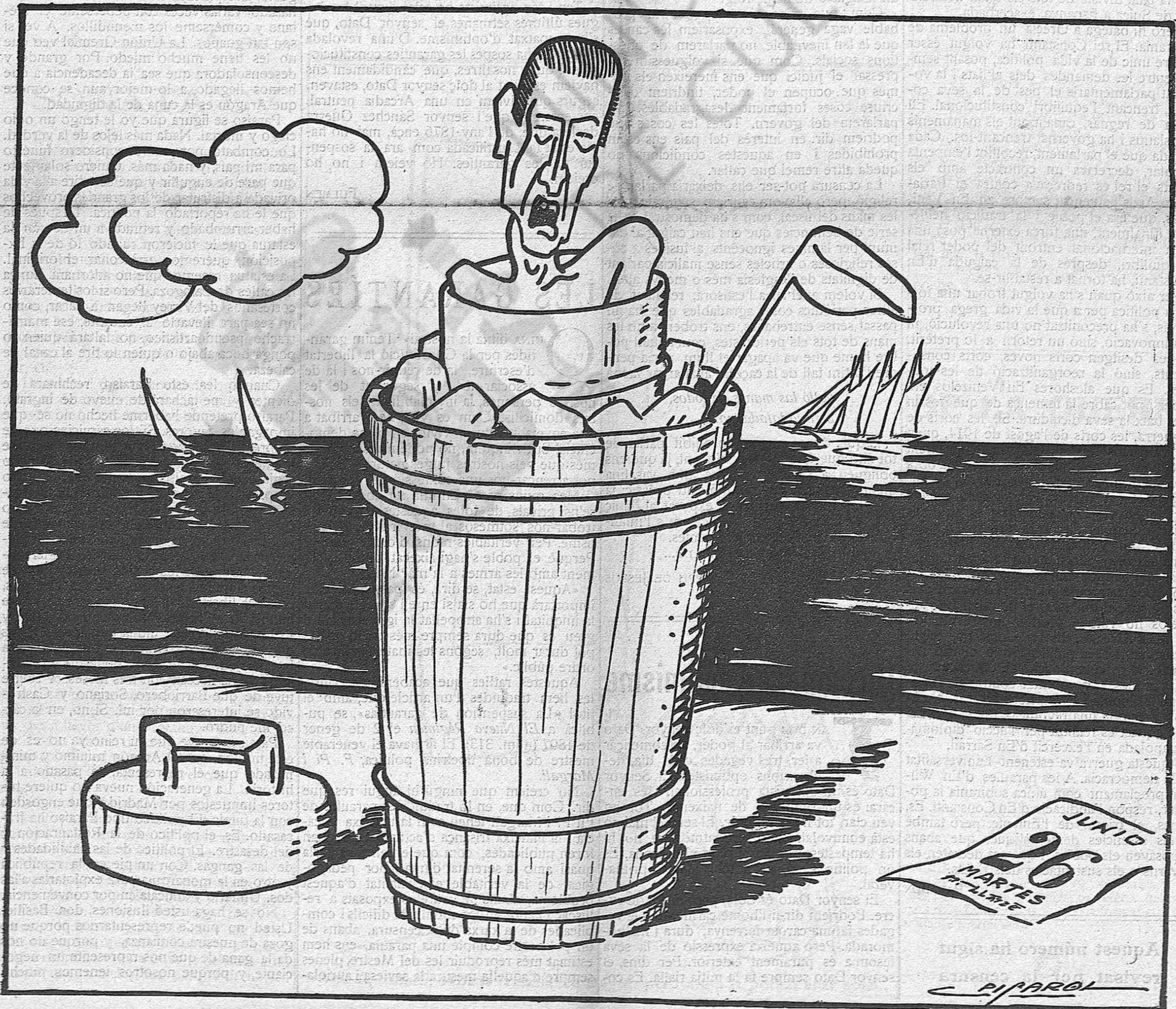
— Ja ho poden veure: fresquets i alegrets!...