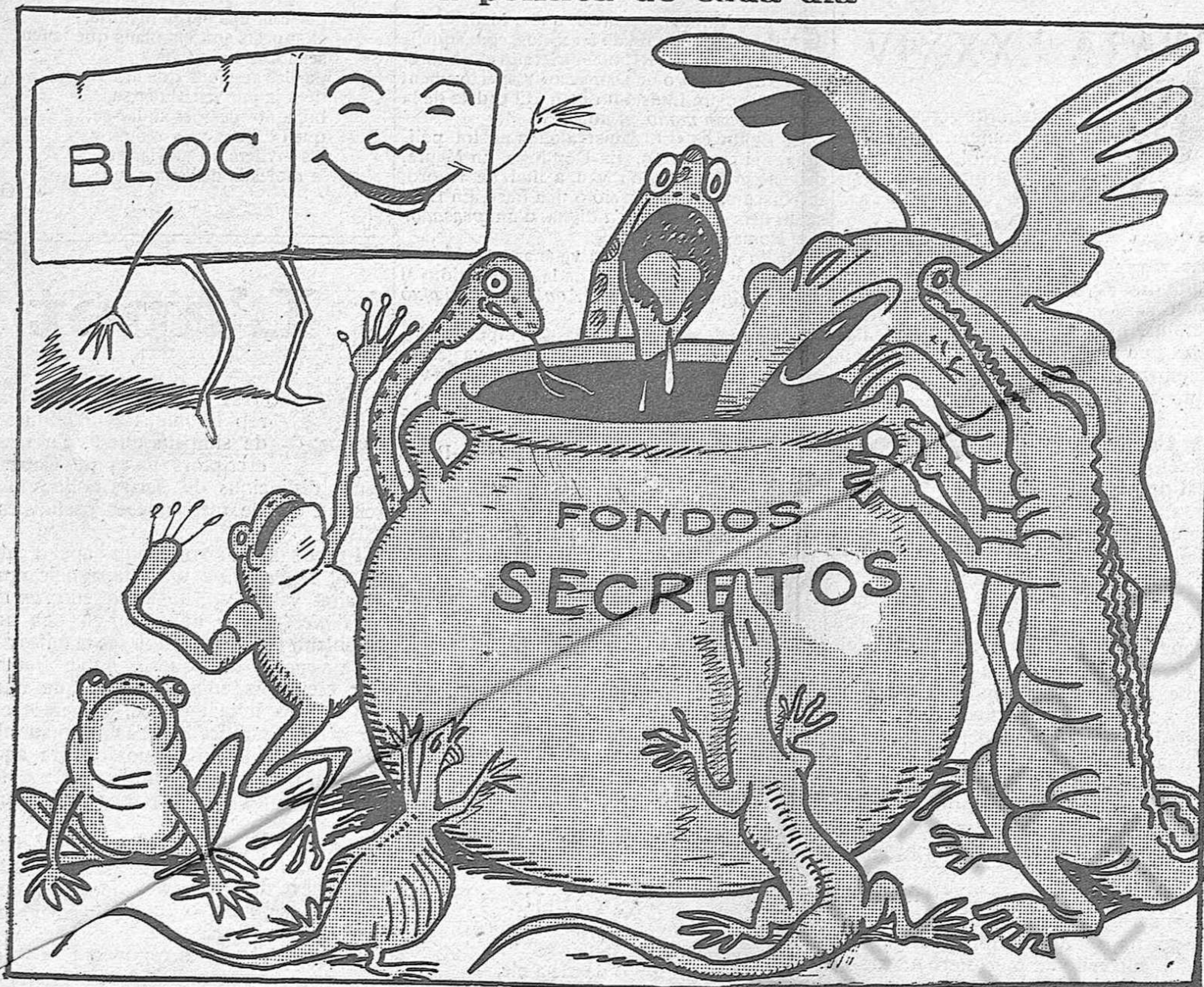
La unió dels republicans.