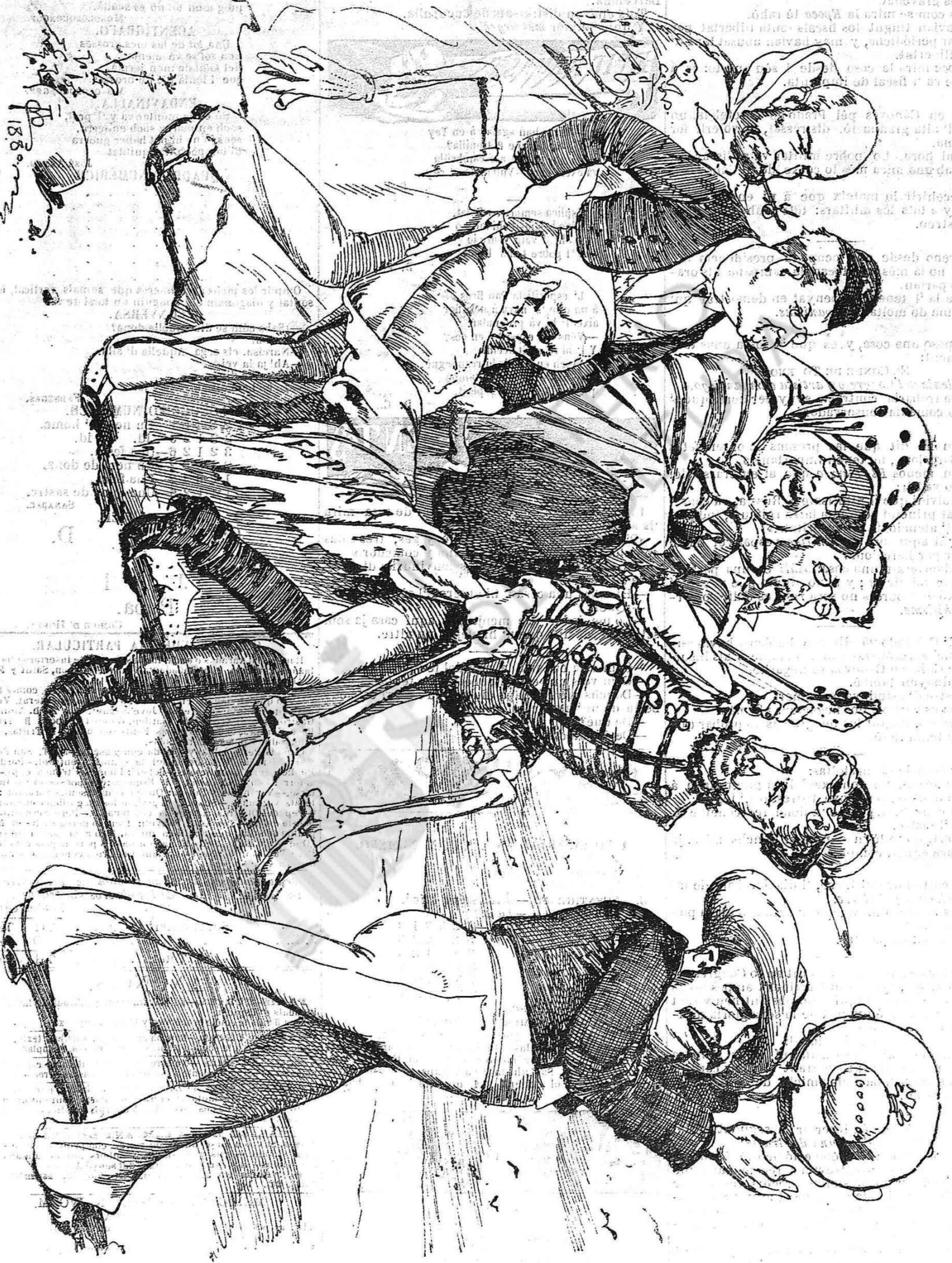
Costums d' Madrid.—I, enterro de la Sardina.