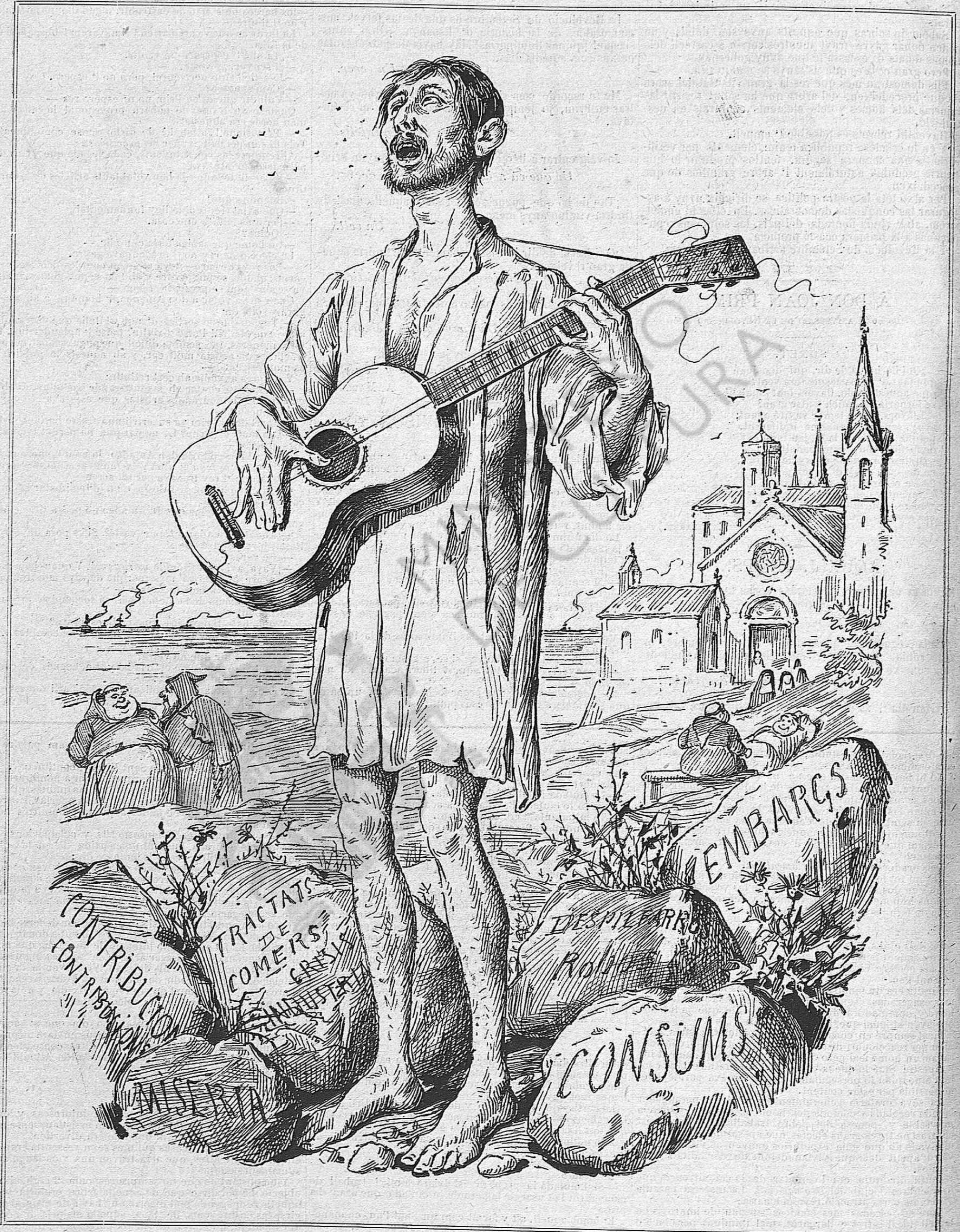
Estat en que quedarà l' últim espanyol, seguint las cosas com van.