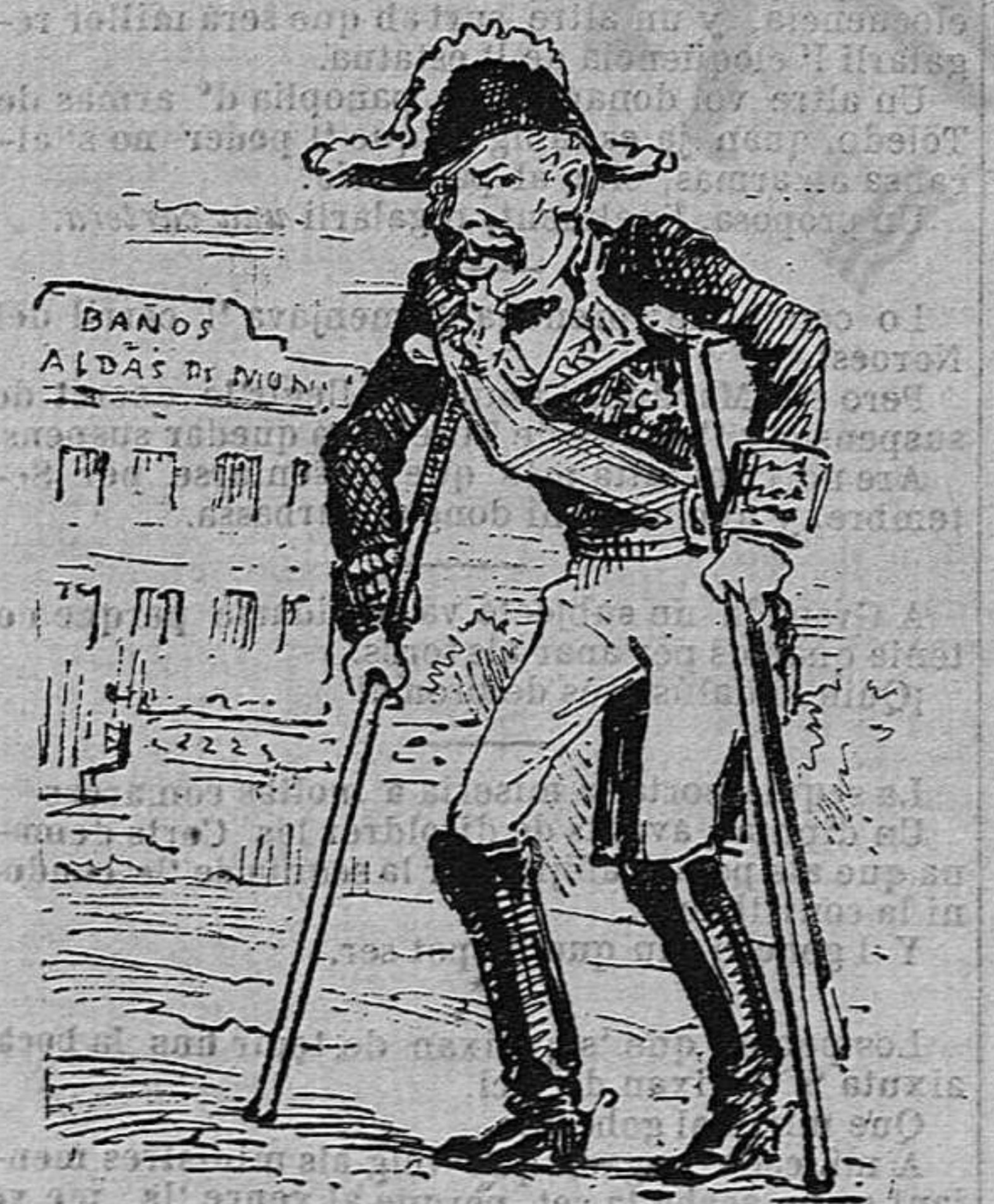
Un de fret que vá á Caldás perque l' escalfin.