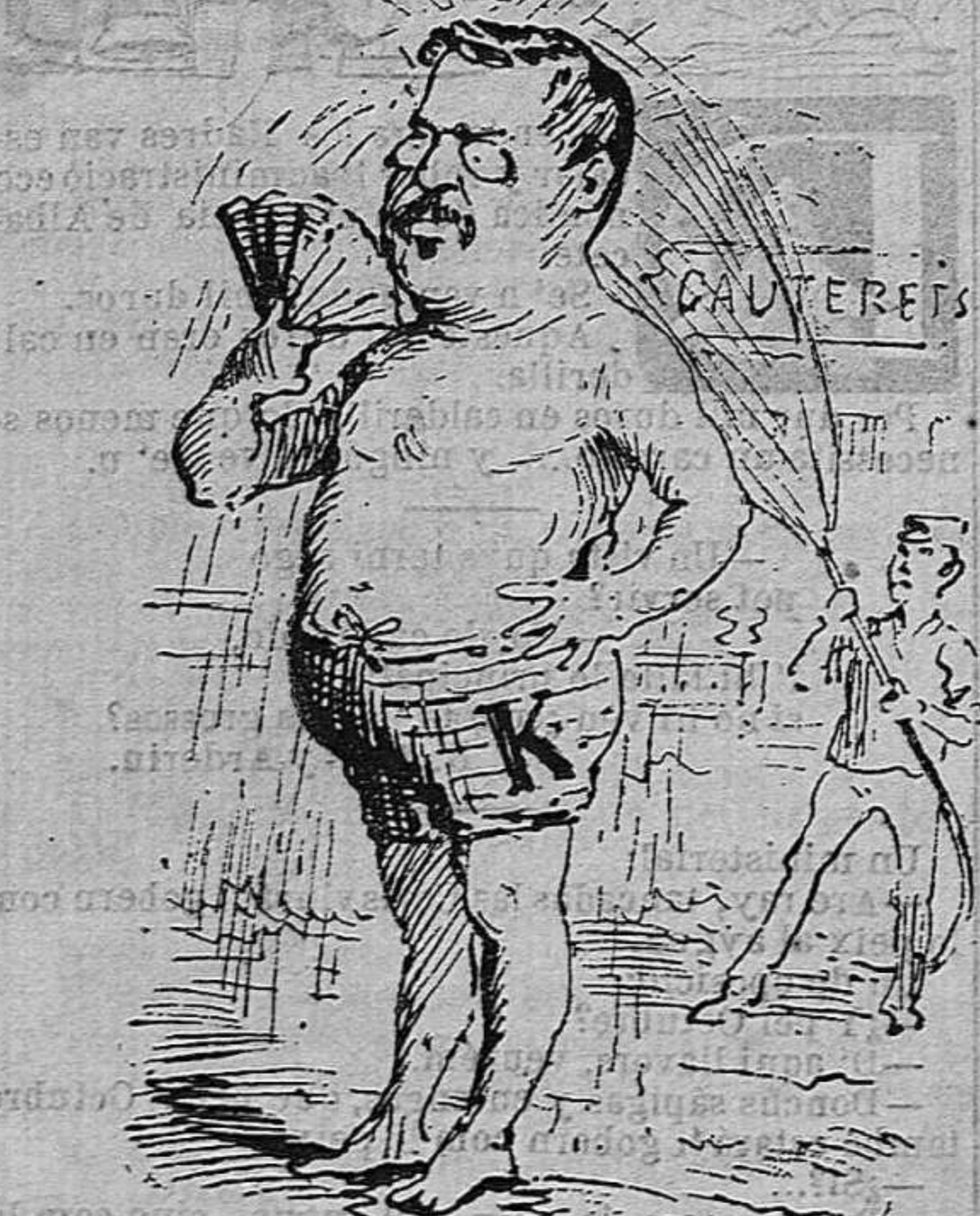
Un de fogós que vá á Cauterets perque 'l refresquin.