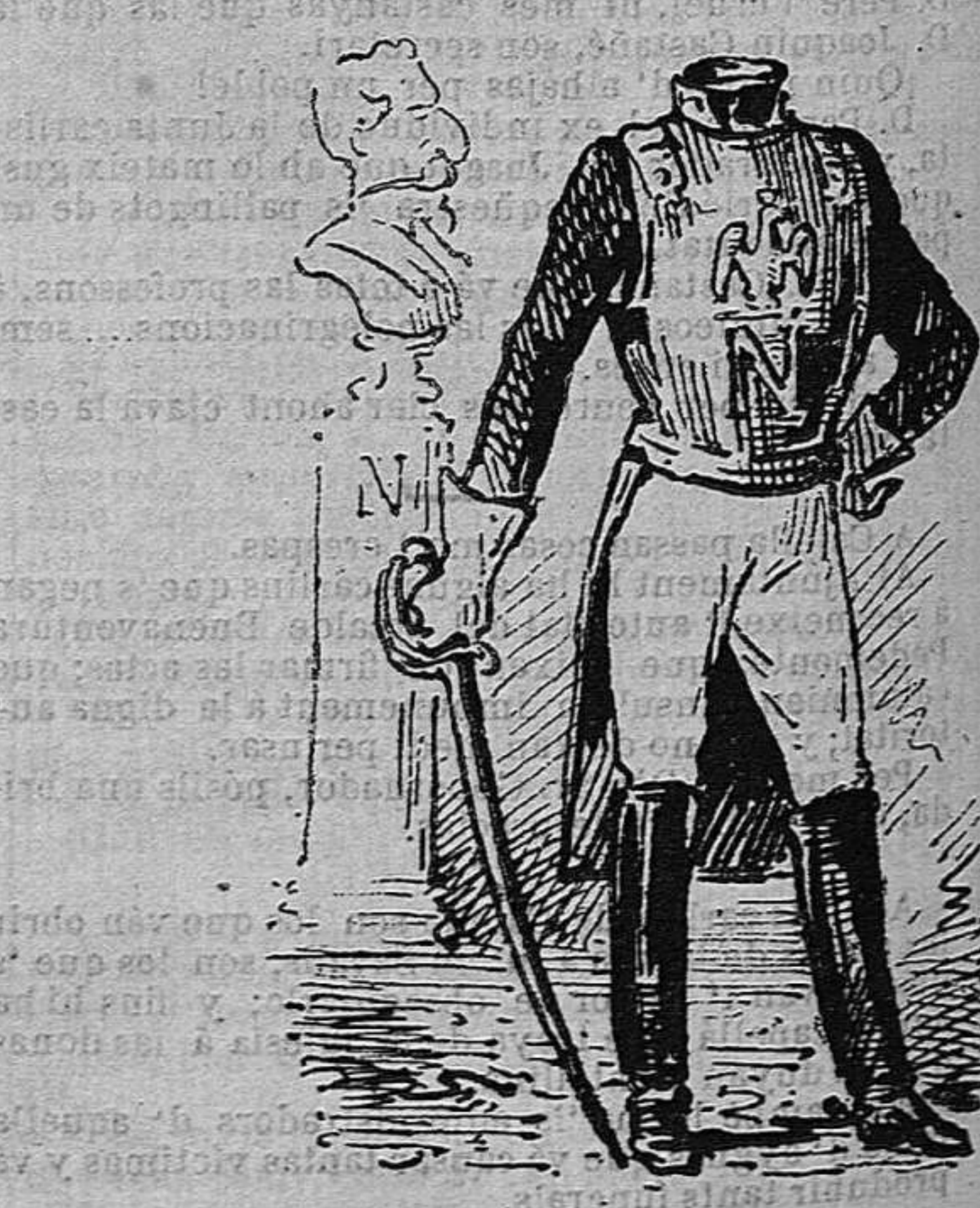
Los imperialistas francesos han perdut lo cap, y demanan qui 'ls en fassi un de nou.