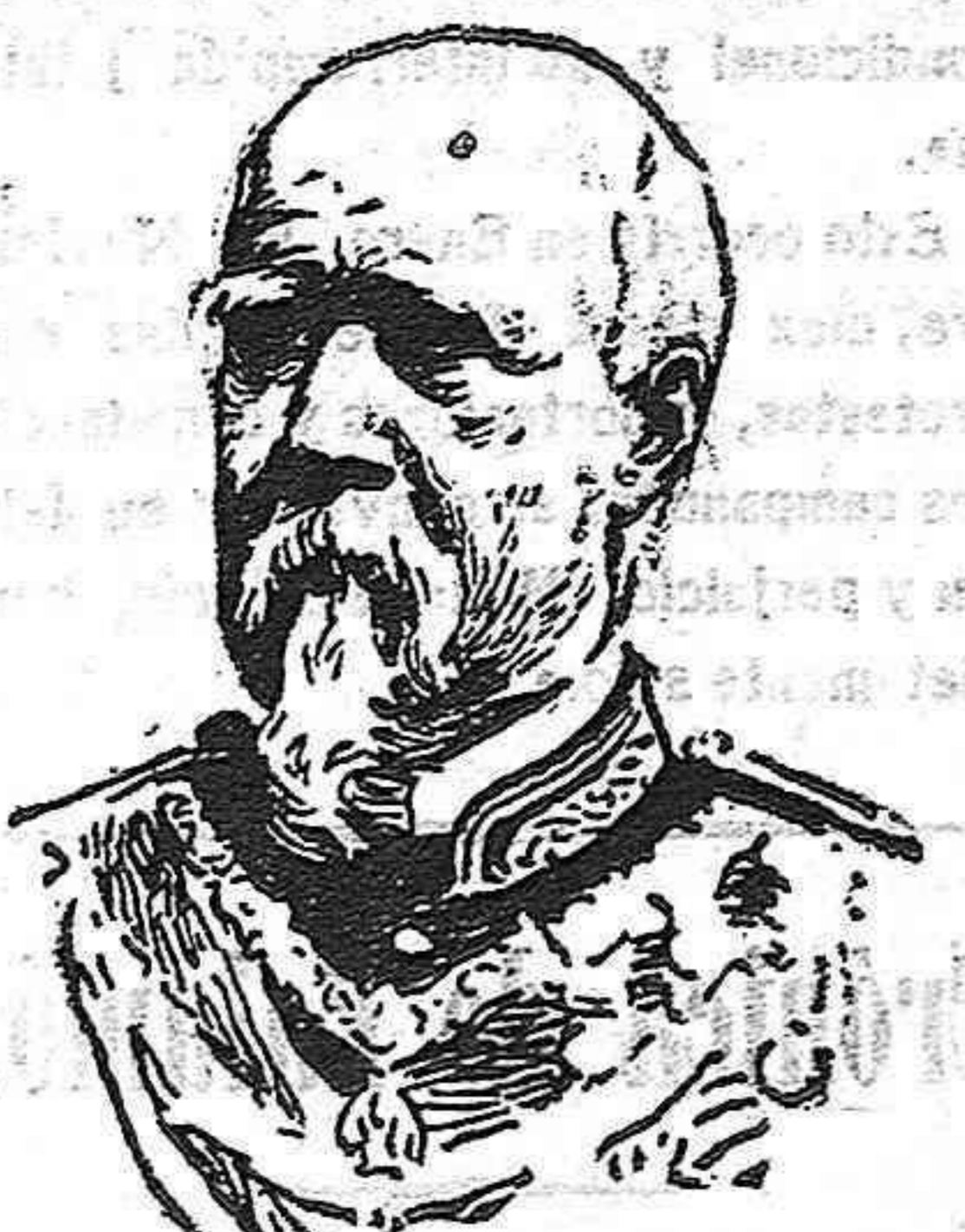
El general don Marcelo de Azcárate, designado por el gobierno para la presidencia del Senado.