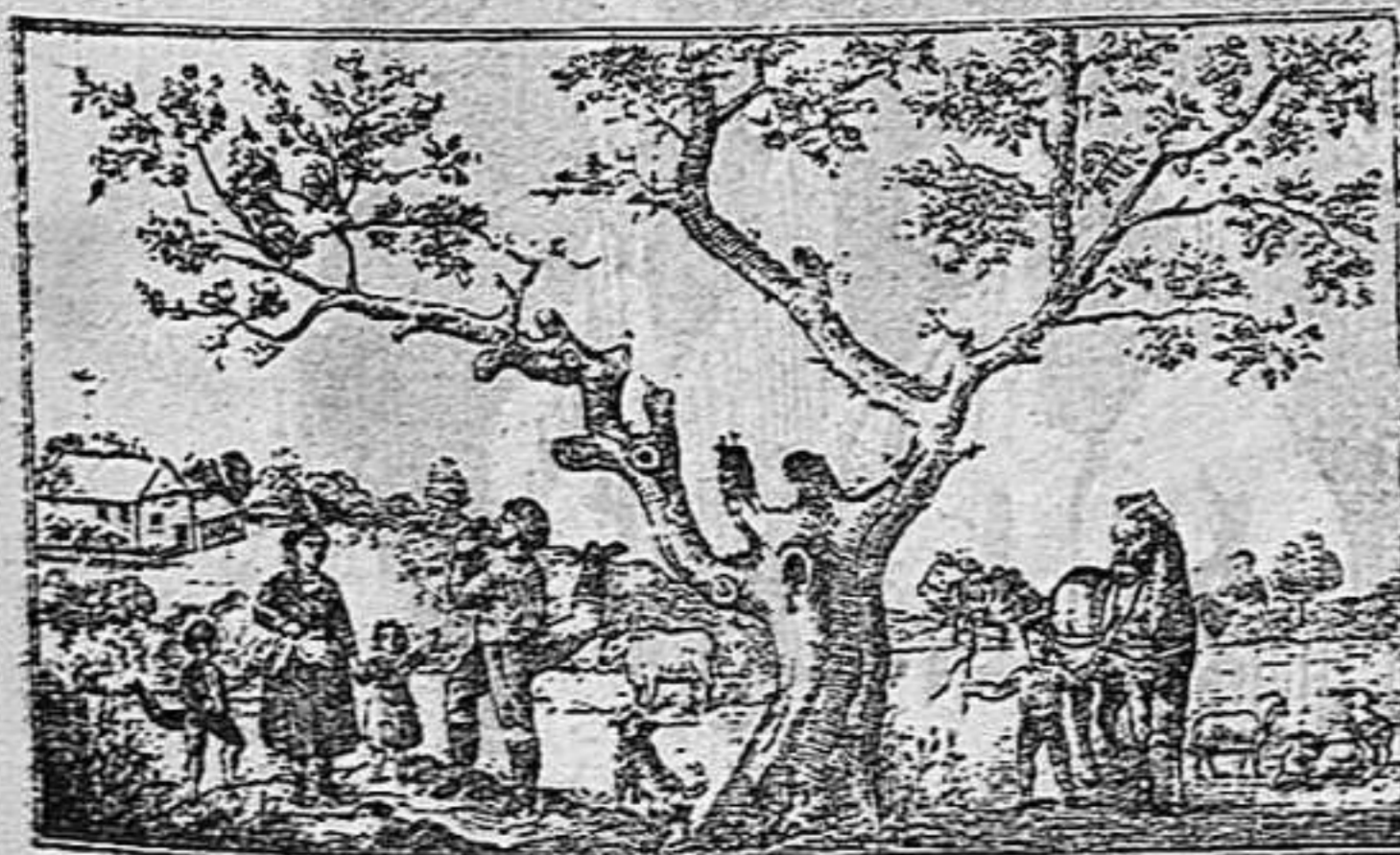
Busquin lo gat.