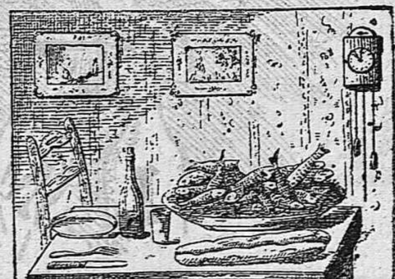
Busquin qui se 'l menjará.