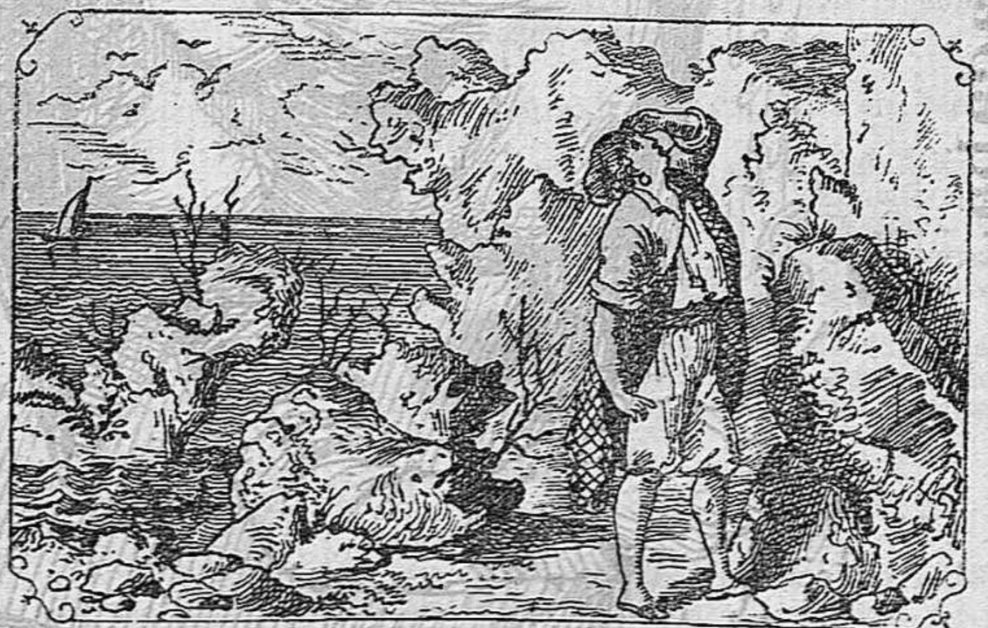
¿Ahont es la séva estimada?