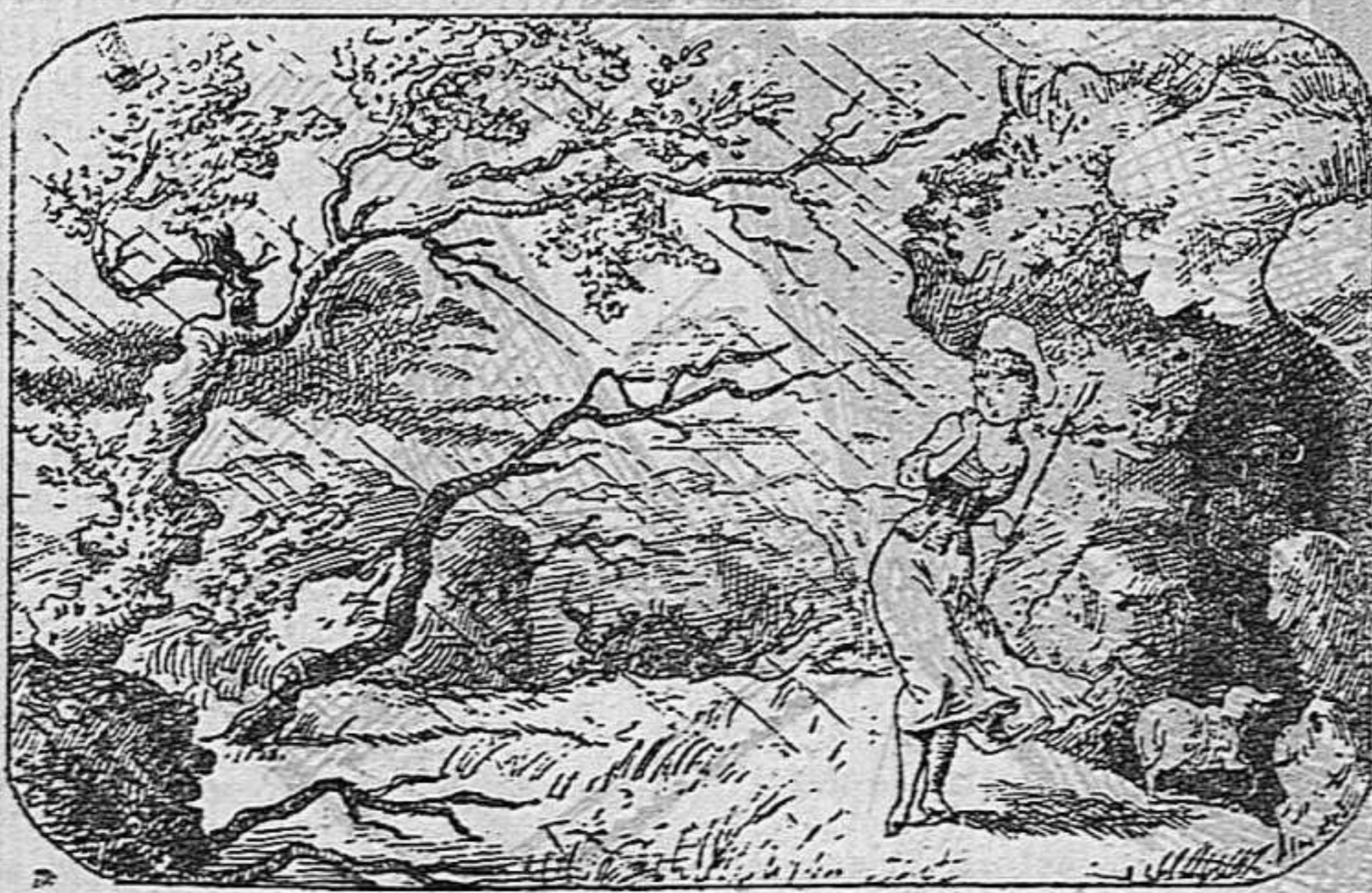
Busqueu 16 caps que se la miran.