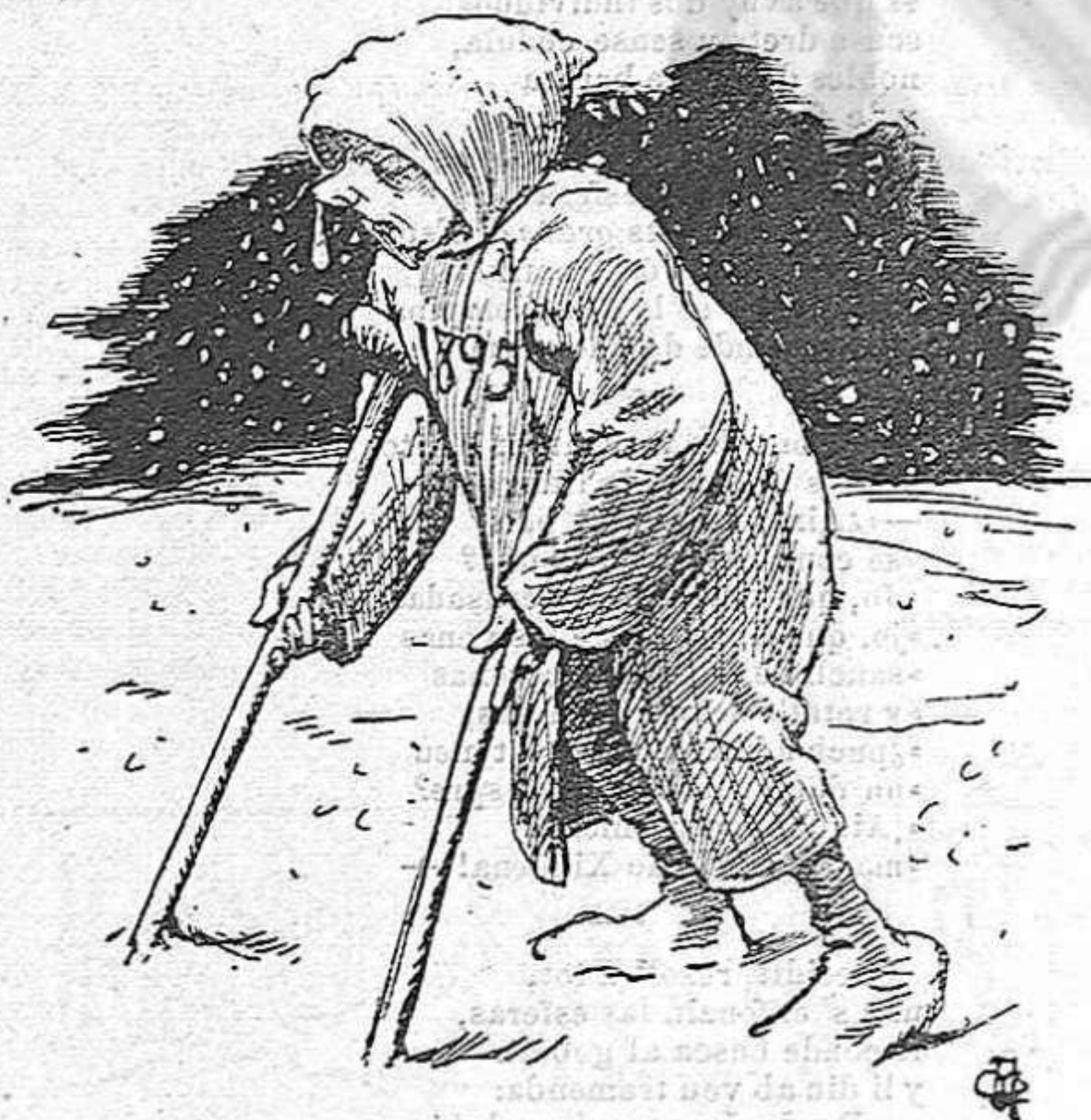
Si això es l' Any nou ¡qué serà quan serà vell!