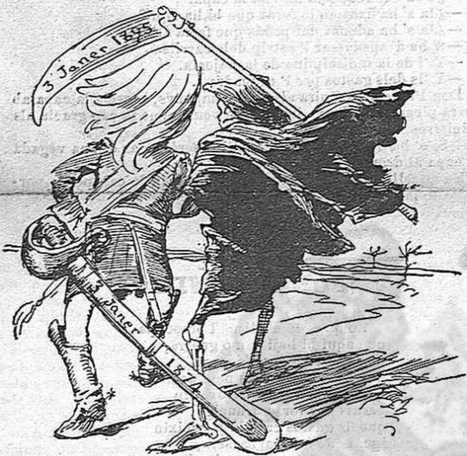
Un aniversari providencial.