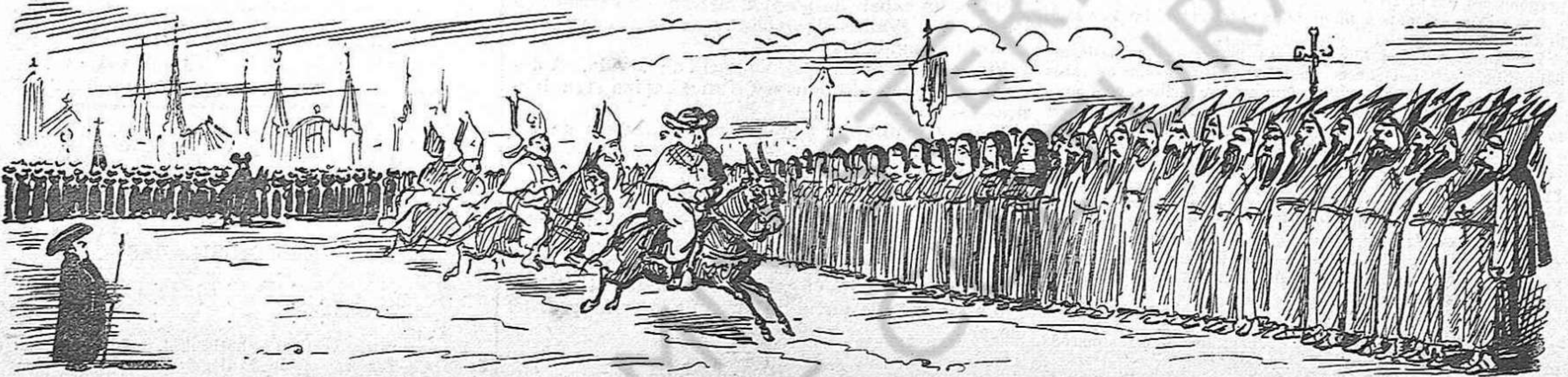
Revistar en gran parada a todas las forsas de la milicia mística.