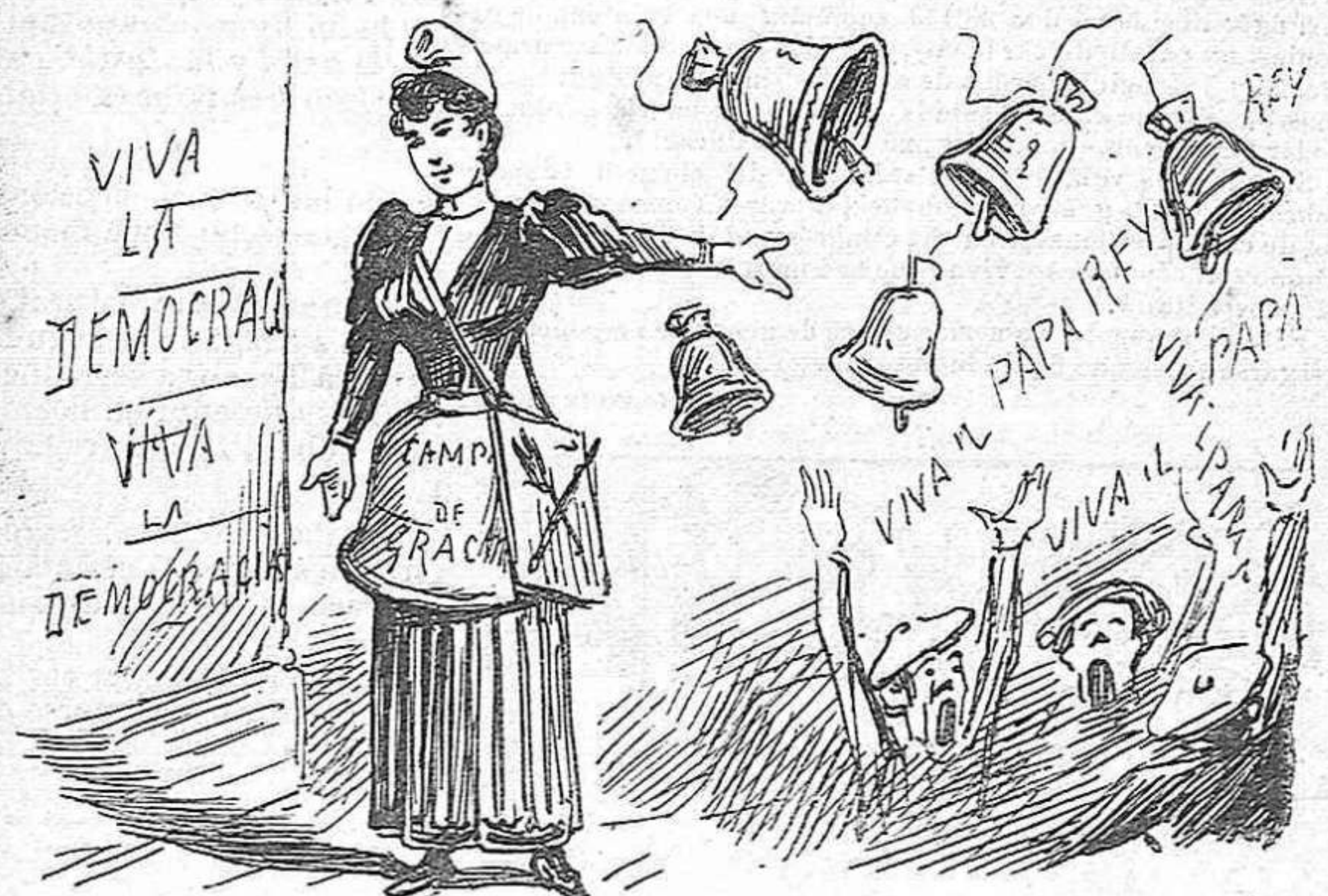
Lo únich que han pogut fer ha sigut fer repicar a todas las campanas de Barcelona, menos una... LA CAMPANA DE GRACIA.