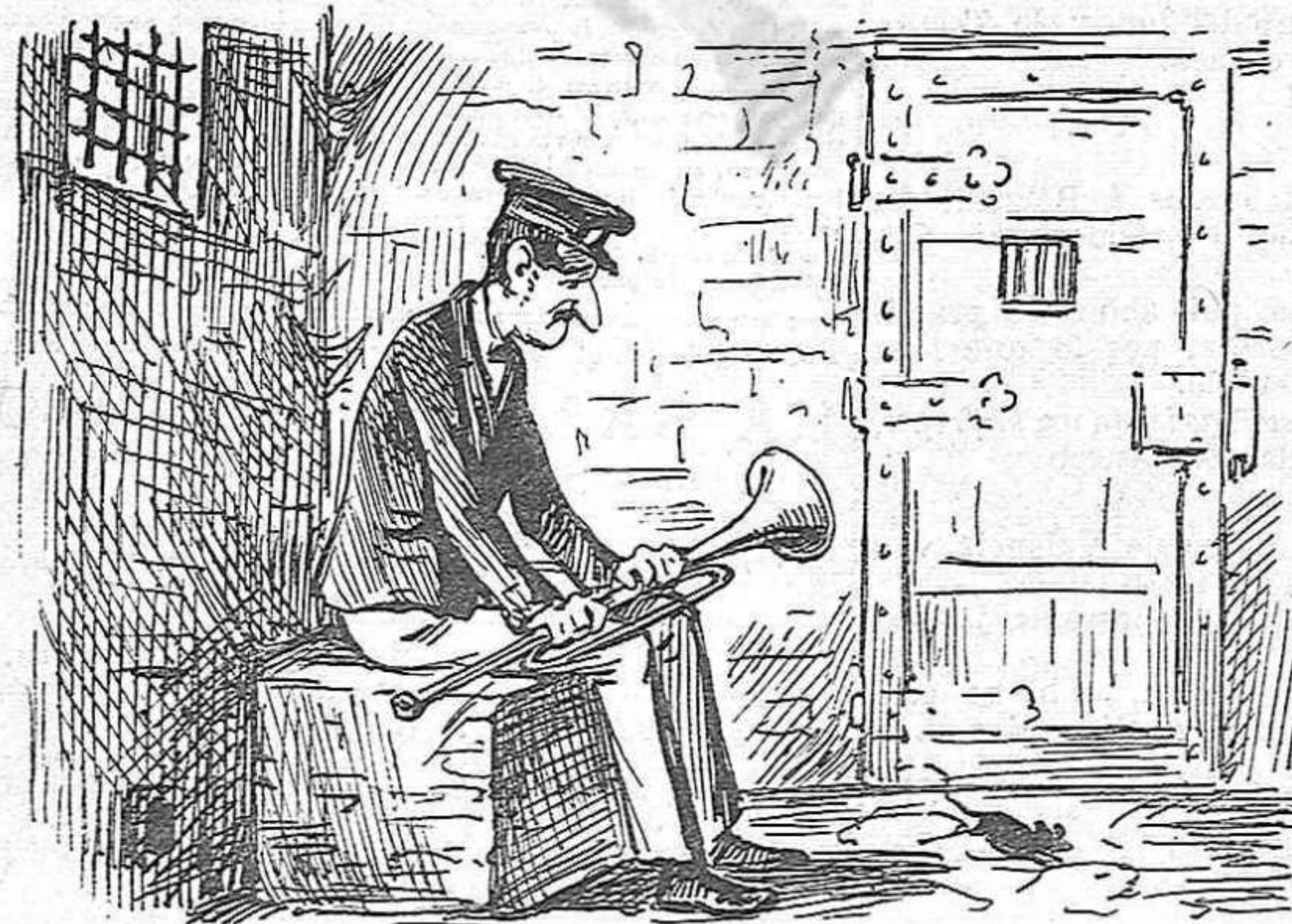
Y finalmente, tancá 'l verdader nunci de Barcelona a la presó, per evitar rossaments y competencias.