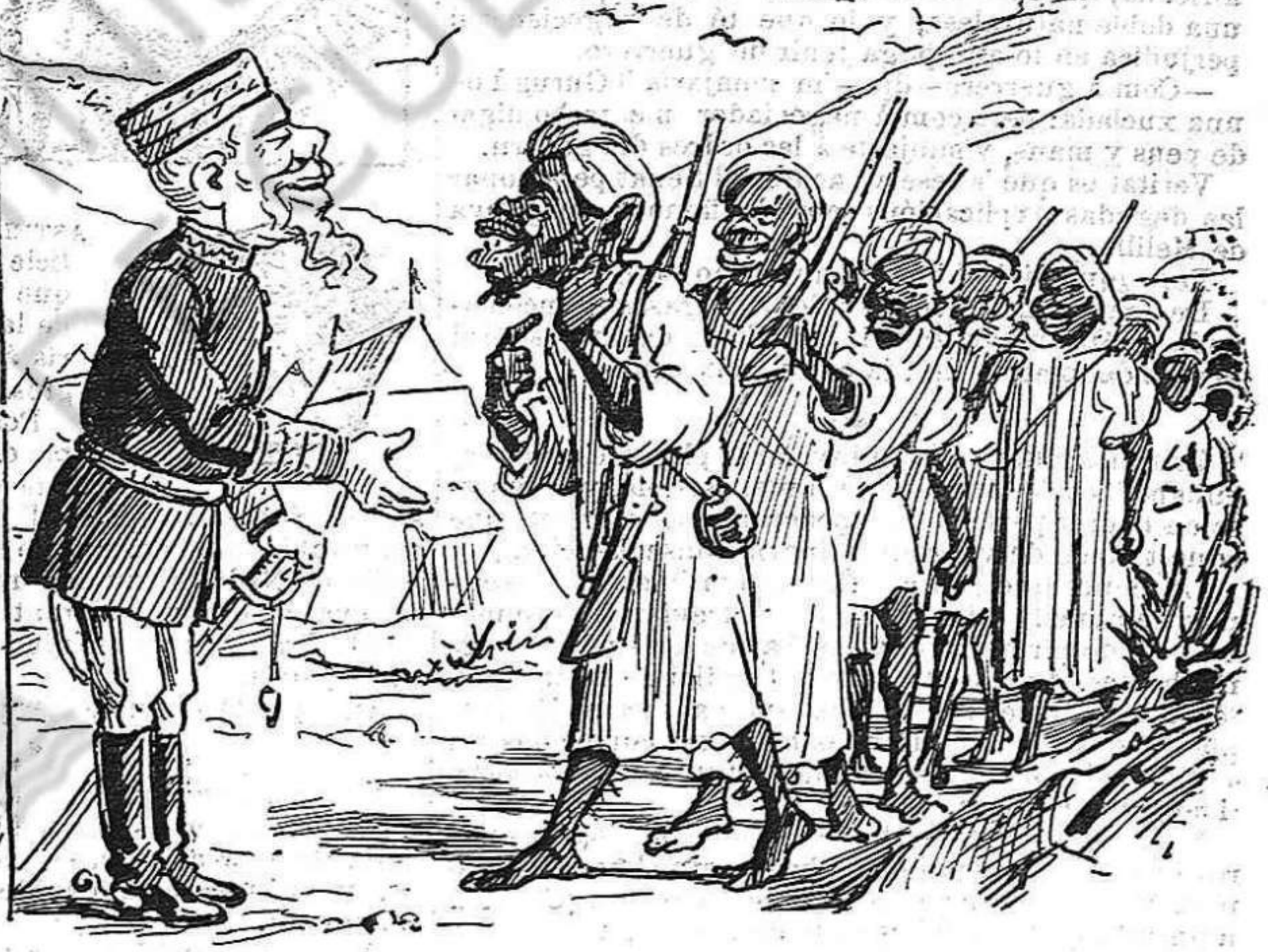
se diu que un gran número de moros de Frajana s' han presentat á Don Arseni dihentli:—General: si li fan pesa, á cent duros cada una comensi á tallar.