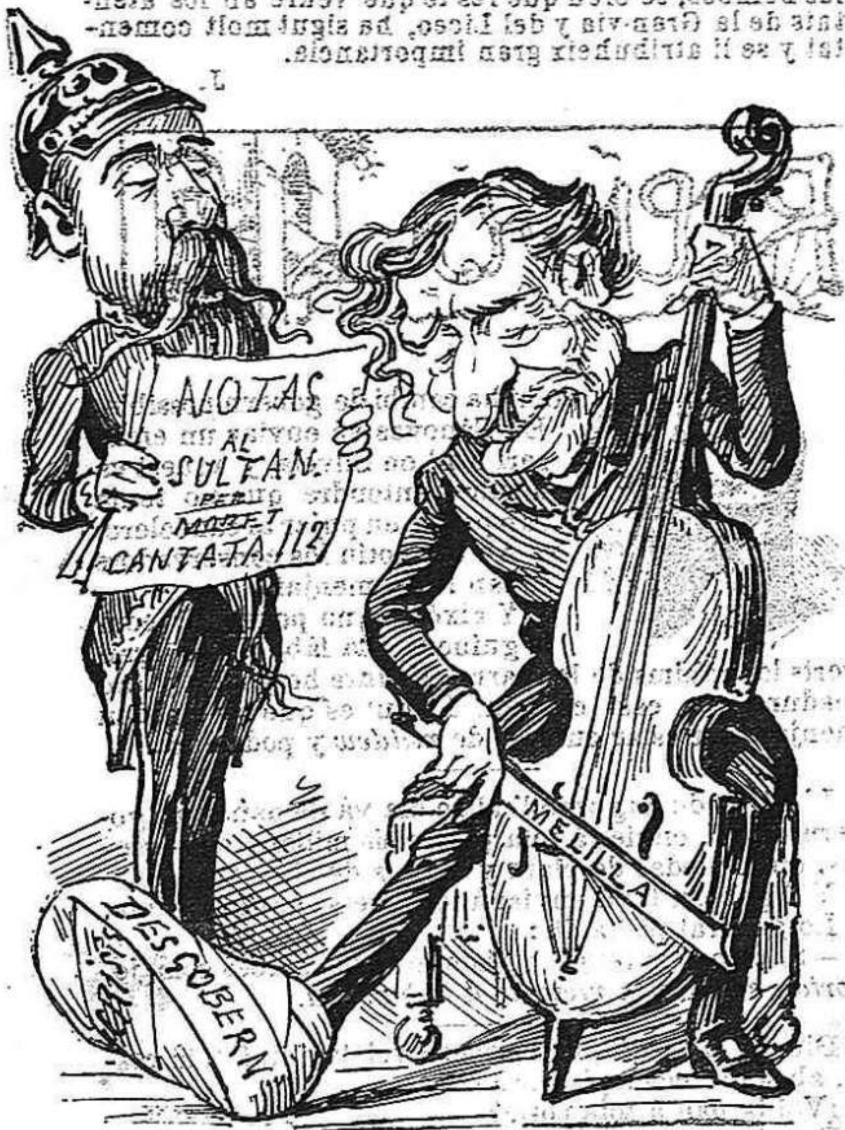
La politica del govern.