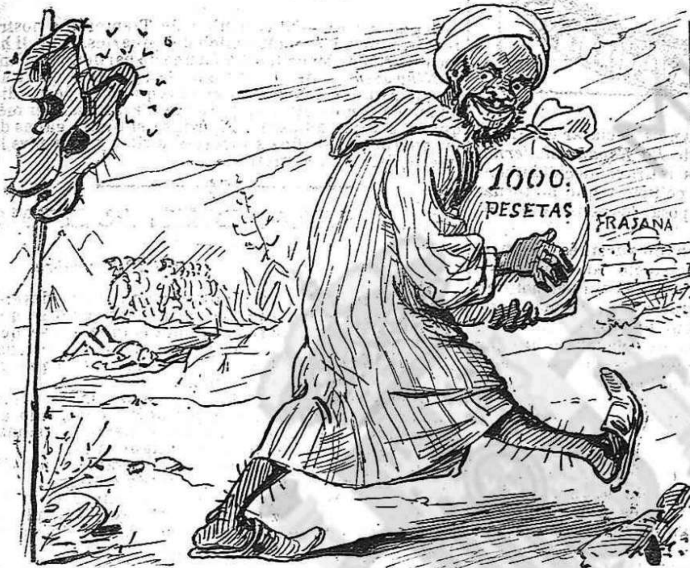
Com que al moro Amadí, per haverli tallat las orelles, van regalarli mil pessetonas;