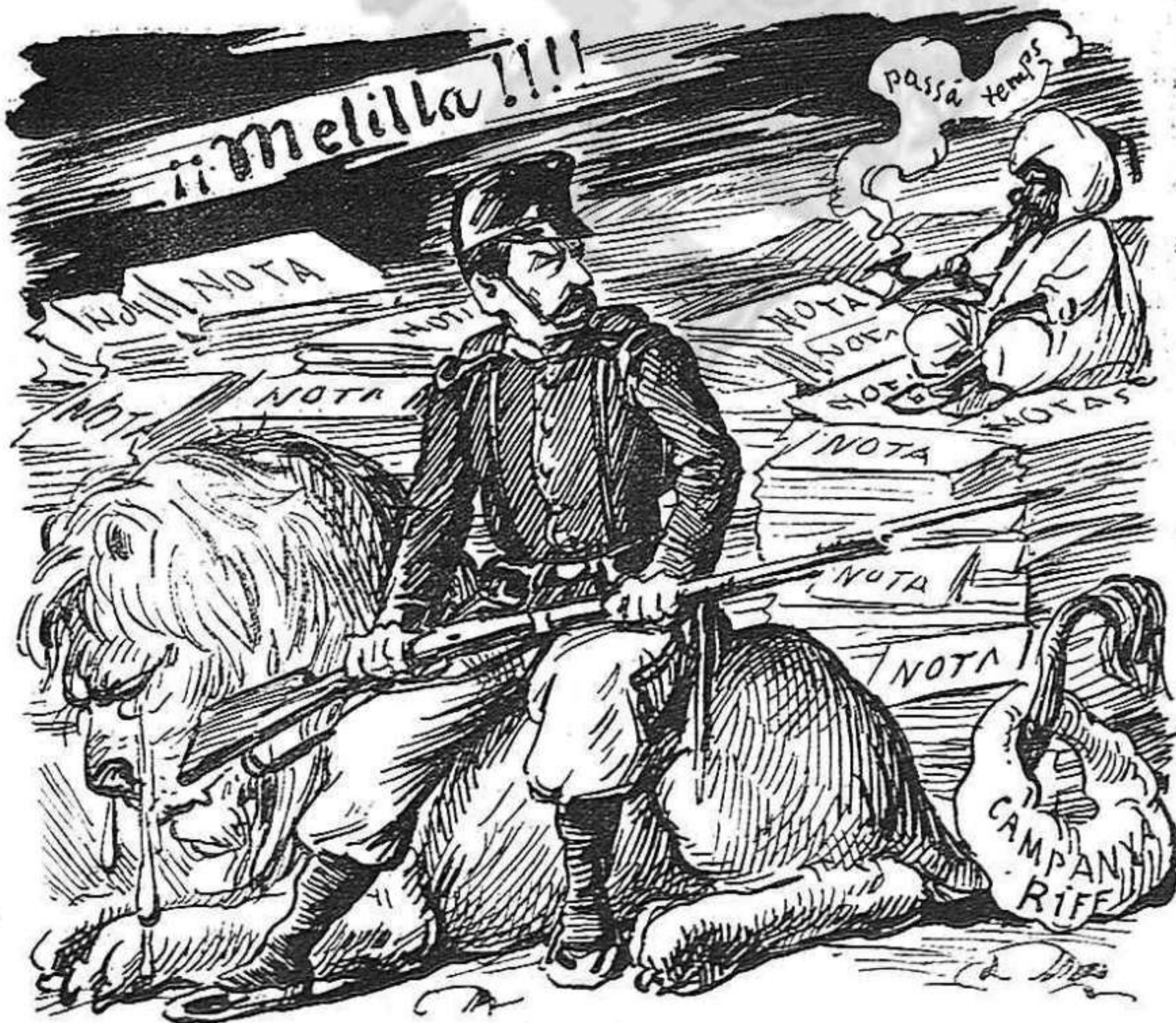
Fi d' any ¡Quina vergonya!

Diu un periòdich... Muley Araaf fa dias que no ha pogut celebrar cap entrevista ab en Martinez Campos, a conseqüencia d' estar malalt de reuma. ¡Malas enguanyadas fregas! Lo diumenje últim, vigilia de Nadal, va celebrarse a Melilla una nova missa de campanya, ab assistencia de totas las forsas allí concentradas. Aquesta afició a las ceremonias religiosas donan lloch a demanar que s' estableixi un bisbat a Melilla, y que s' otorgui la mitra al general Martinez Campos. Se l' ha ben guanyada.