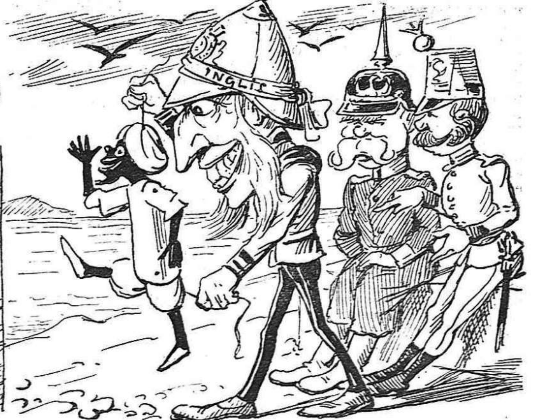
Tants preparatius guerreros tants esforços, tants diners, y al últim per ser la cosa juguina dels estrangers.