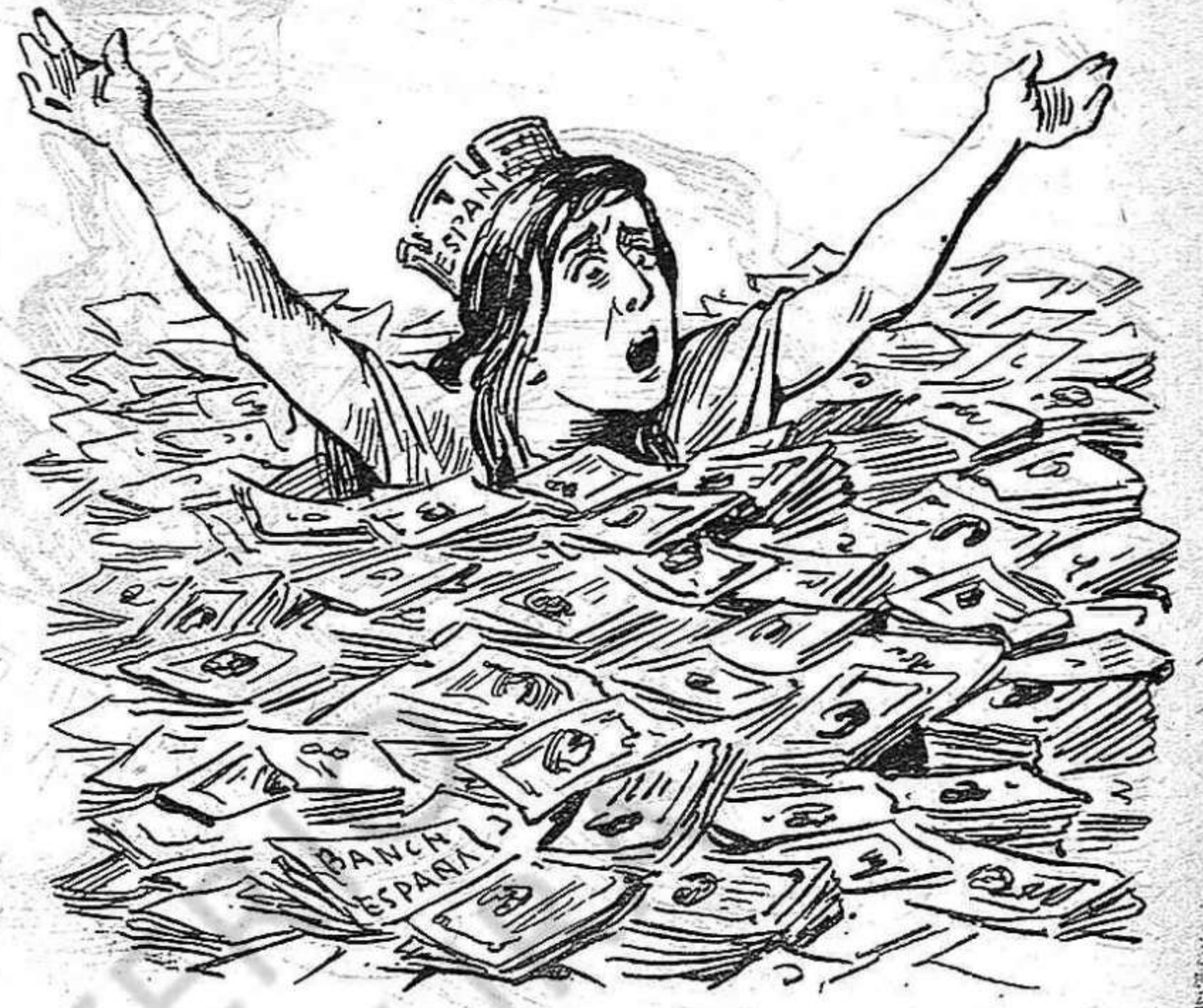
Los impuestos la mossegan y 'ls bitllets de Banch la ofegan