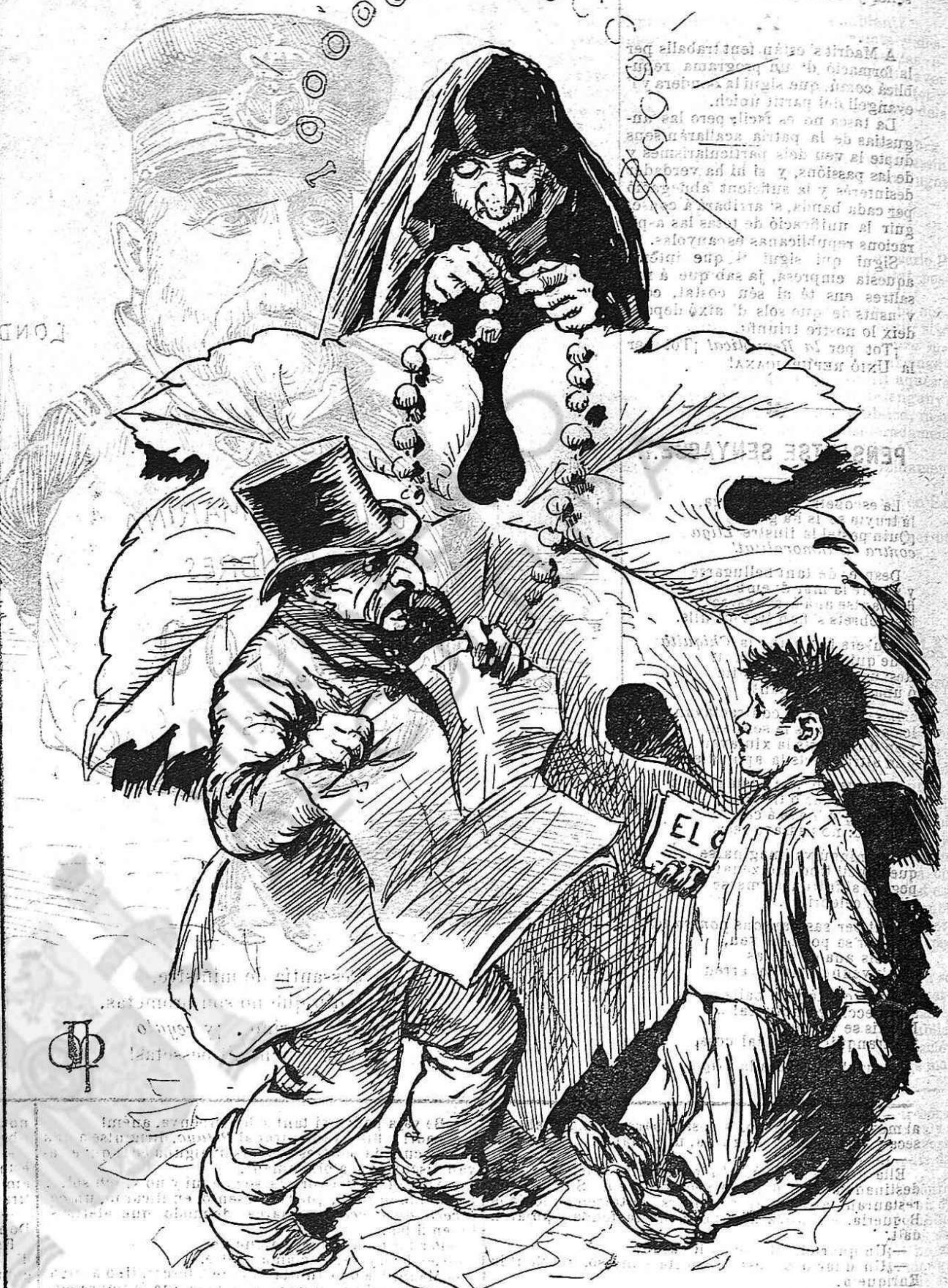
Lo que 's veu...