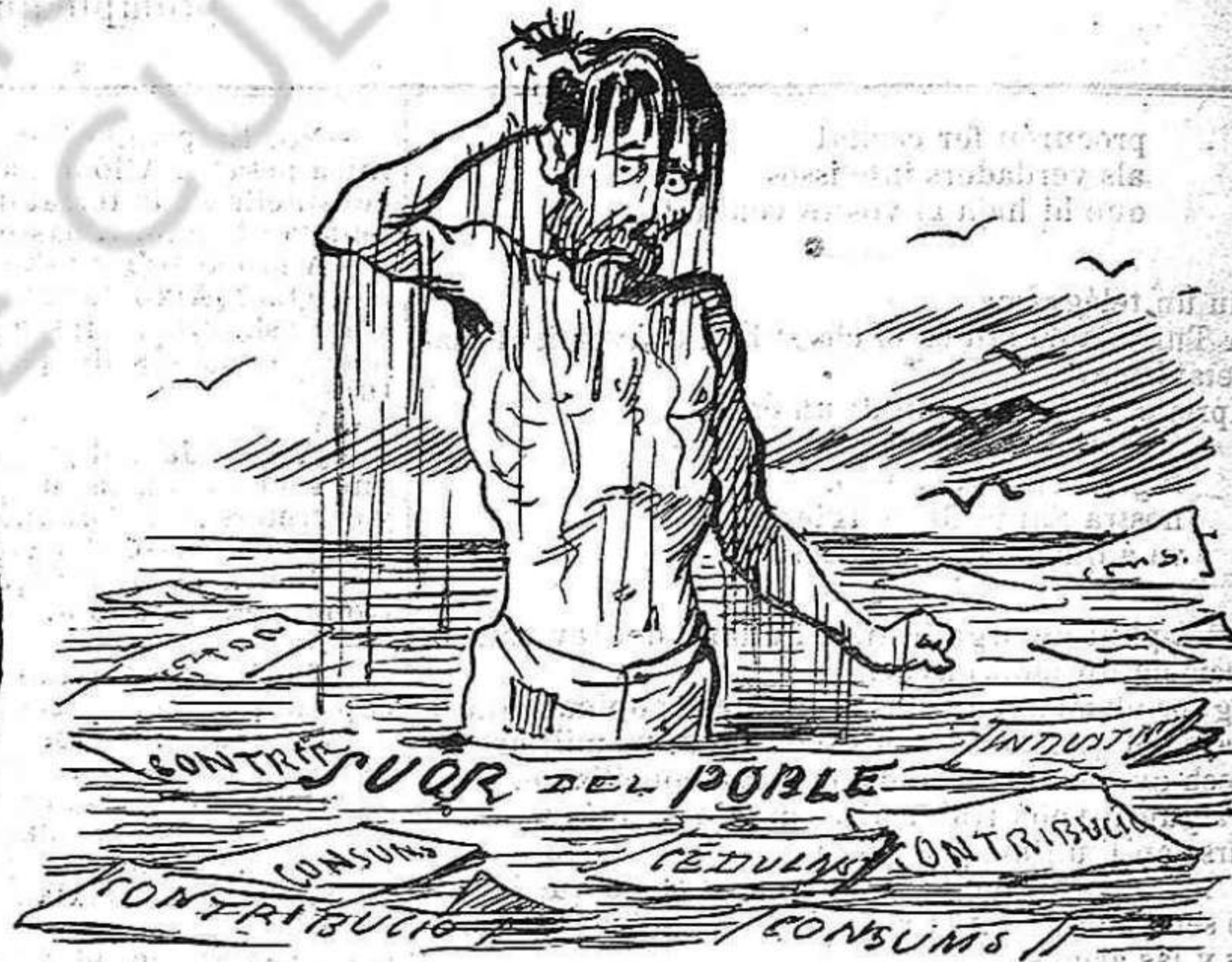
Lo poble treballador jab que 's banya?... Ab la suor.