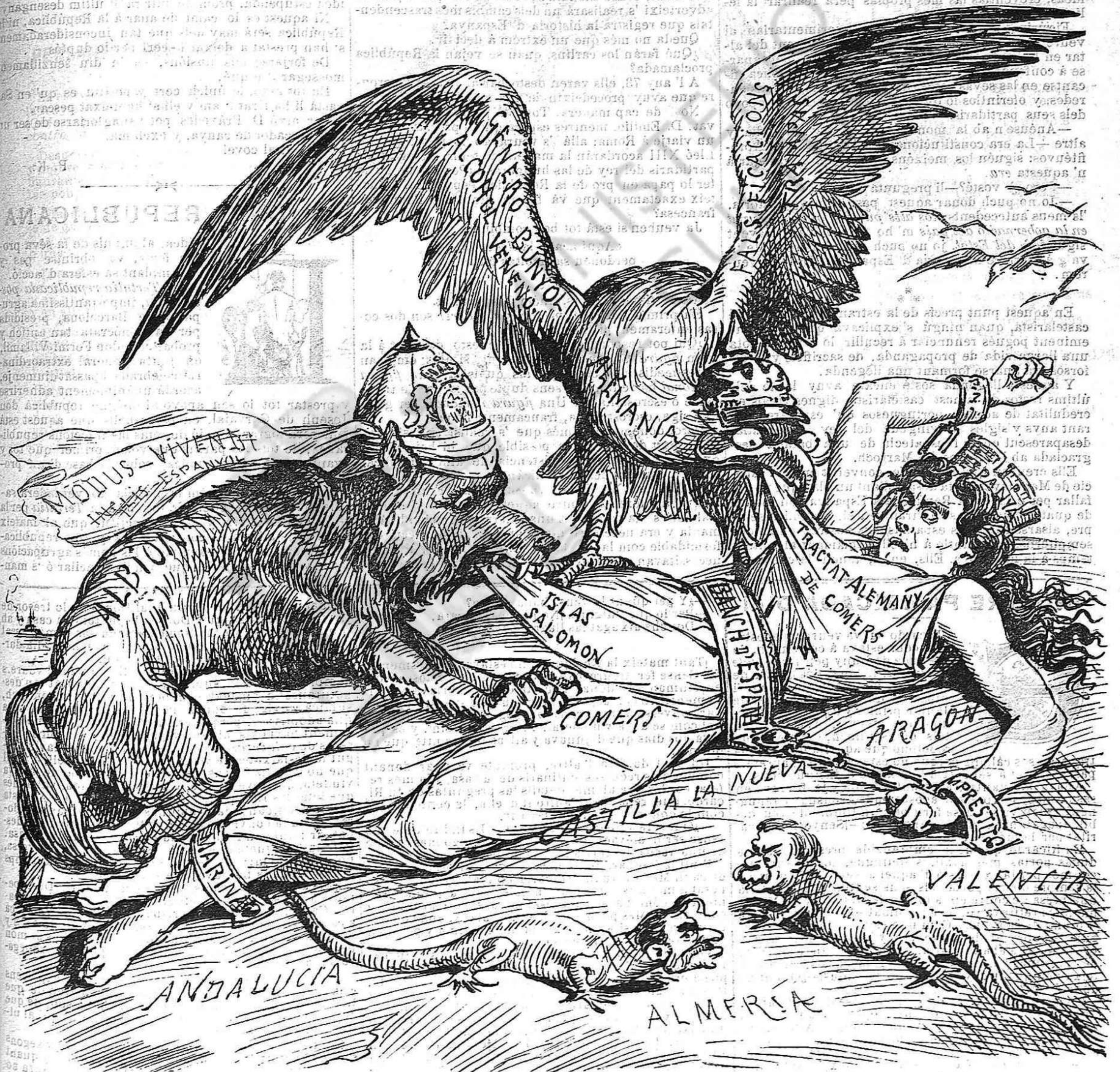
Lo govern va fent tractats, pero del modo que ho toca va á deixar la pobra Espanya sense tripa y sense moca.