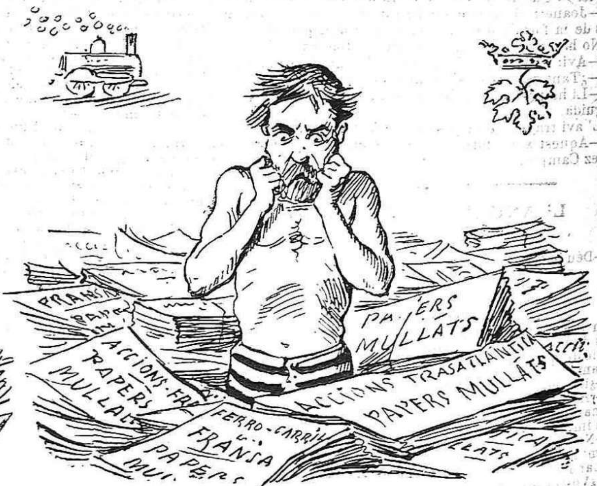
Miré la banyera trista del desgraciat accionista.