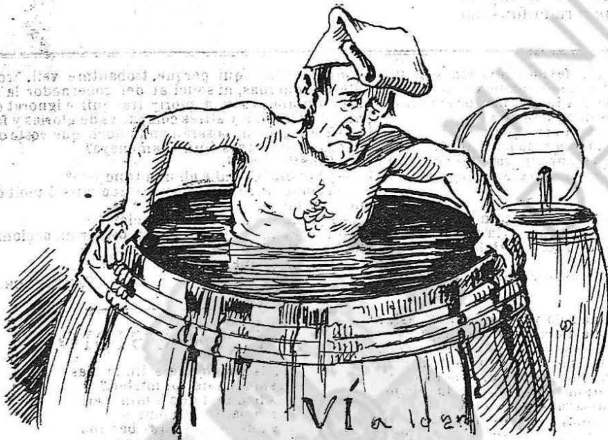
Com 'l vi no 's ven fa anys, sols serveix per pendre banys.