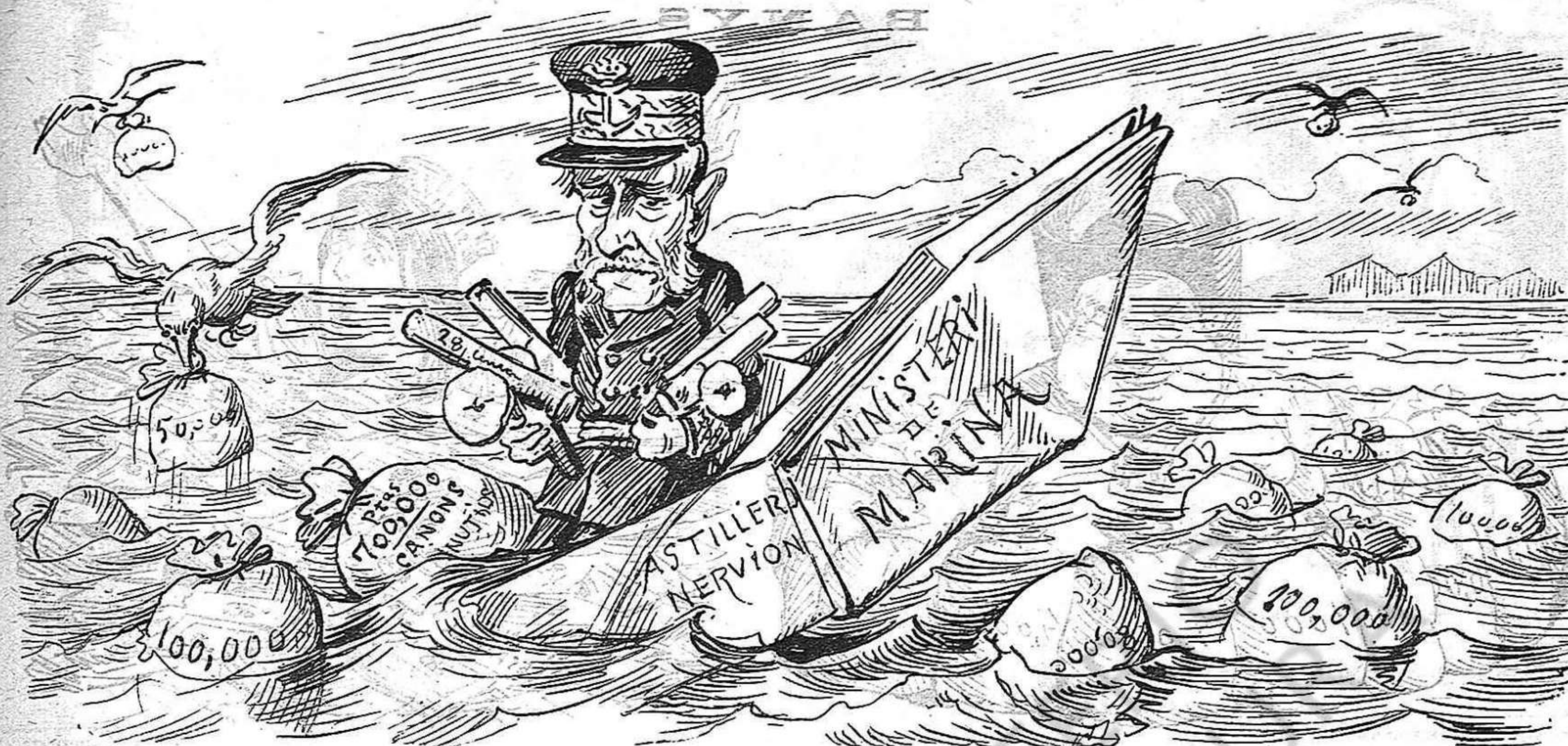
Víctima dels Berangérs, Cerveras y altra llopada, la grrran marina espanyola prompte quedarà enfonsada.

procuréu fer caritat als verdaders infelissos que hi haja al vostre vehinat.