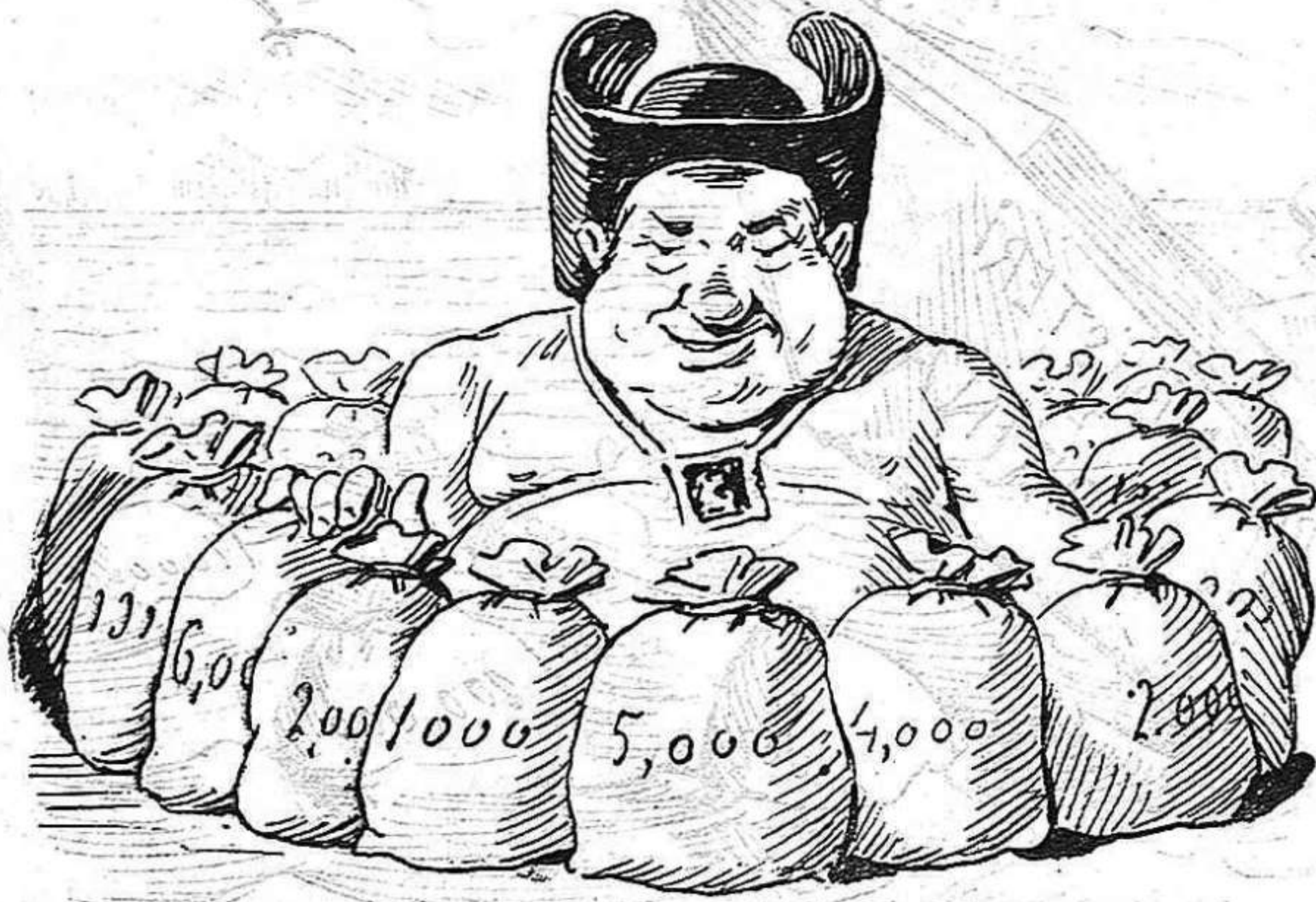
Aquests no passen cap ansia... com nedan en l'abundancia!...