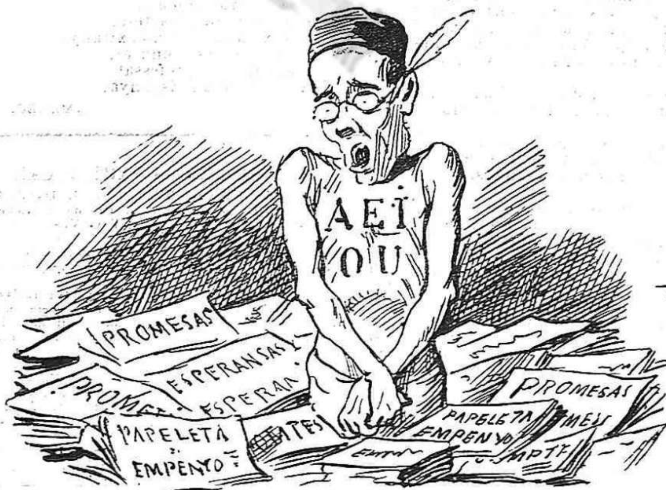
En moltes parts la ensenyansa pren banys de poca pitansa.