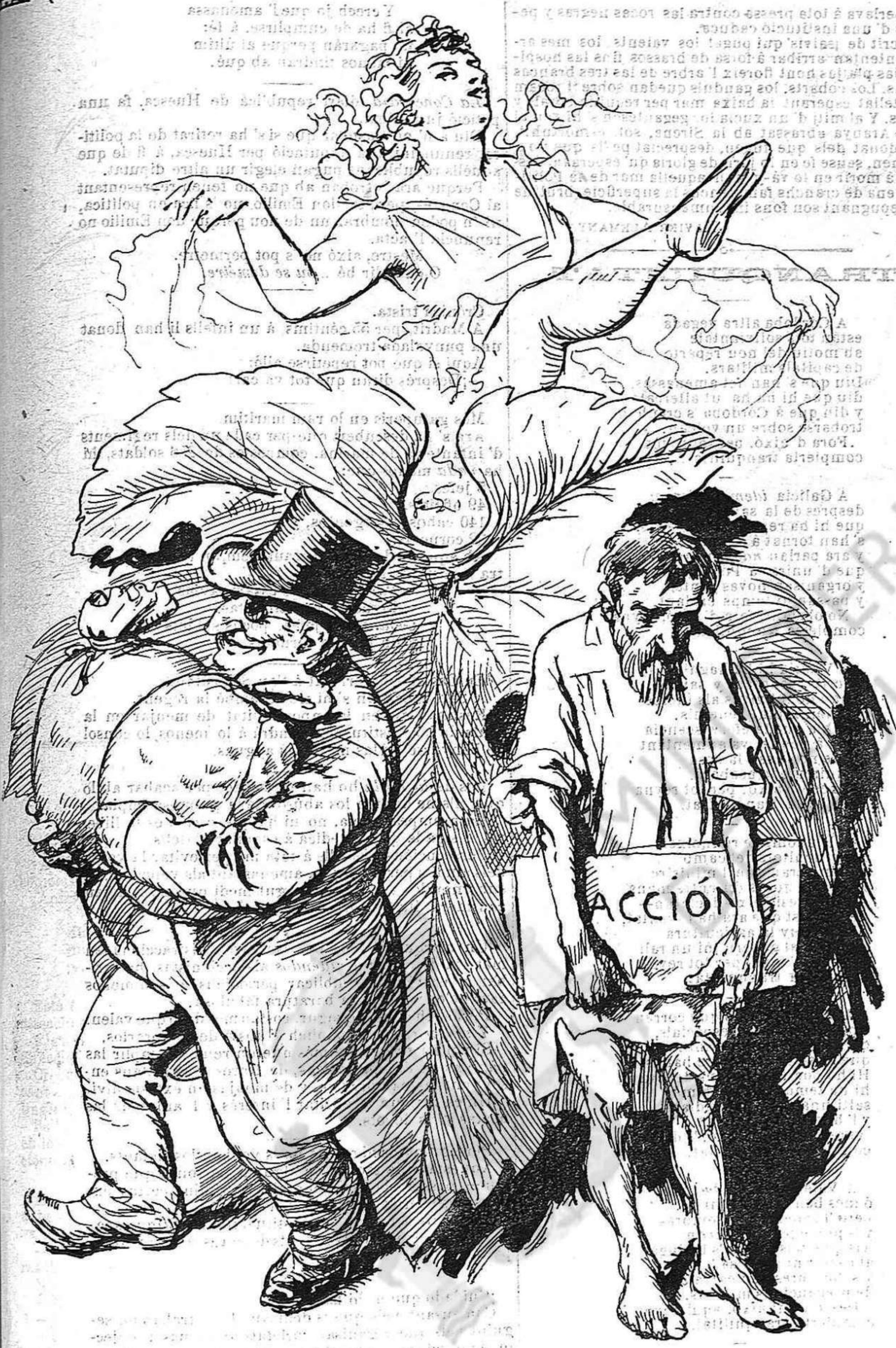
...y lo que no 's veu

—Si me 'n haig d' anar, serà emportantmen algú del bras.