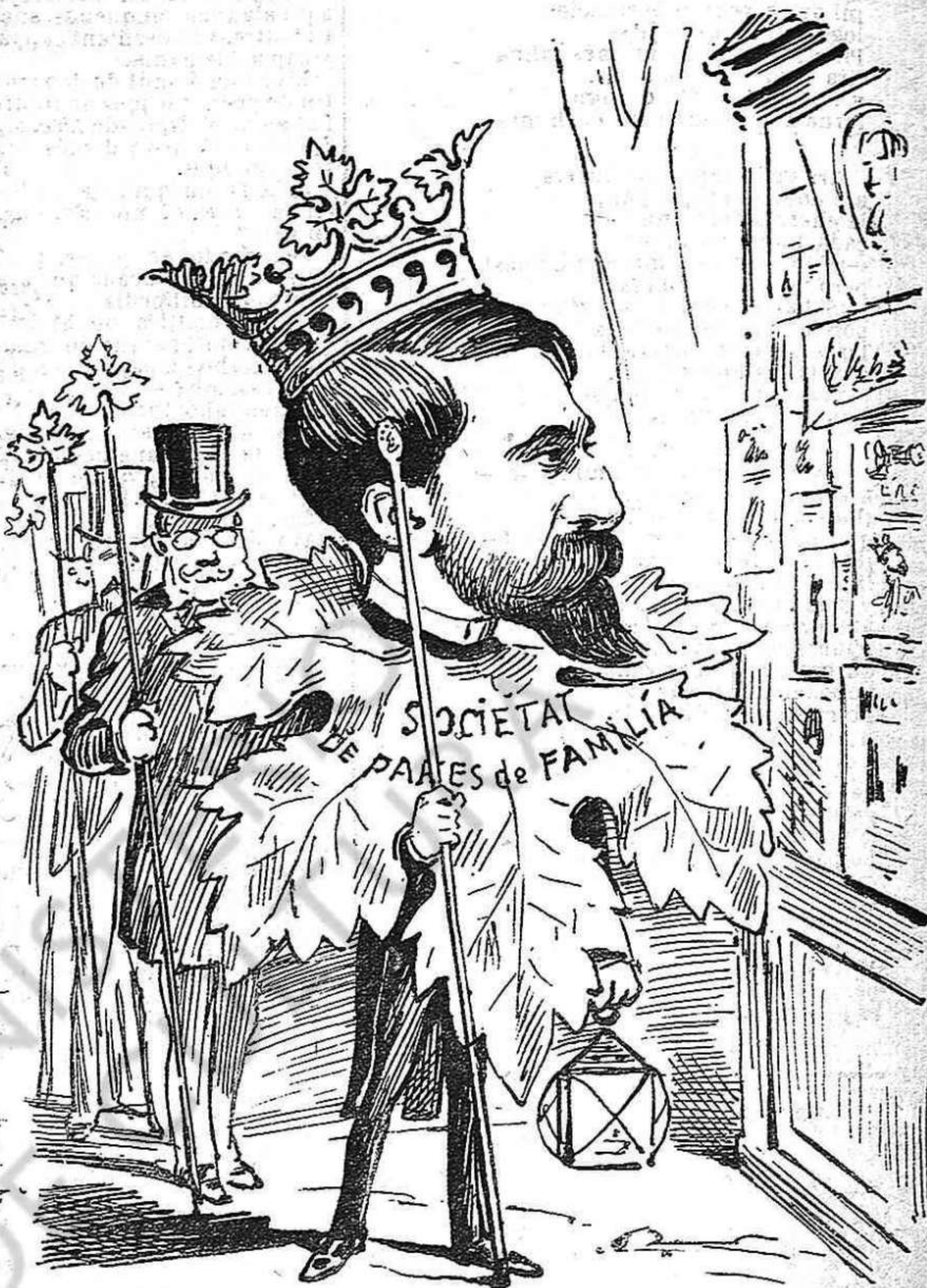
RONDA DE INSPECCIÓ DE LA FULLA Los manaments de La Fulla s'enclouhen en dos: vestir al art que vá despullat, y despullar al accionista que vá vestit.