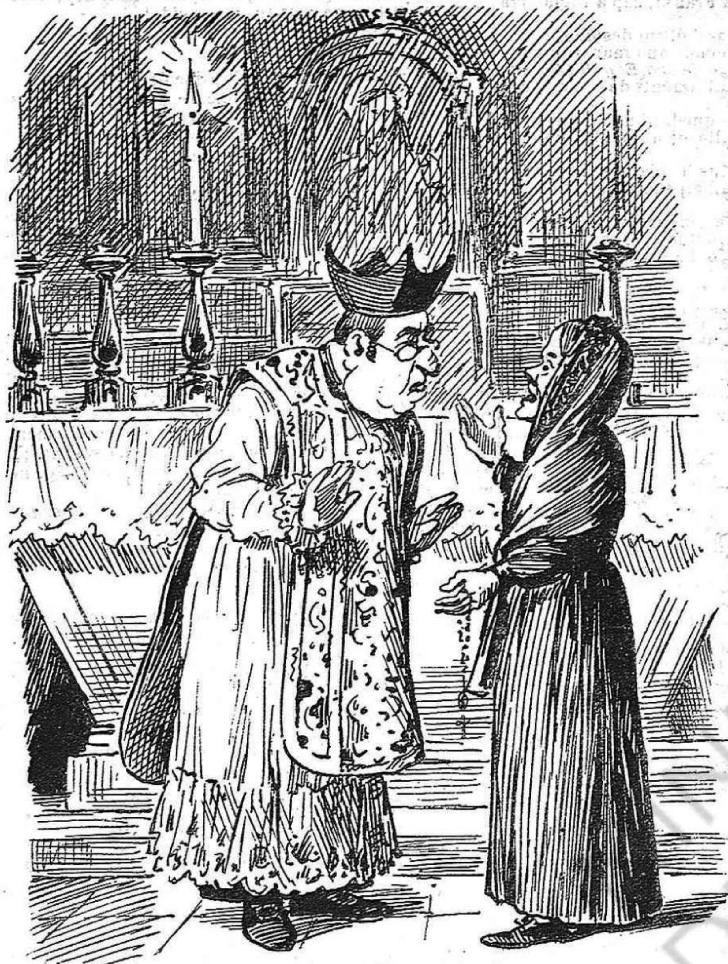
LA REBAIXA EN LO PRESSUPOST DEL CULTO —Ay, ay: ab un ciri no més han dit la missa? —Sí, filla: no hi ha més cera que la que crema.