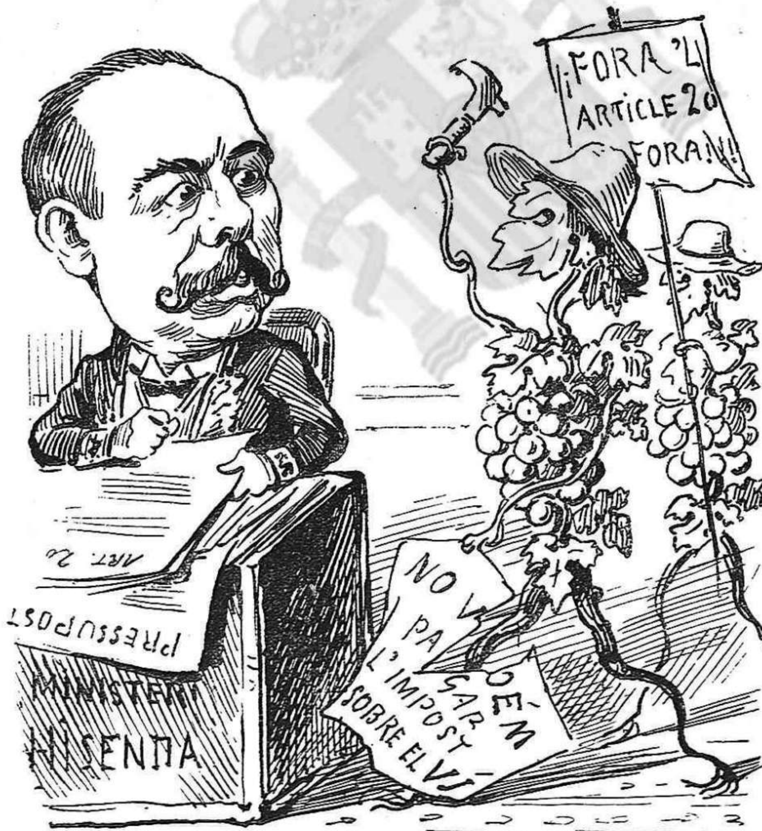
LA QÜESTIÓ DEL VÍ ¡Ay pobre Sr. Gamazo, en mal tráfech s' ha ficat! Me sembla que si 's descuyda lo vi li pujará al cap!