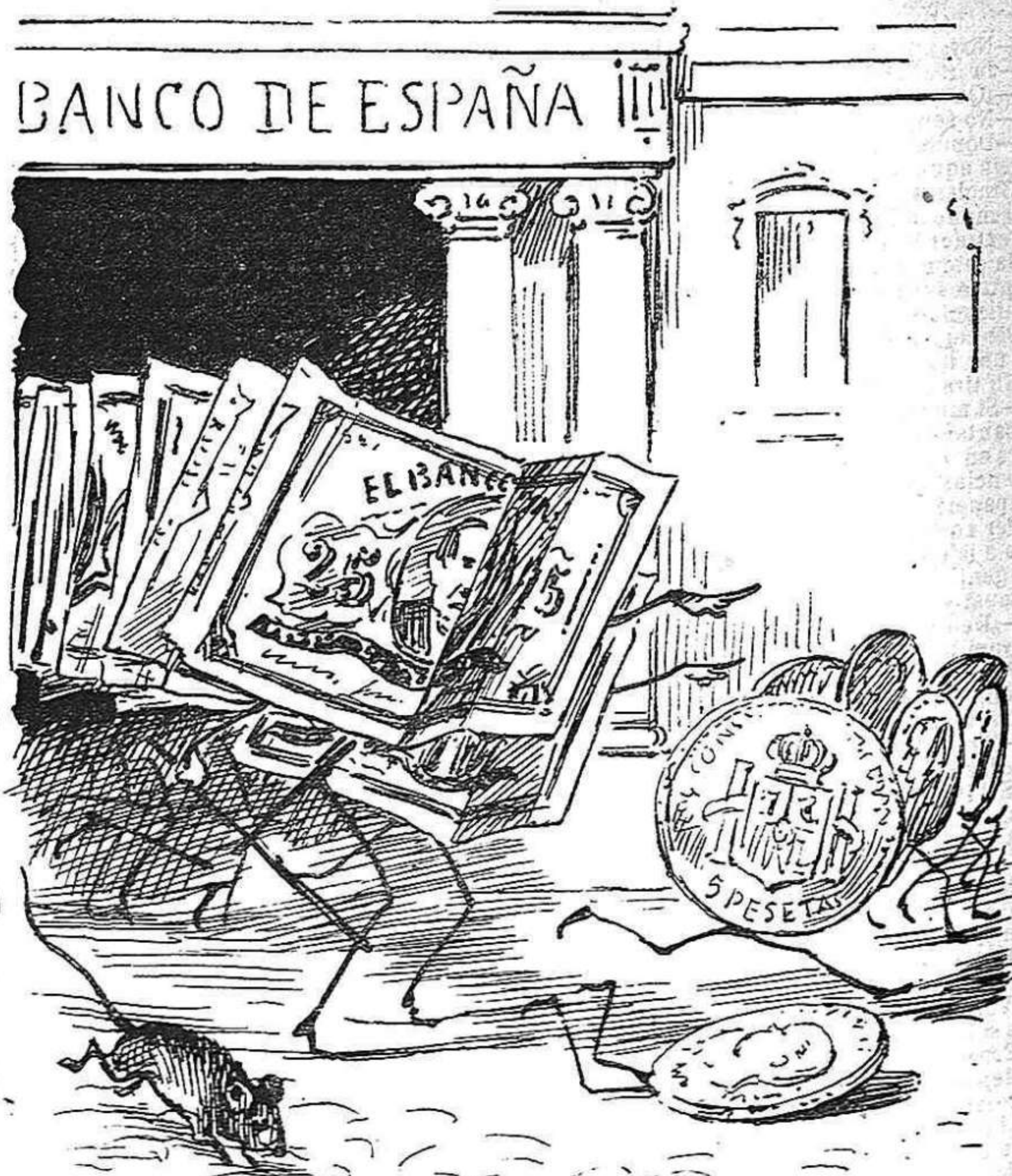
LA QÜESTIÓ MONETARIA Ja fá temps que l' or es fora y 'ls apuros van creixent: la plata val poca cosa, y 'ls bitllets no valdrán res.