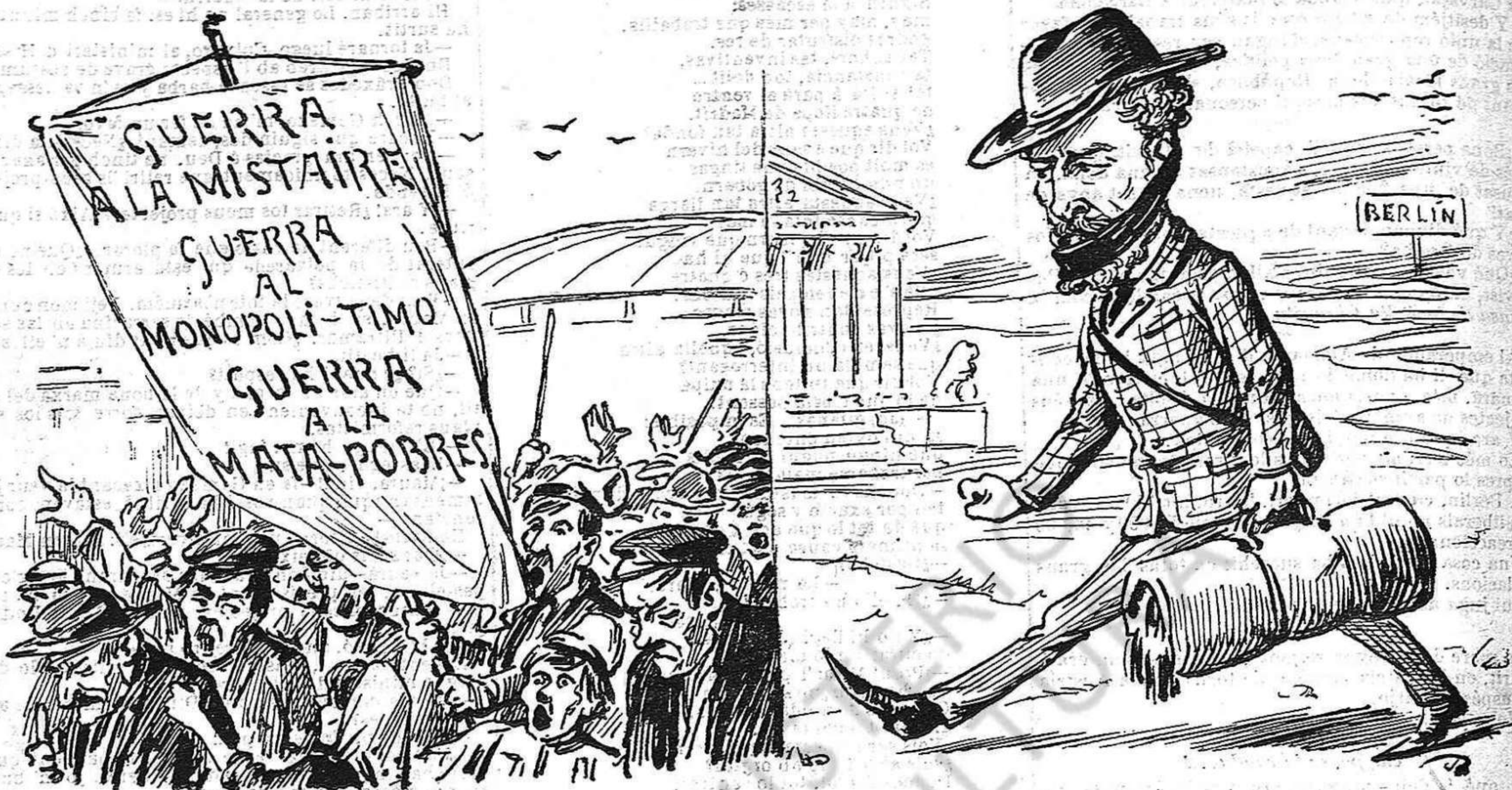
LO MEETING DELS MISTAIRES Ningú escolta lo seu clam y s' está morint de fam.