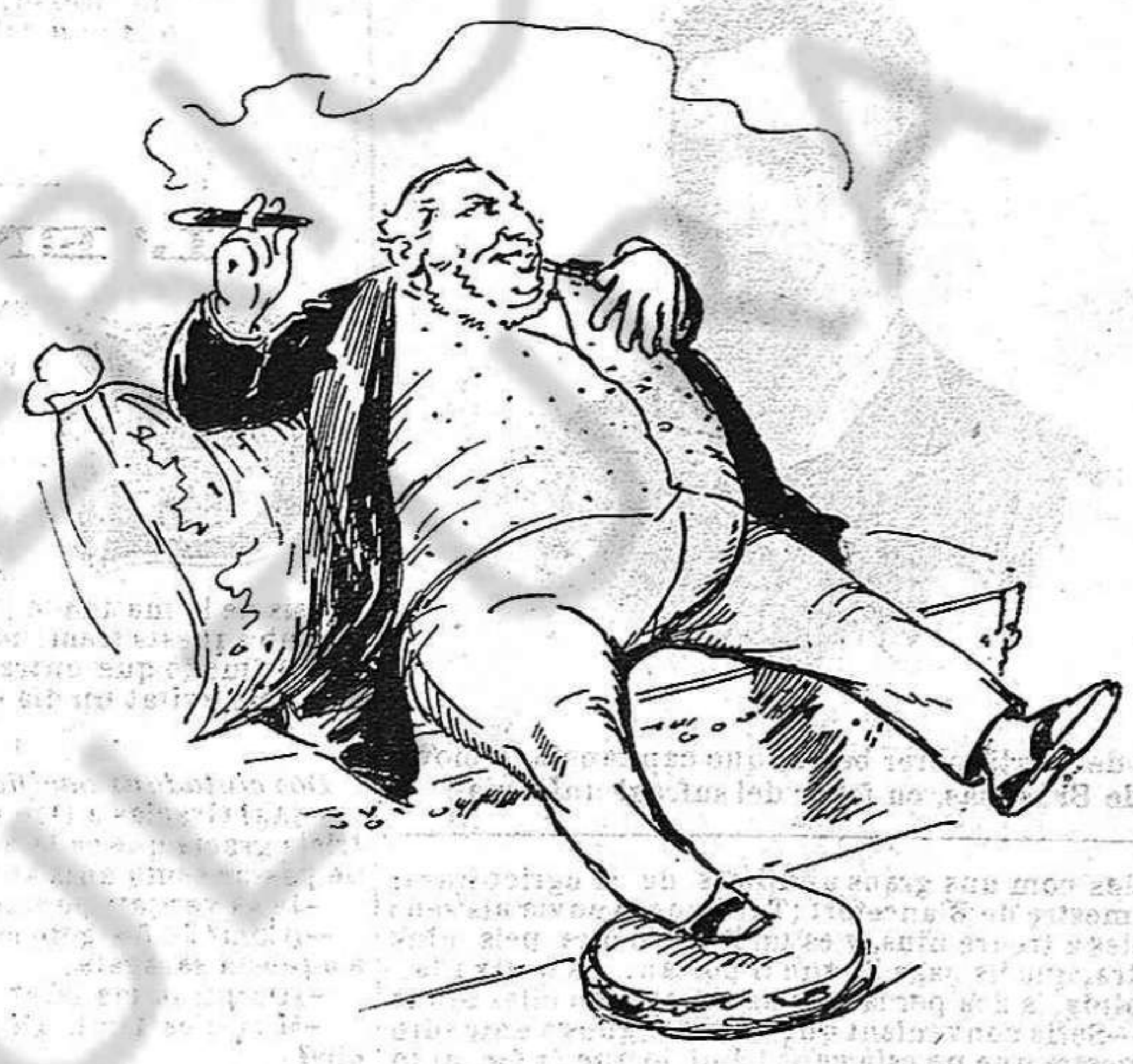
(Apart):—Aixó es, ves treballant... y las vuyt horas te las pintaras.