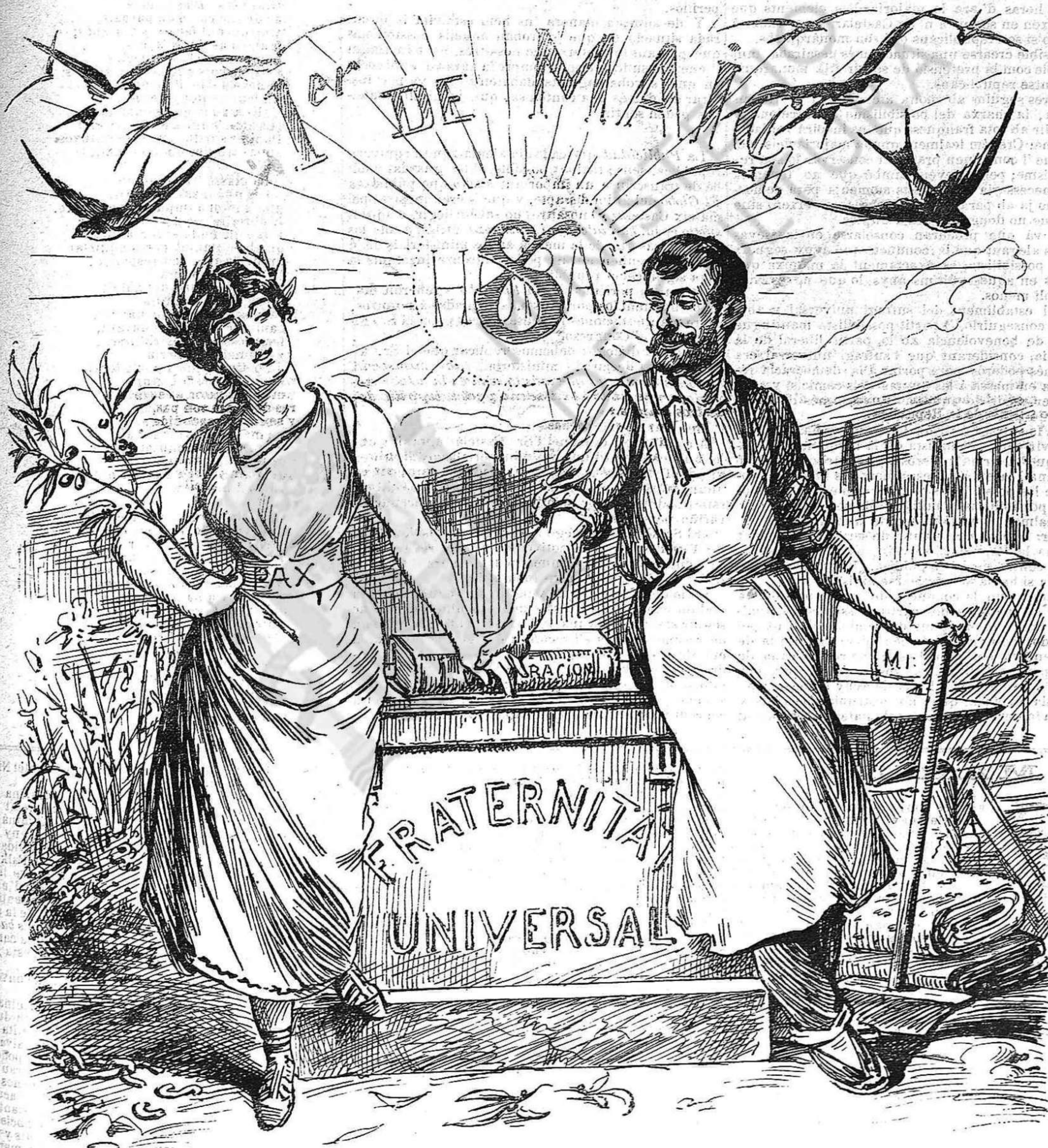
La constancia es la garantía del triunfo de todas las ideas bonas