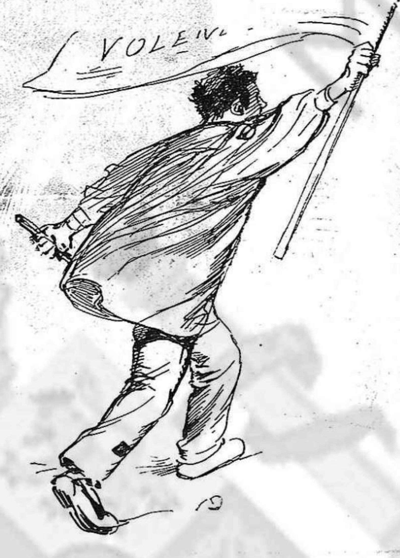
¡Vull las vuyt horas! ¡Qué tants romansos!...