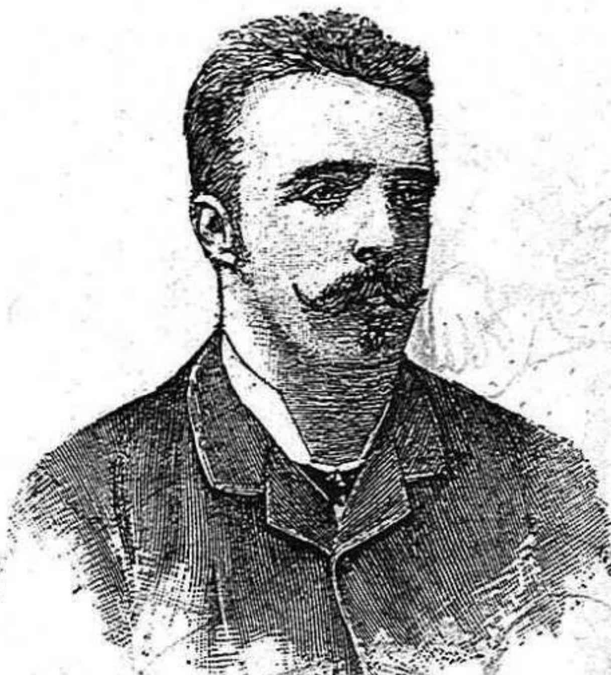
Jefe del partit obrer belga, que capitaneja l' moviment de Brusselas, en favor del sufragi universal.

derantlos com uns grans auxiliars de la agricultura; pero l' mestre de Blancafort (Tarragona) envia als seus deixebles a treure nius, y es tal l' afició que pels nius demostra, que 'ls paga 'ls que li portan. La quitxalla, enllepolida, 's fica per las terras causant en ellas grans danys.—Seria convenient que algu dongués a entendre al tal mestre que no está gens bé ni lo que fá fer, ni lo que fá.