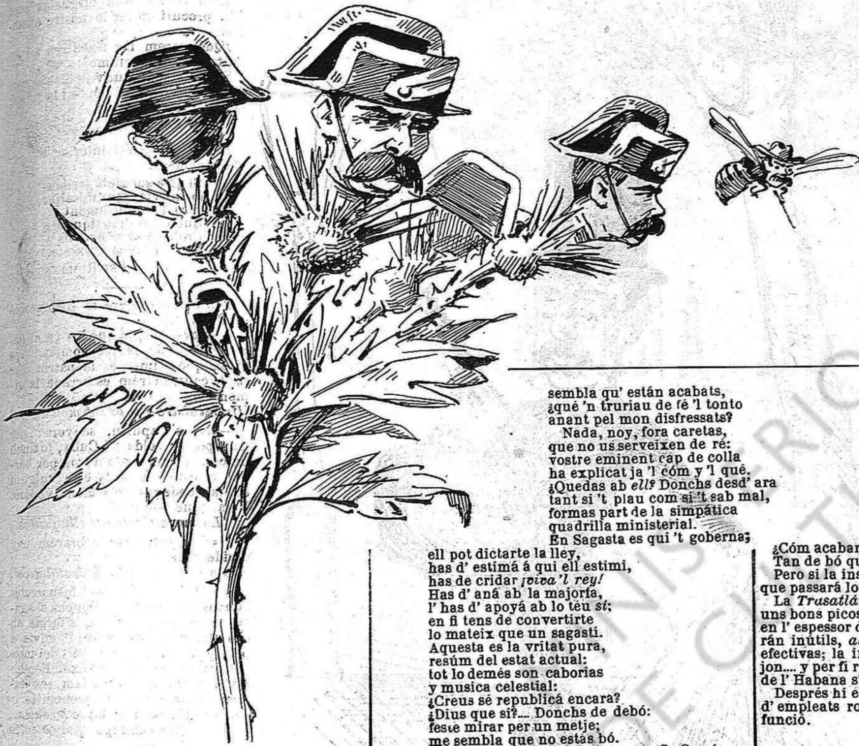
Flors del primer de Maig

haja vuydat, llavors quedarán complerts los tres 888 en la nostra bandera.