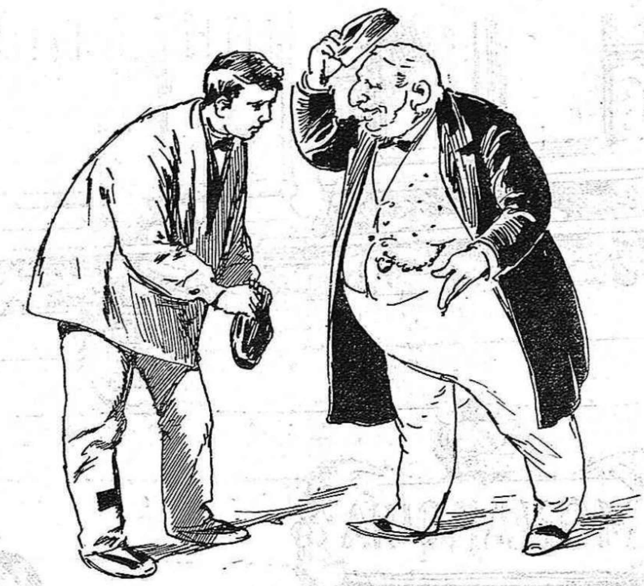
Un obrer:—Un servidor desitjaria, si no fos molestar, que se 'm concedissin las vuyt horas.