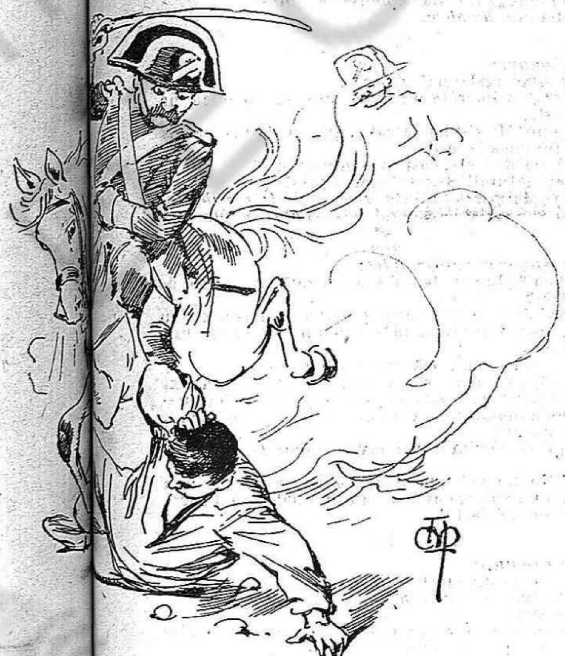
Lo Capital:—En Vull va morir de un cop de sabre.