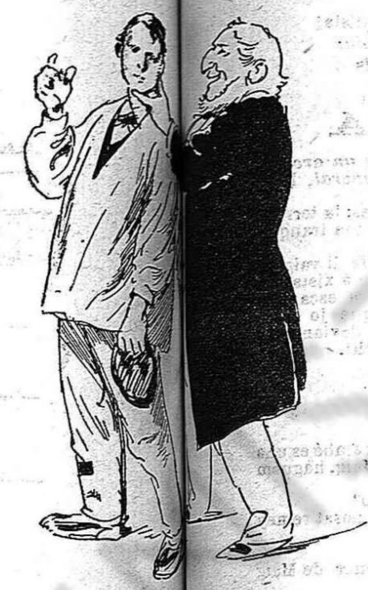
El Capital:—Be, m'interessa estudiaré y tot s'arreglará... Pero per ara ves treballant.