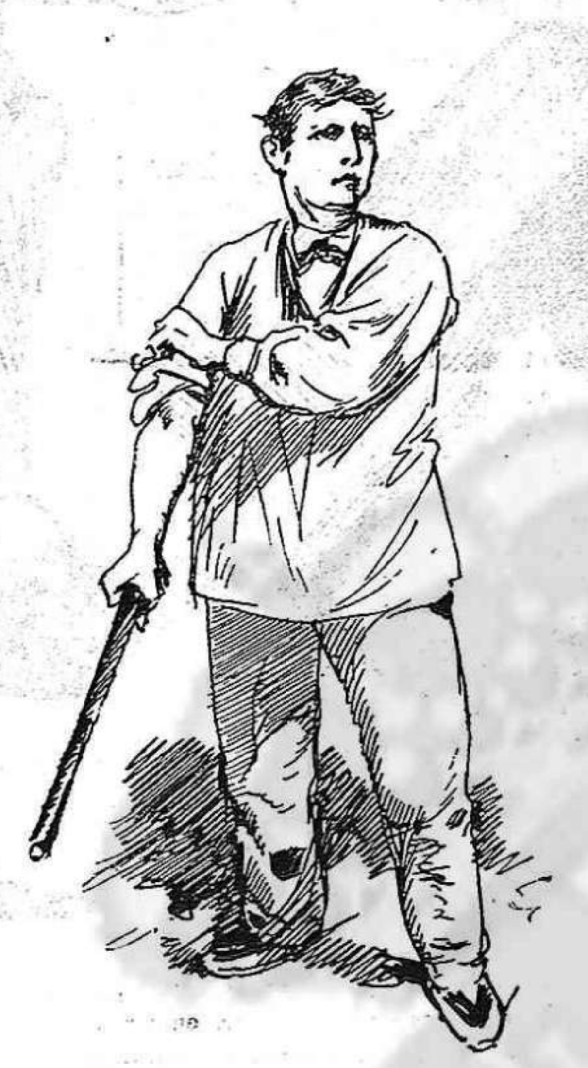
L' obrer:—Ja que á las bonas no 'n trech res, tractarem á las malas.