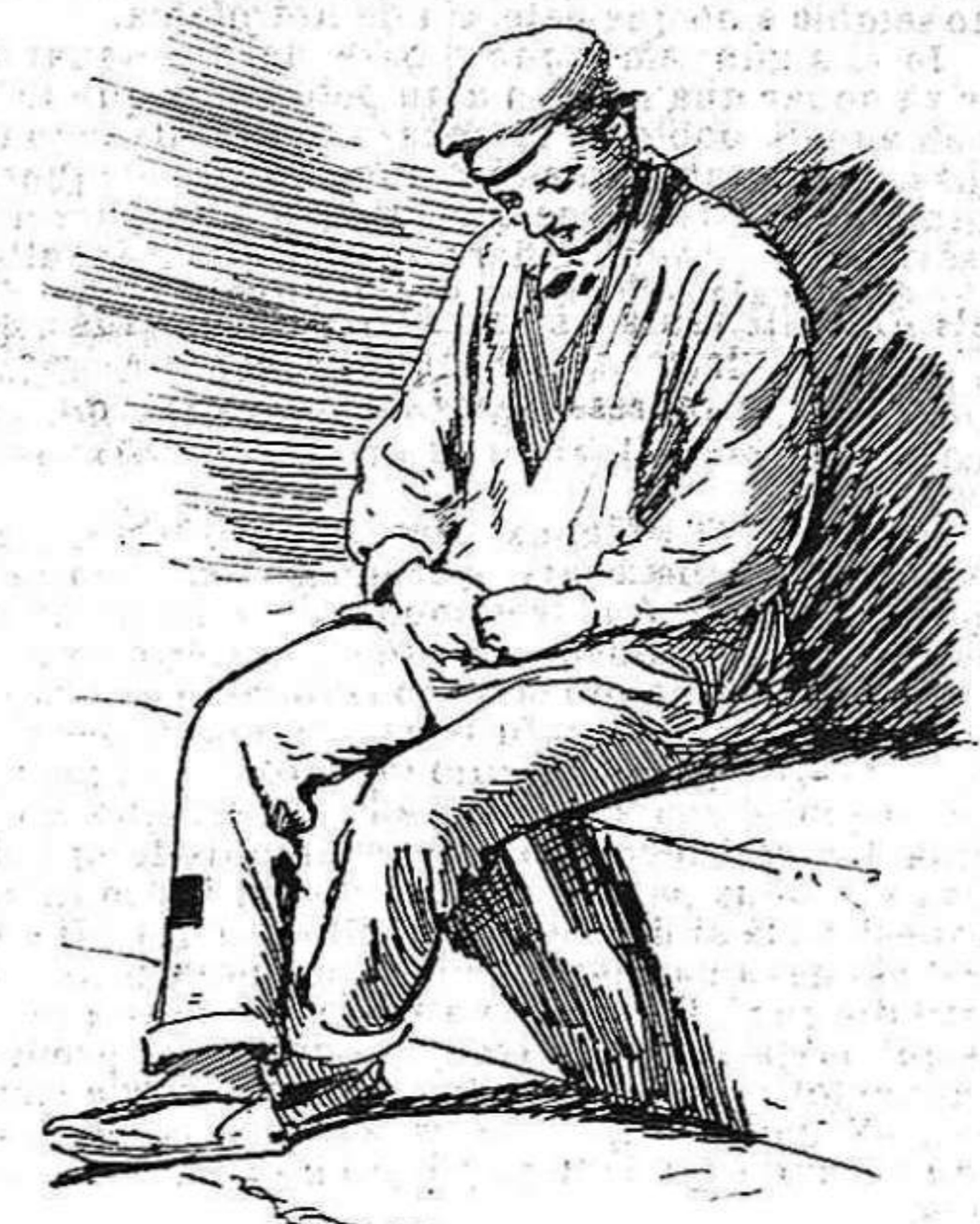
L' obrer:—¿Y donchs, cóm redimoni s' han de demanar las cosas?

Ja sé jo que moltras prosperitats individuals se forman ó á lo menos aparentan formarse á expensas de la prosperitat colectiva; ja sé jo que aquest desitj innat en l'home de que tots siguem iguals, no ja en lo mateix dret que tenim tots de emplear los medis licits, igualtat legitima, sino també de disfrutar dels mateixos plahers de la vida, igualtat impossible, ja que la naturalesa no ha fet iguals ni las aptituds per conseguirlos, y ni tan siquiera 'ls gustos per paladejar aquells plahers; ja se jo que aquest desitj engendra principalment lo malestar social qu' explotan ab més ó menos profit distintas escolas, més ó menos utópicas, més ó menos dignas de condecoració y estima, més ó menos profitosas á la tranquil·litat moral de las classes treballadoras.