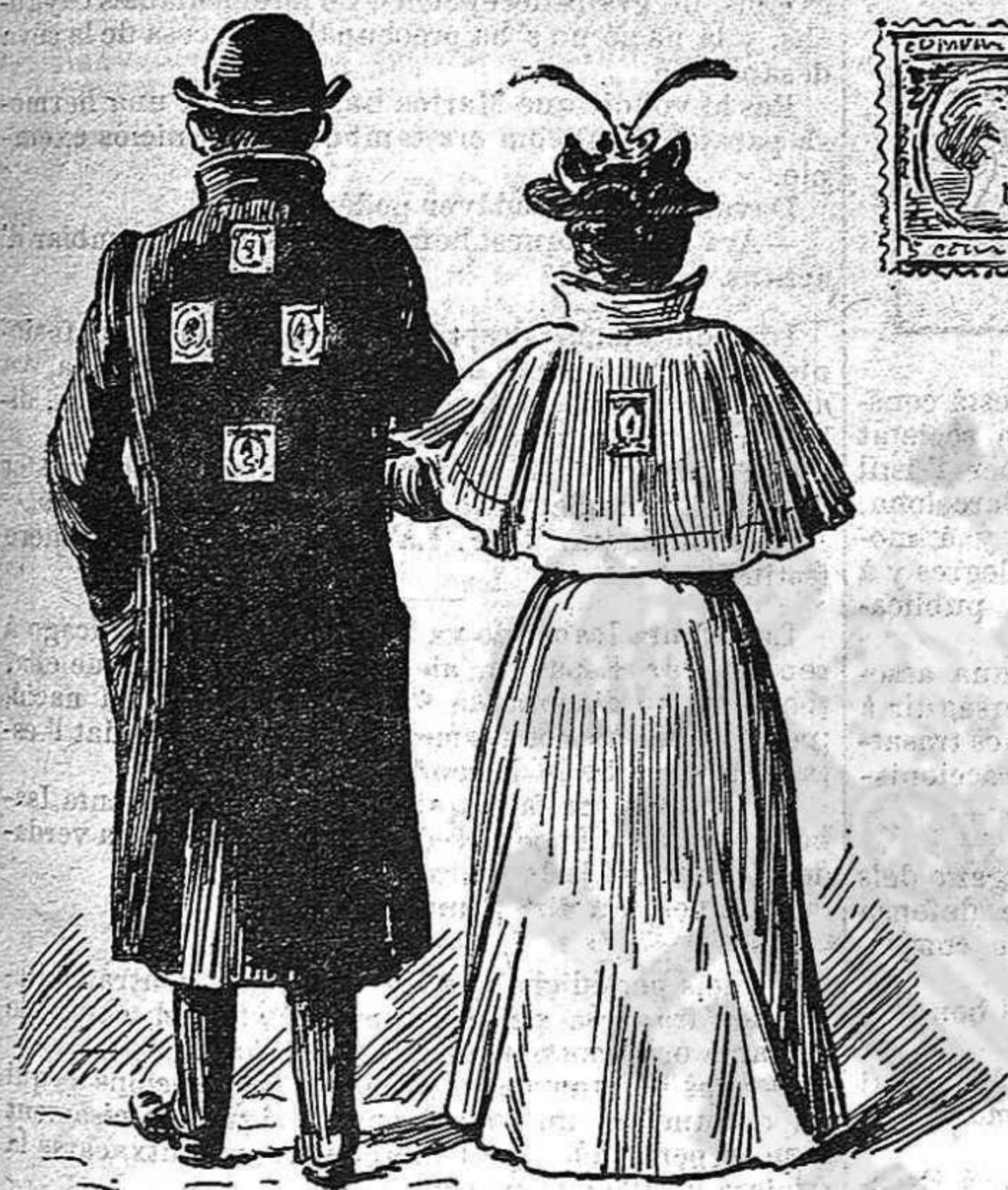
No 's podrà sortir de casa, sense el sello.