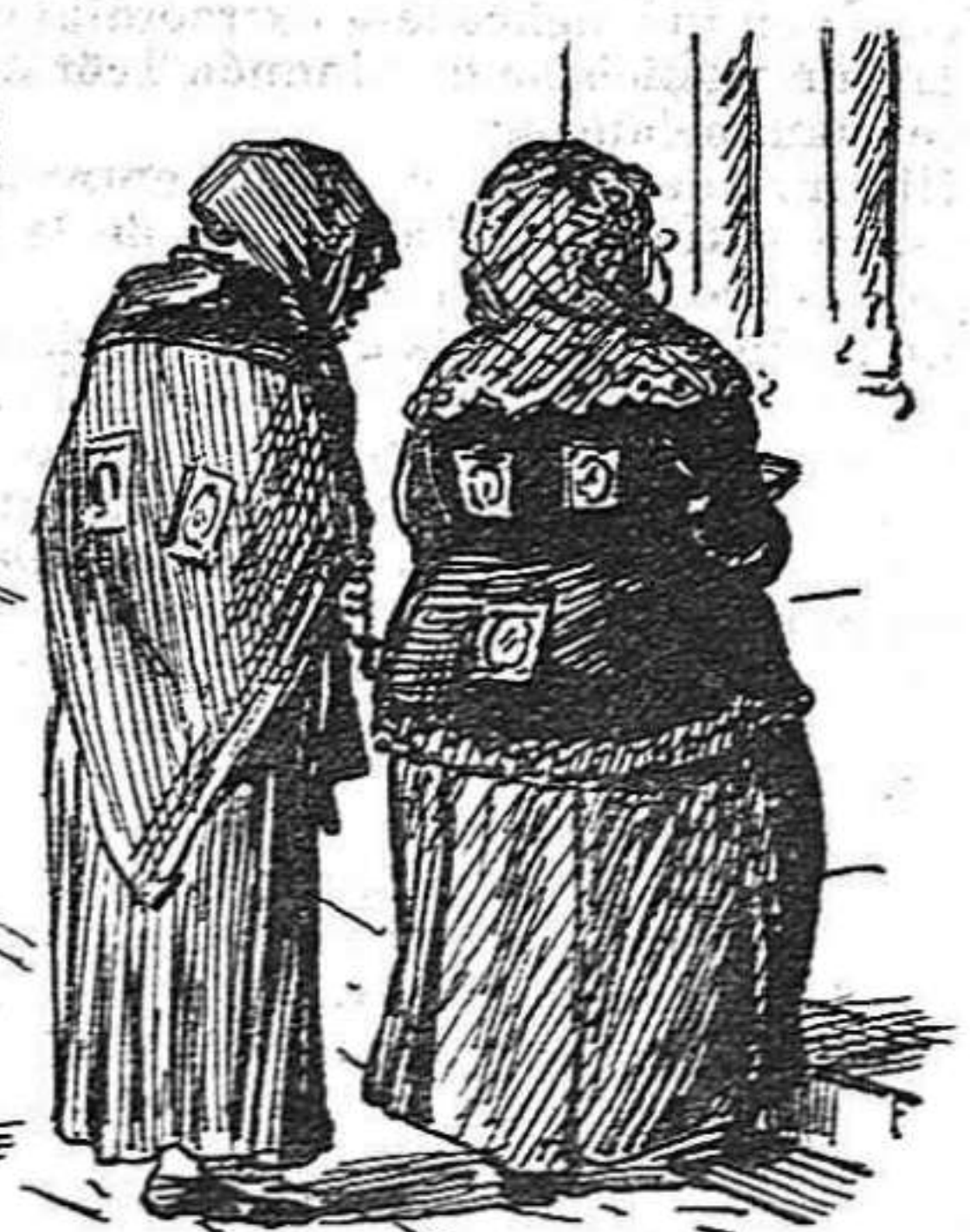
Ni las ratas de sagristia per anà á las Quaranta horas.