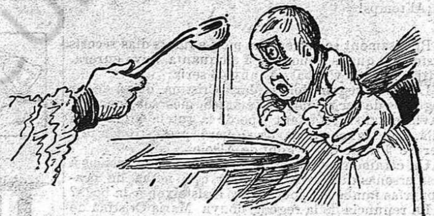
Pels bateigs y pel casaments