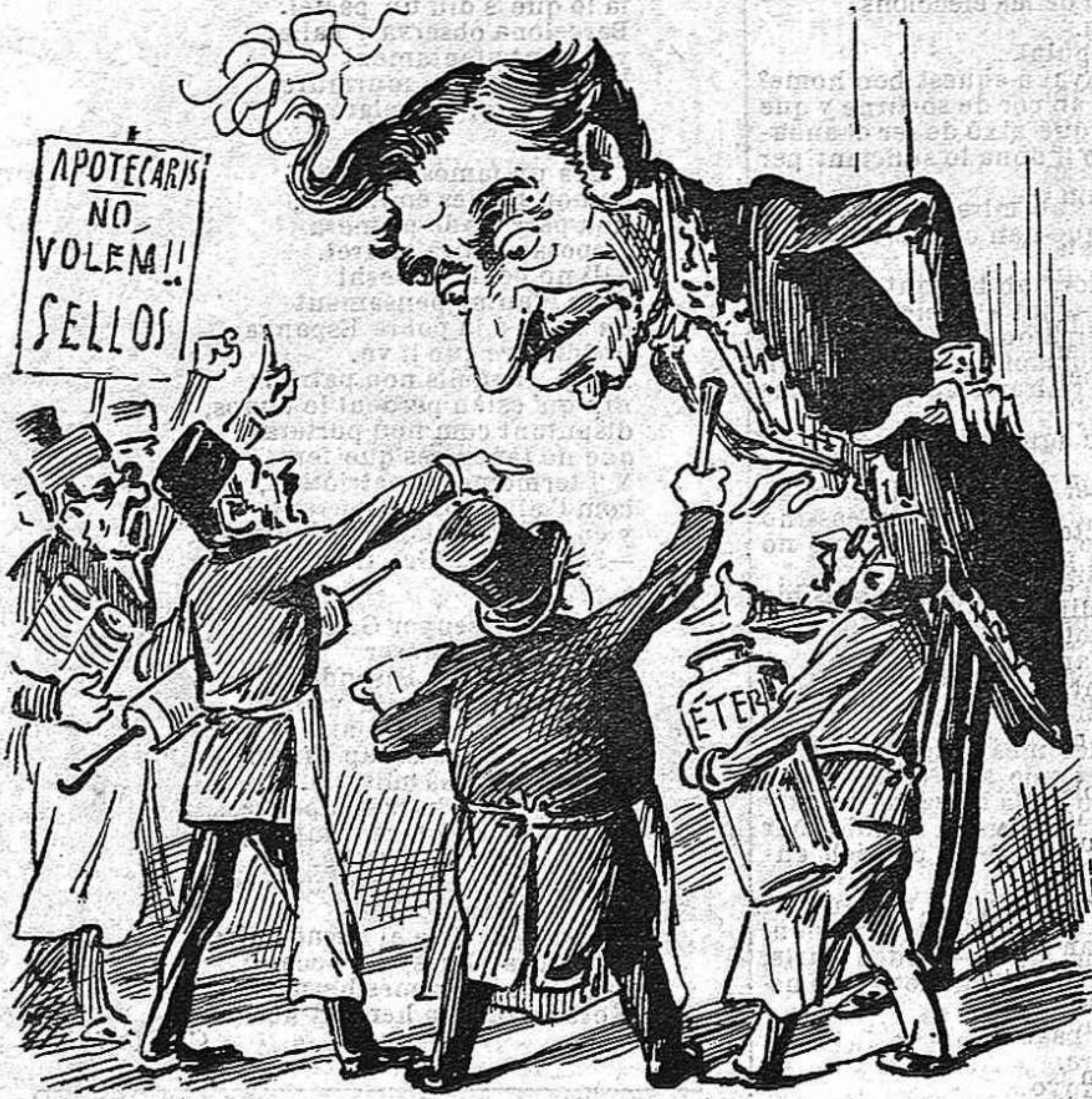
-Sr. Mateu: sábiga qu' estém resolta á tot,.. No volem sellos.