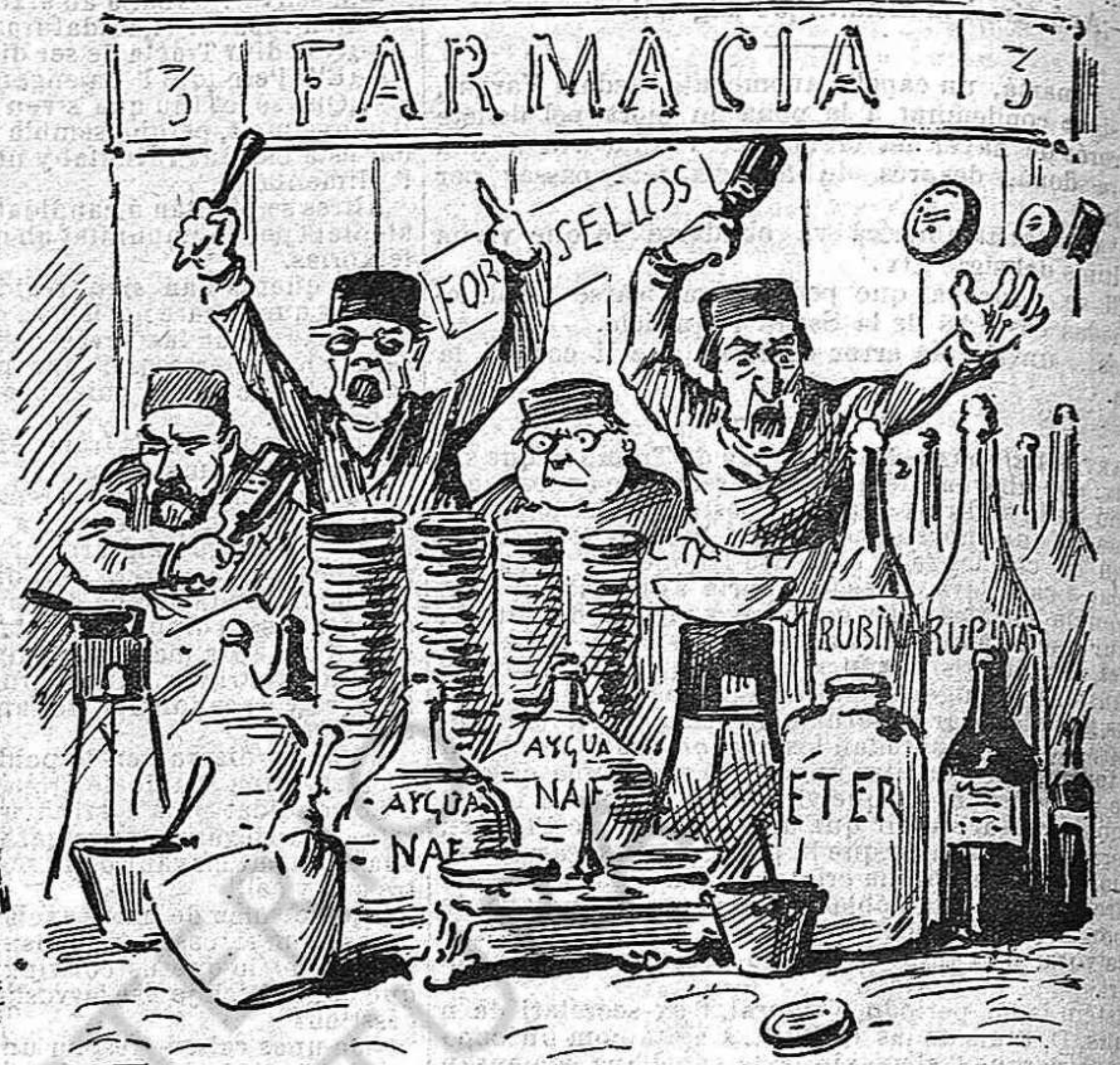
Avants de passar per lo del sello, tot lo gremí s' alsarà com un sol apotecari... y la situació, per malalta qu' estigui, s' quedarà sense remey.

-Los torts son aucells de pas; los Torts y Martorells han de ser per forza arcaldes de pas.