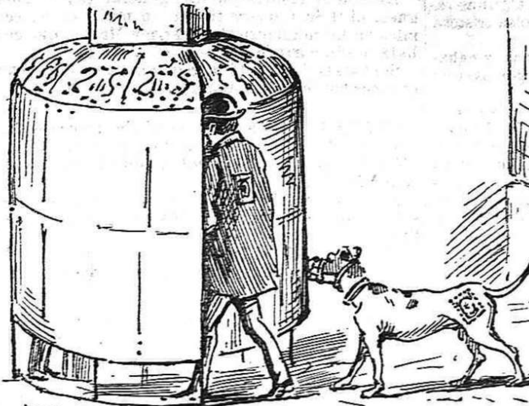
Fins per satisfer certas necessitats será menester lo sello.