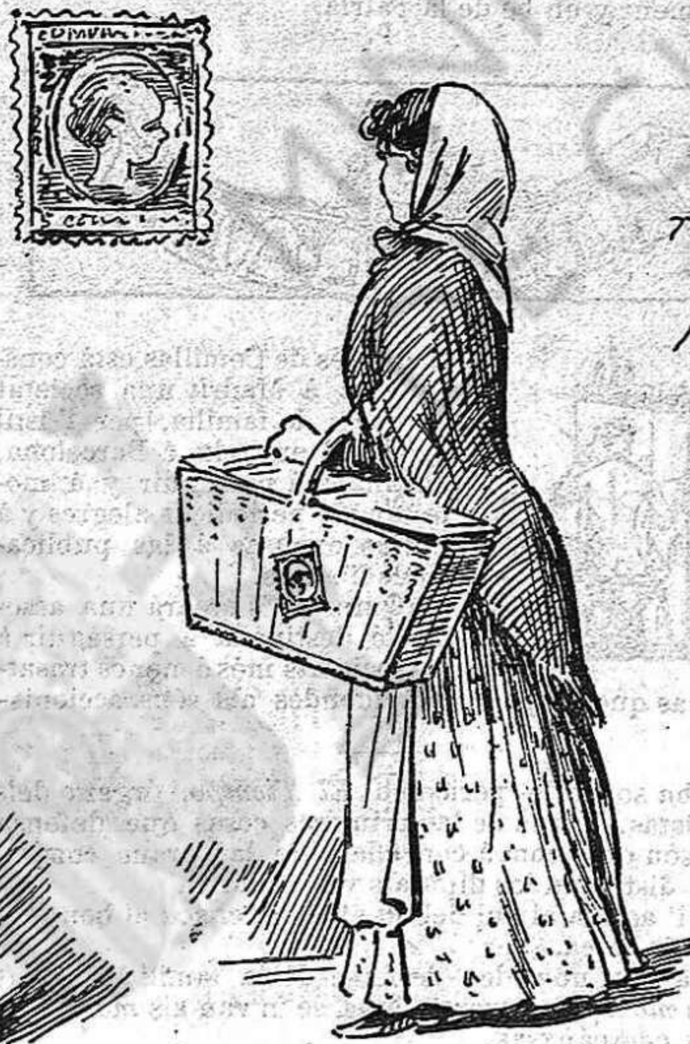
Se necessitarà 'l sello per tot: per anà á la compra.