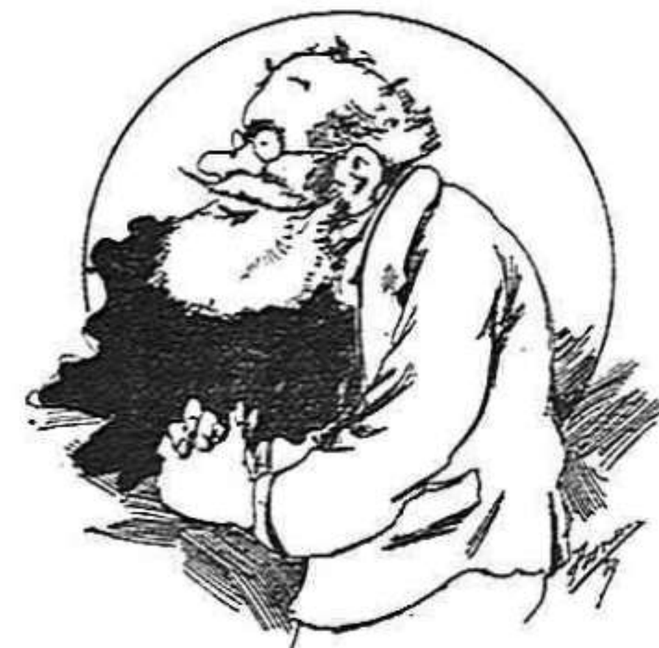
Un interventor conservador que no va arribá á pendre possessió

Al any 50 lo govern treya de la rifa nacional 21 milions de pessetas; en l' últim any n' ha tret 78 milions.