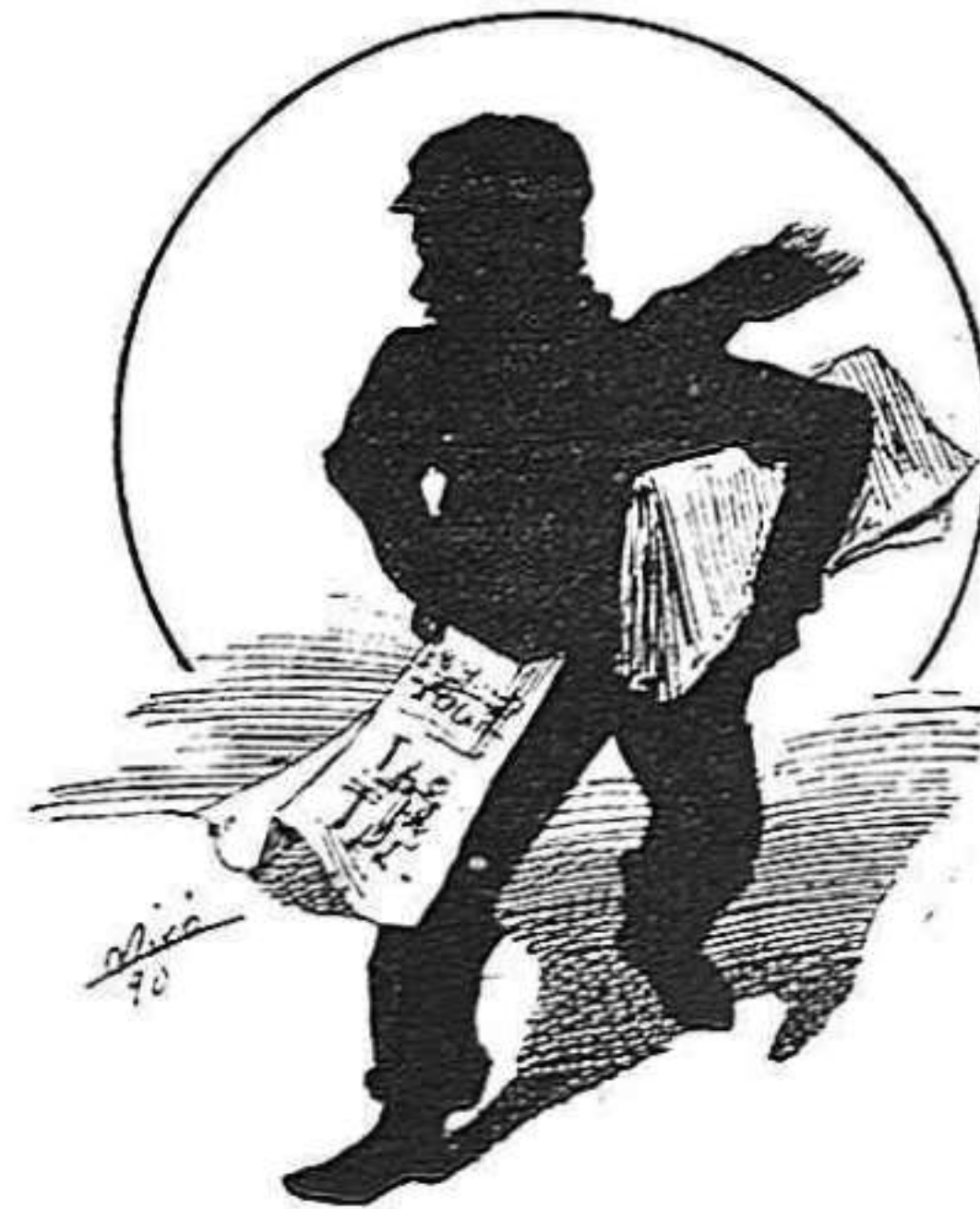
—¡LA CAMPANA DE GRACIA, ab lo triunfo de 'n Salmerón!

Lo divendres sant, dirigintse desde la trinxera espiritual á uns quants joves perque se 'l miravan los hi digué:—Si baixo de aquí dalt jo mateix em faré justicia ja que aquí no n' hi ha. Aixó doná per resultat una rialla general. Desseguida sorti la professó y si no 'l varen apedregar va ser per respecte y atenció al arcalde. Tota la població está indignada contra aquest home. Sort que la Quaresma es acabada ó sino la cosa acabaria malament.