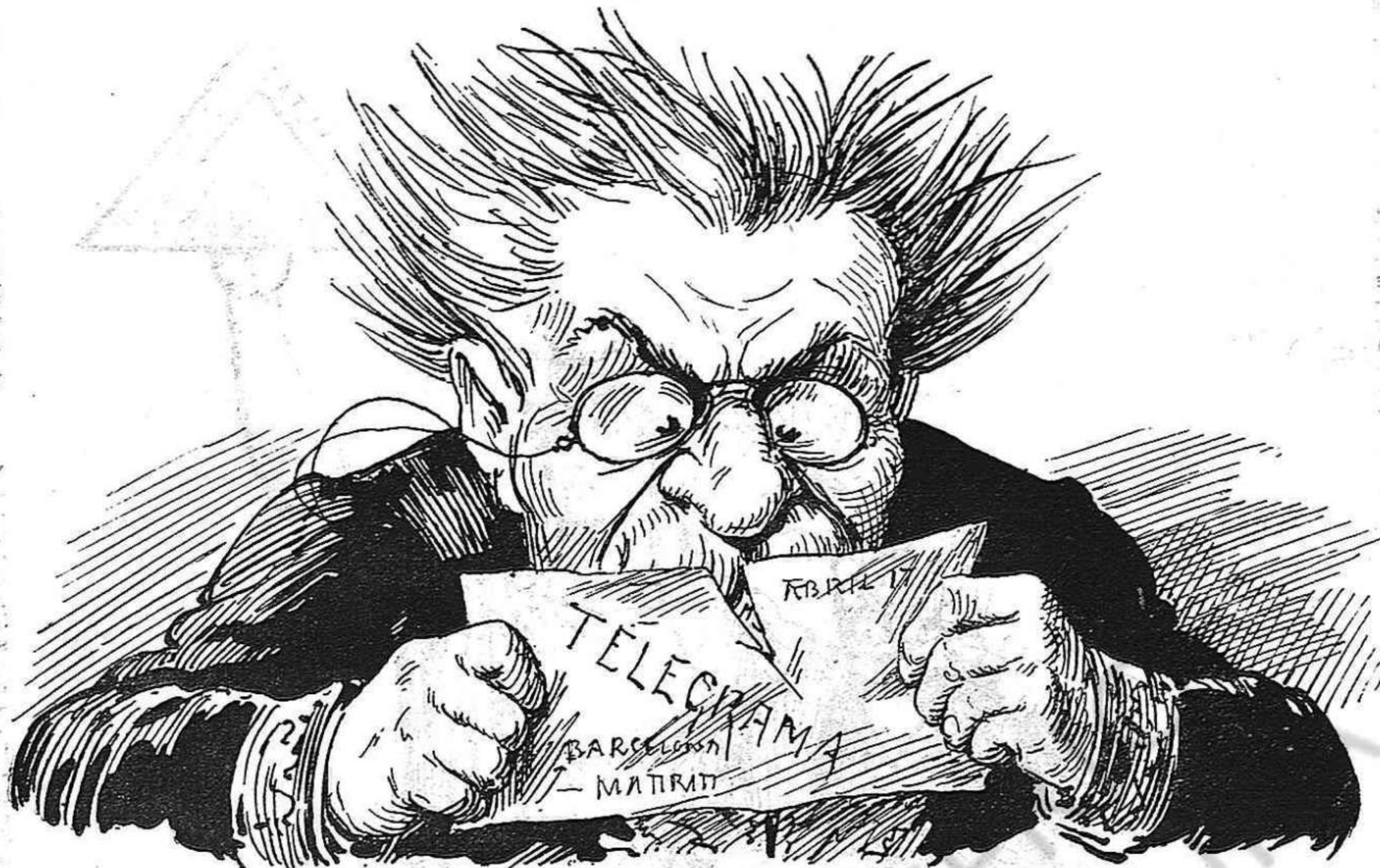
—¡Mala negada fassin!