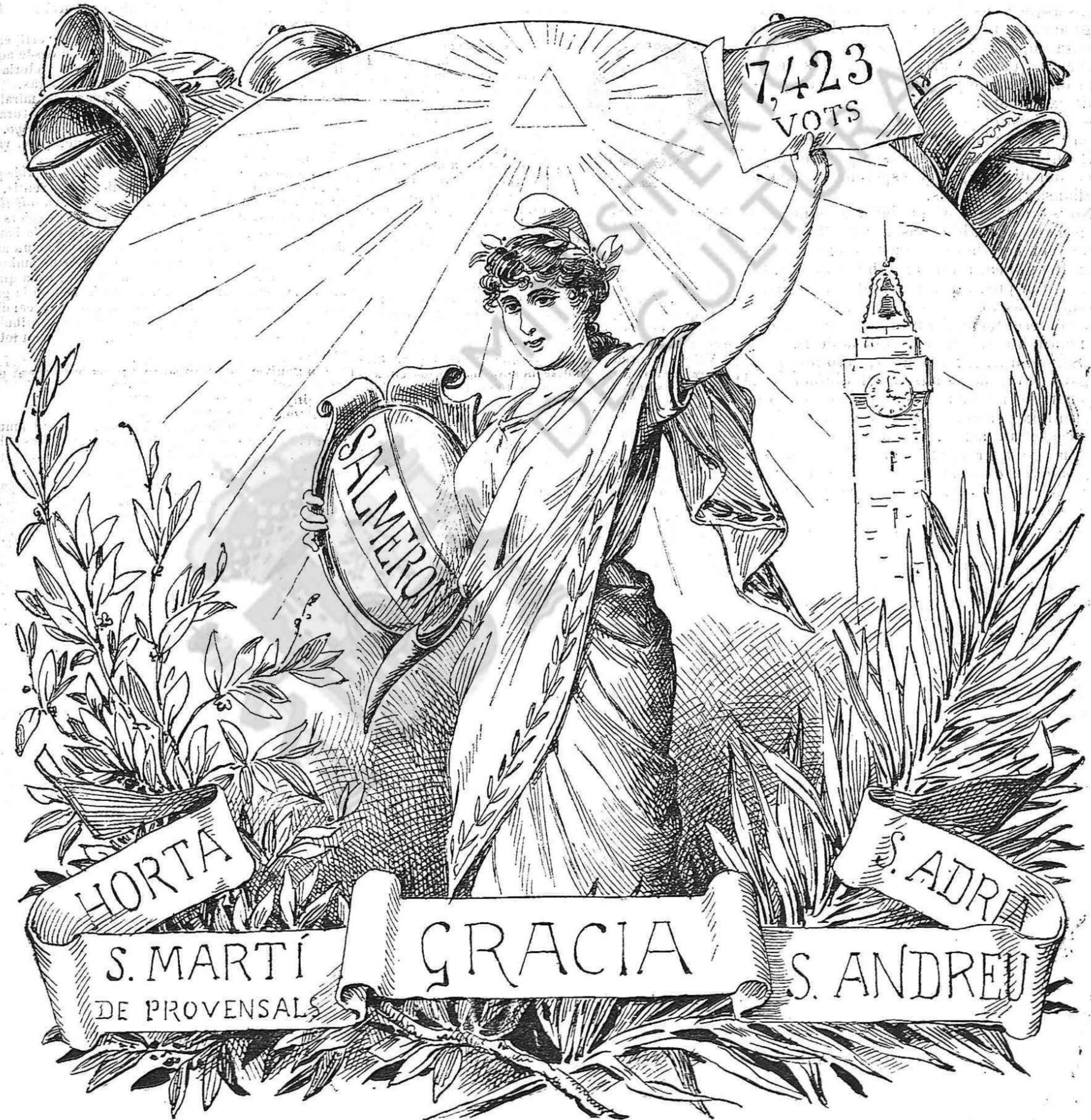
¡Gloria als electors de 'n Salmerón!