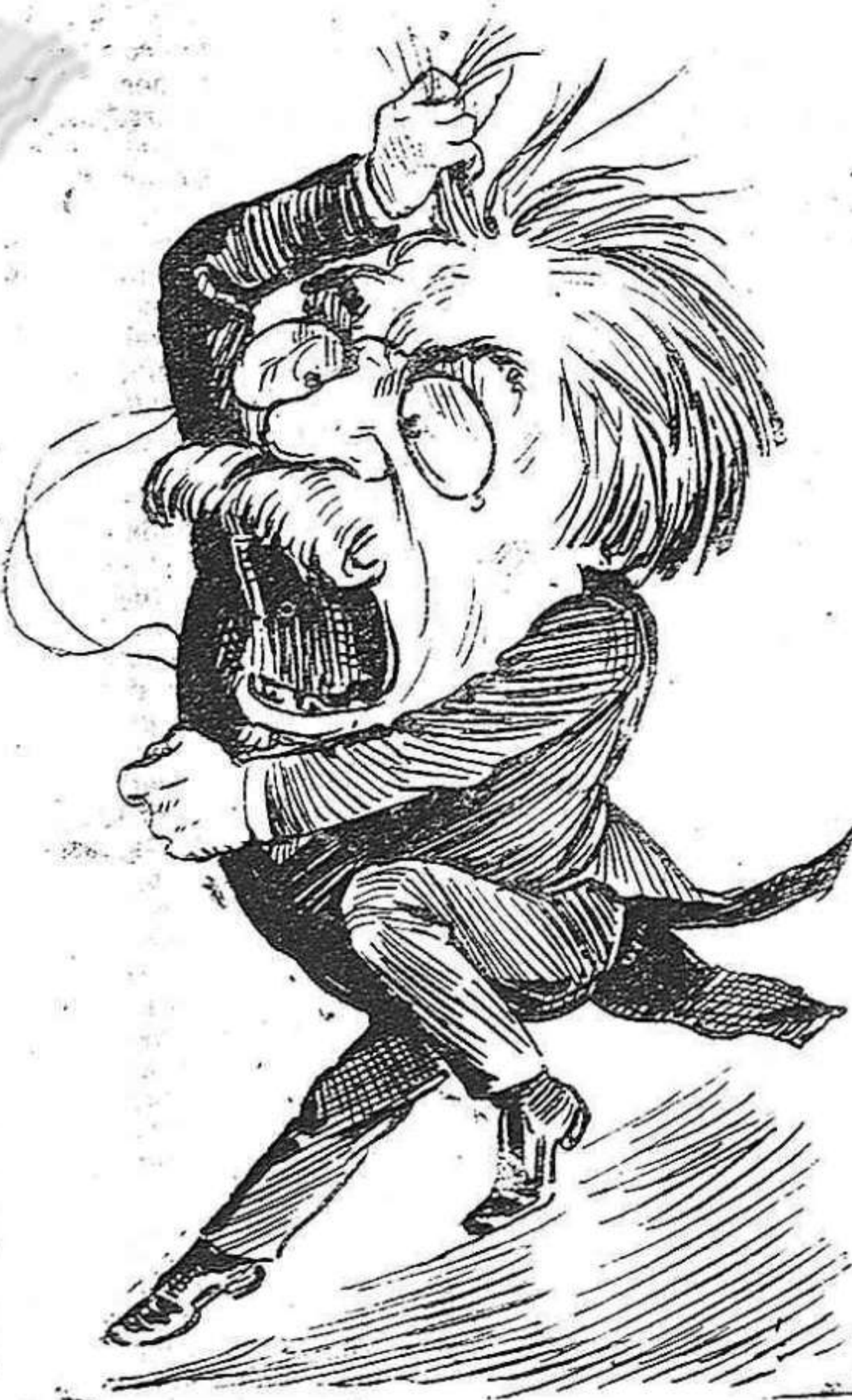
que ha desarreglat a: quest mestre.