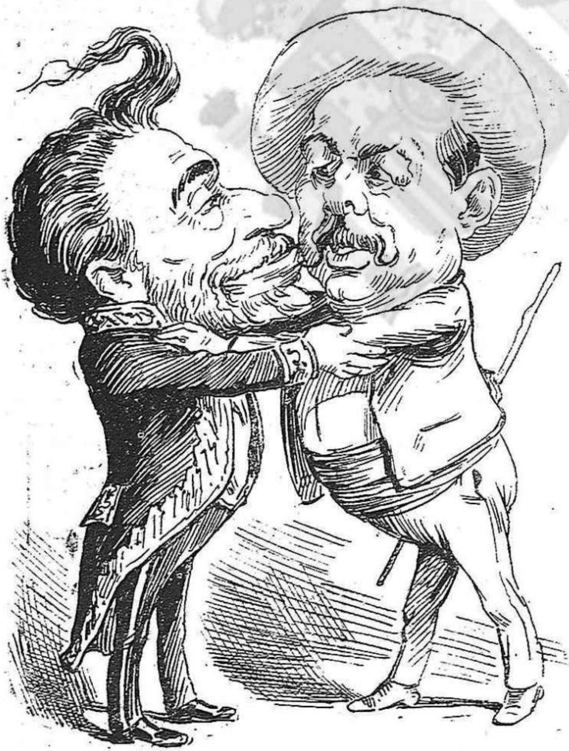
Un arreglo fet a temps