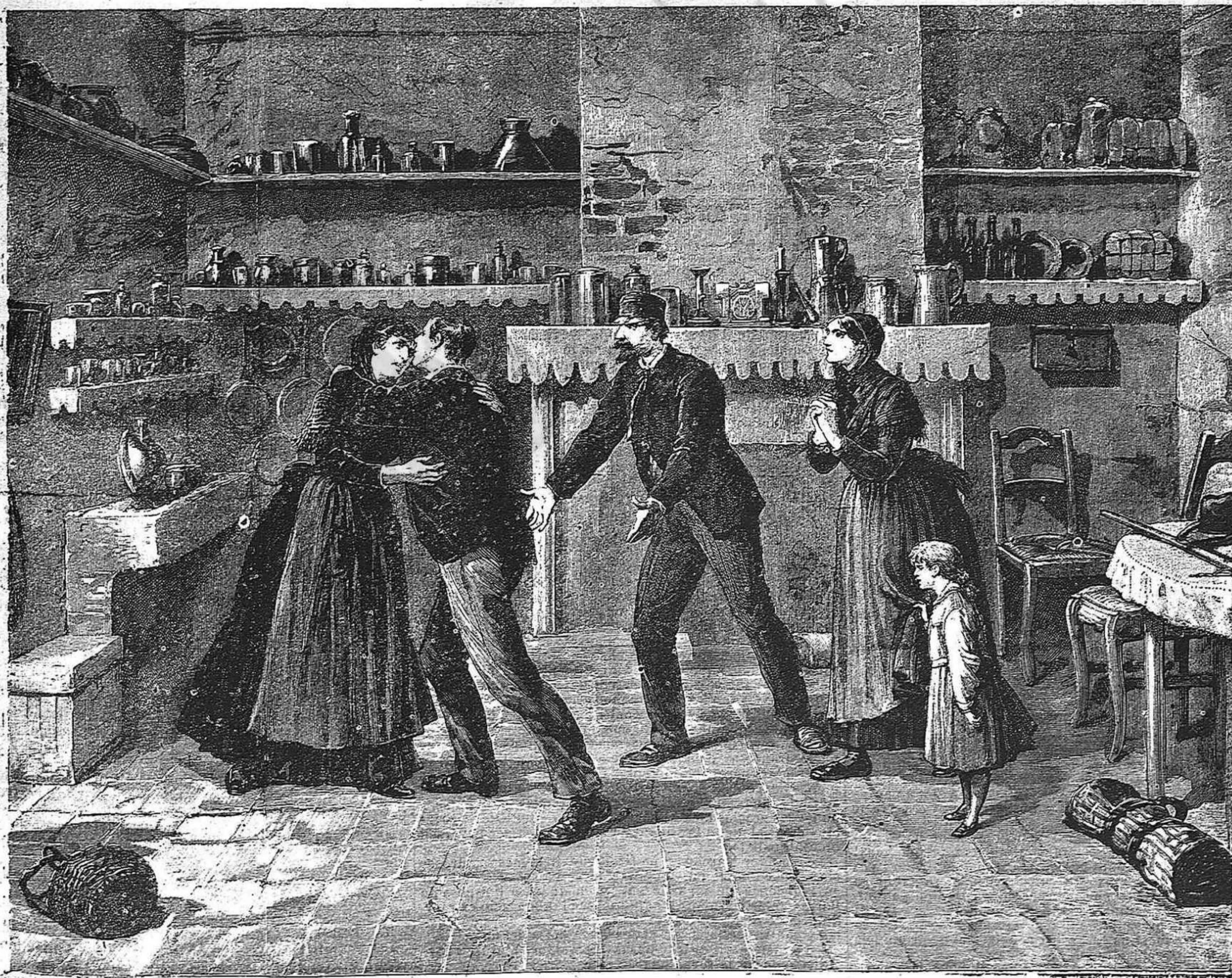
LA TORNADA DE 'N BORRÁS.—Entrevista de marit y muller en la cunya de la familia Call. (Vegis 1' article.)