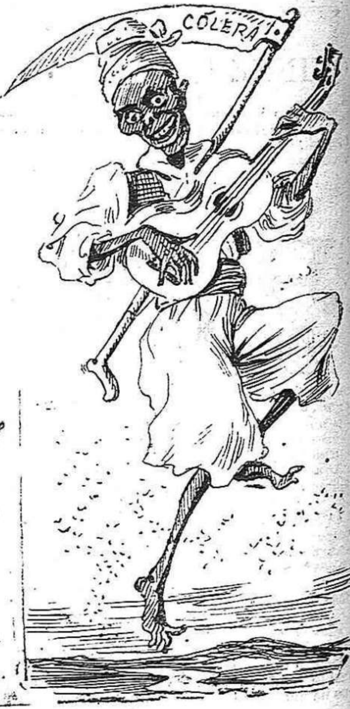
Un que comensa valencia, y ningú sab com s' acabarà.