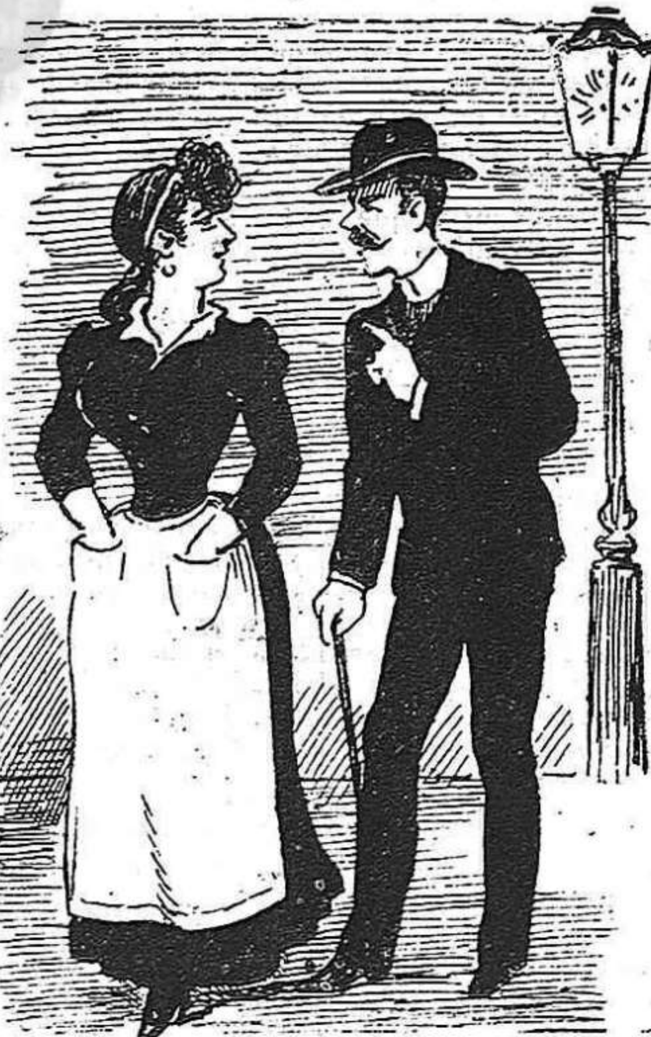
—Mira, noya, que ab lo nou reglament, las donas no podran treballar de nit. —Aixó ray, també traballo de dia si convé.