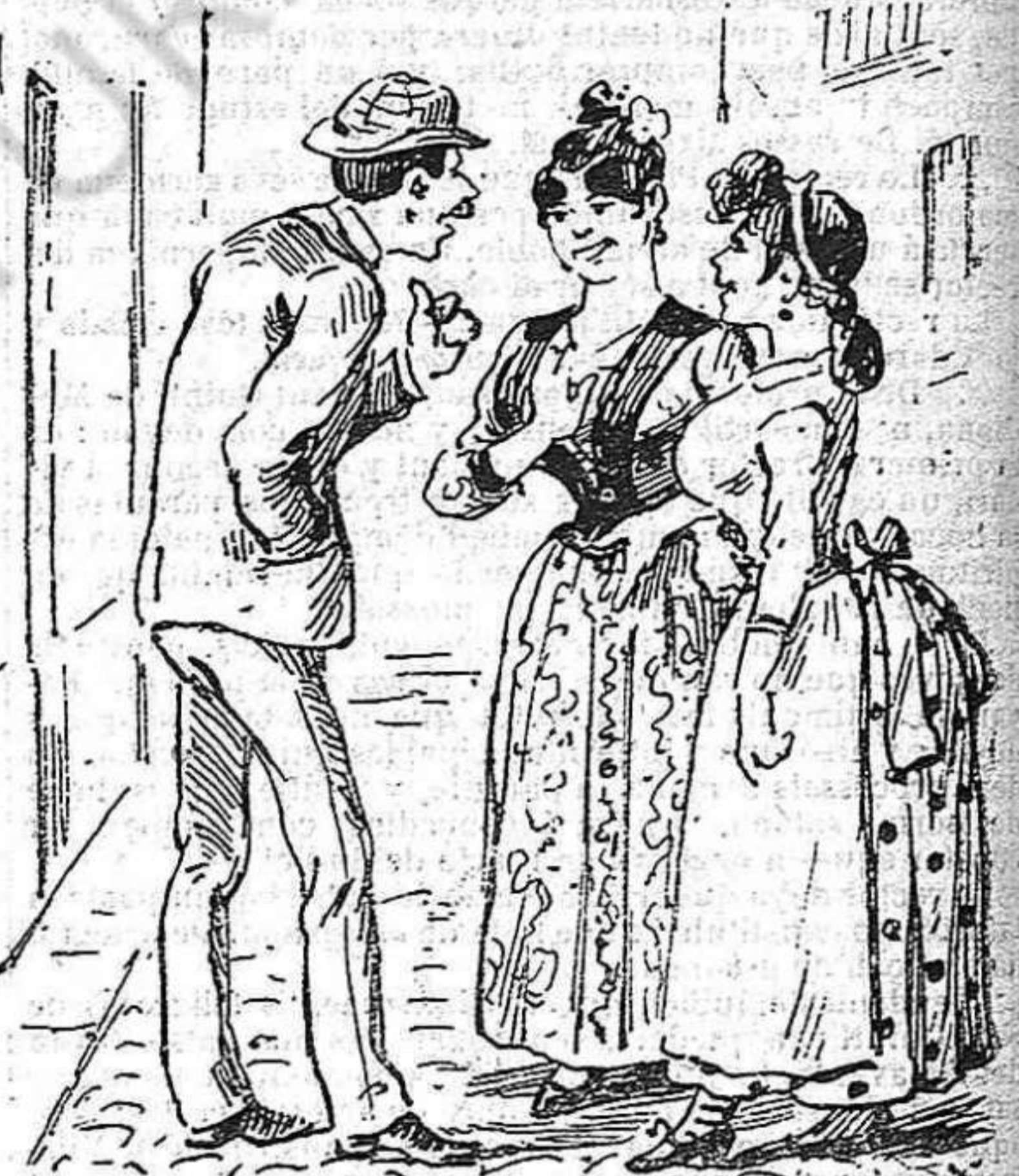
—Noyas, á casa, que van á posar l'estat de siti. —Ay fill, tot l'any hi estém nosaltres en estat de siti.