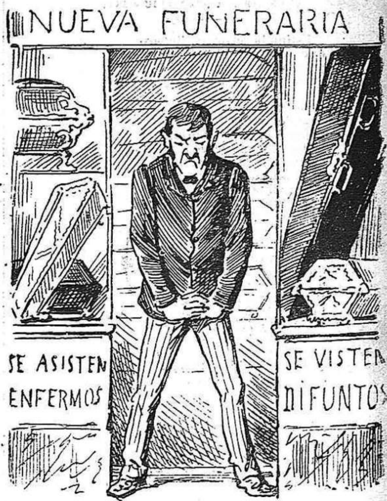
—Malament! Jo que havia fet un centenar de caixas!... ¡Vaya un estat de siti més de sucre-candi.