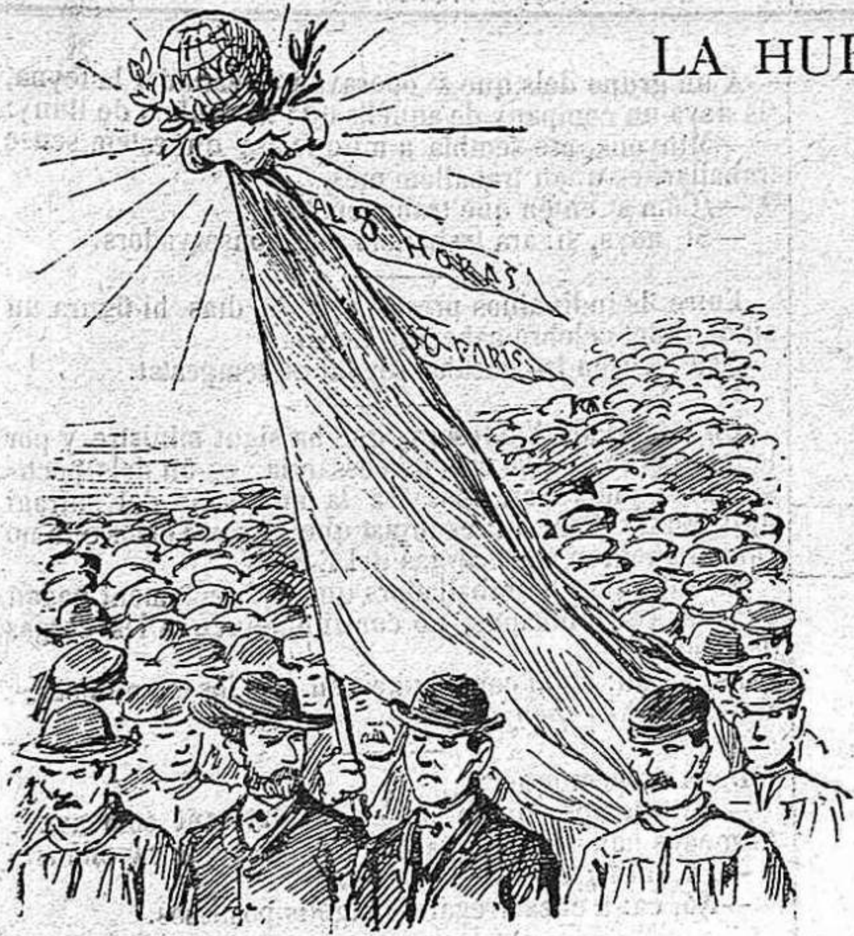
Lo dia de la gran manifestació feya un sol molt esplèndit.