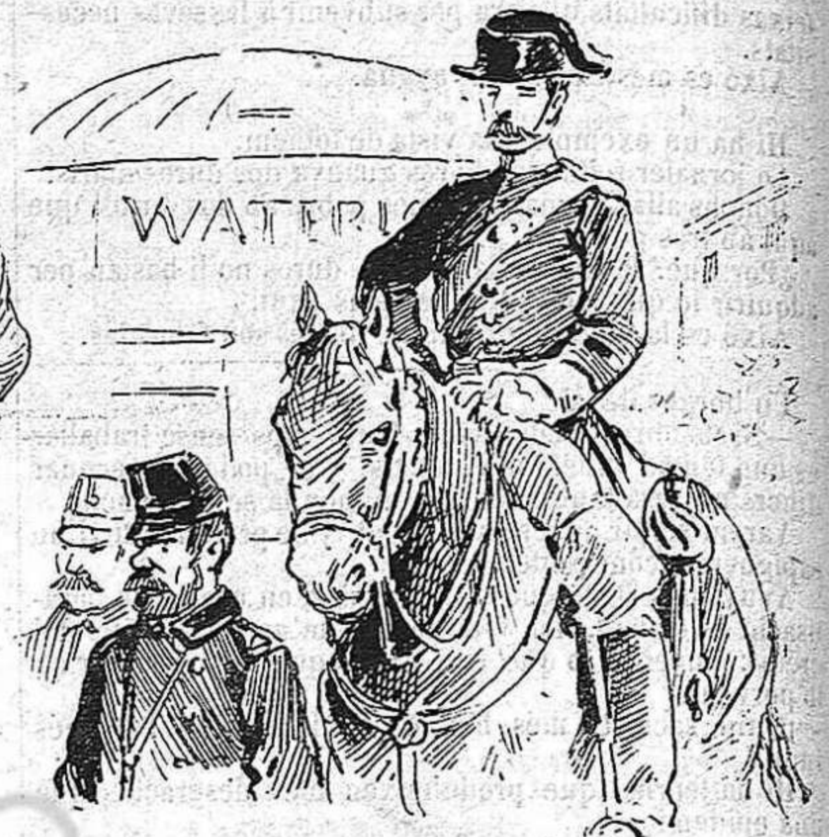
Preparatiu pera las carreras de maig.