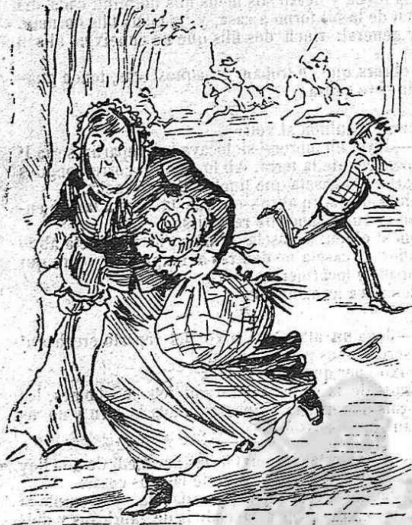
Primeras carreras.—Gran handicap nacional.