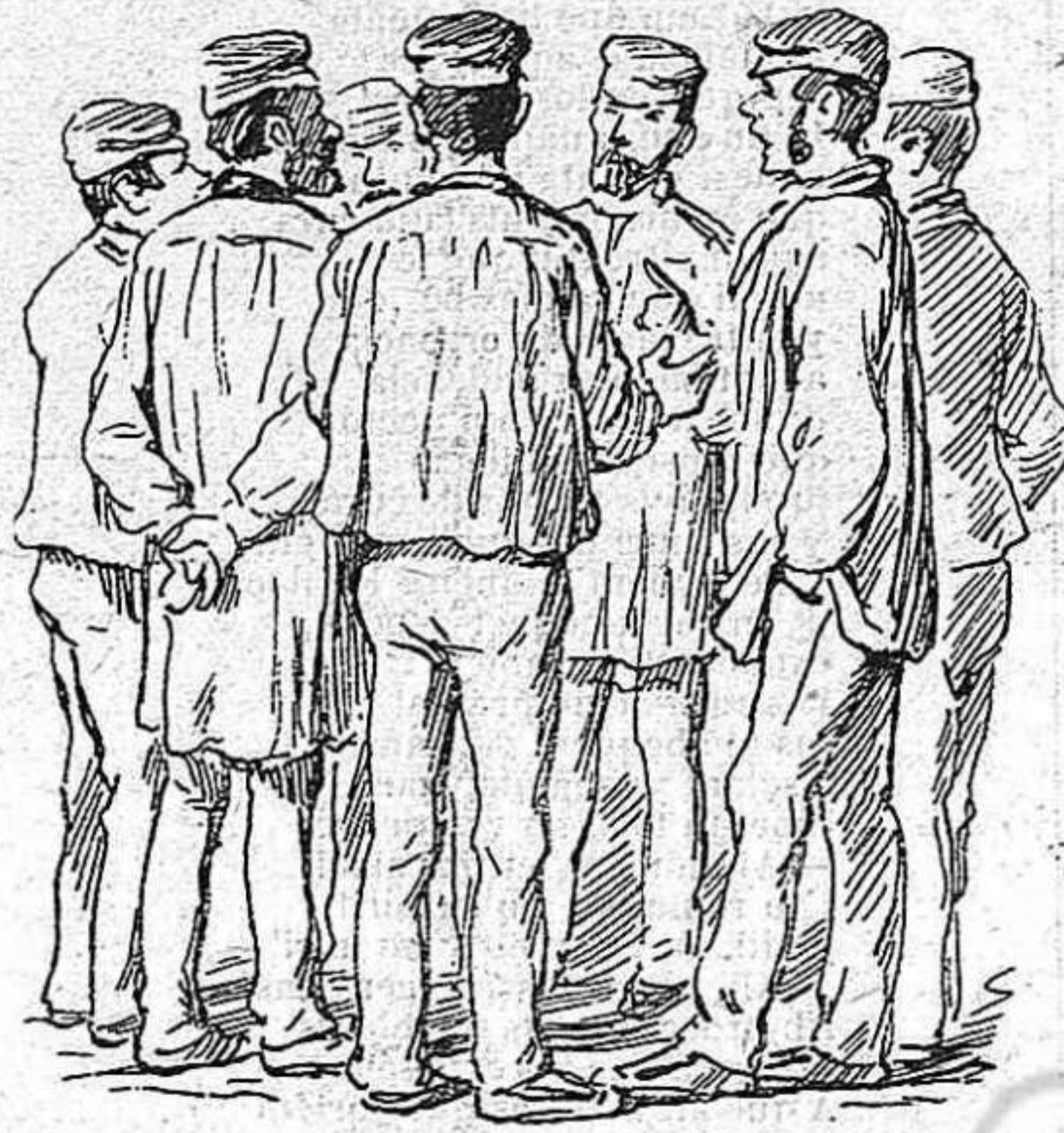
Pero l'endemà ja van comensar-se a veure algunes bromas.