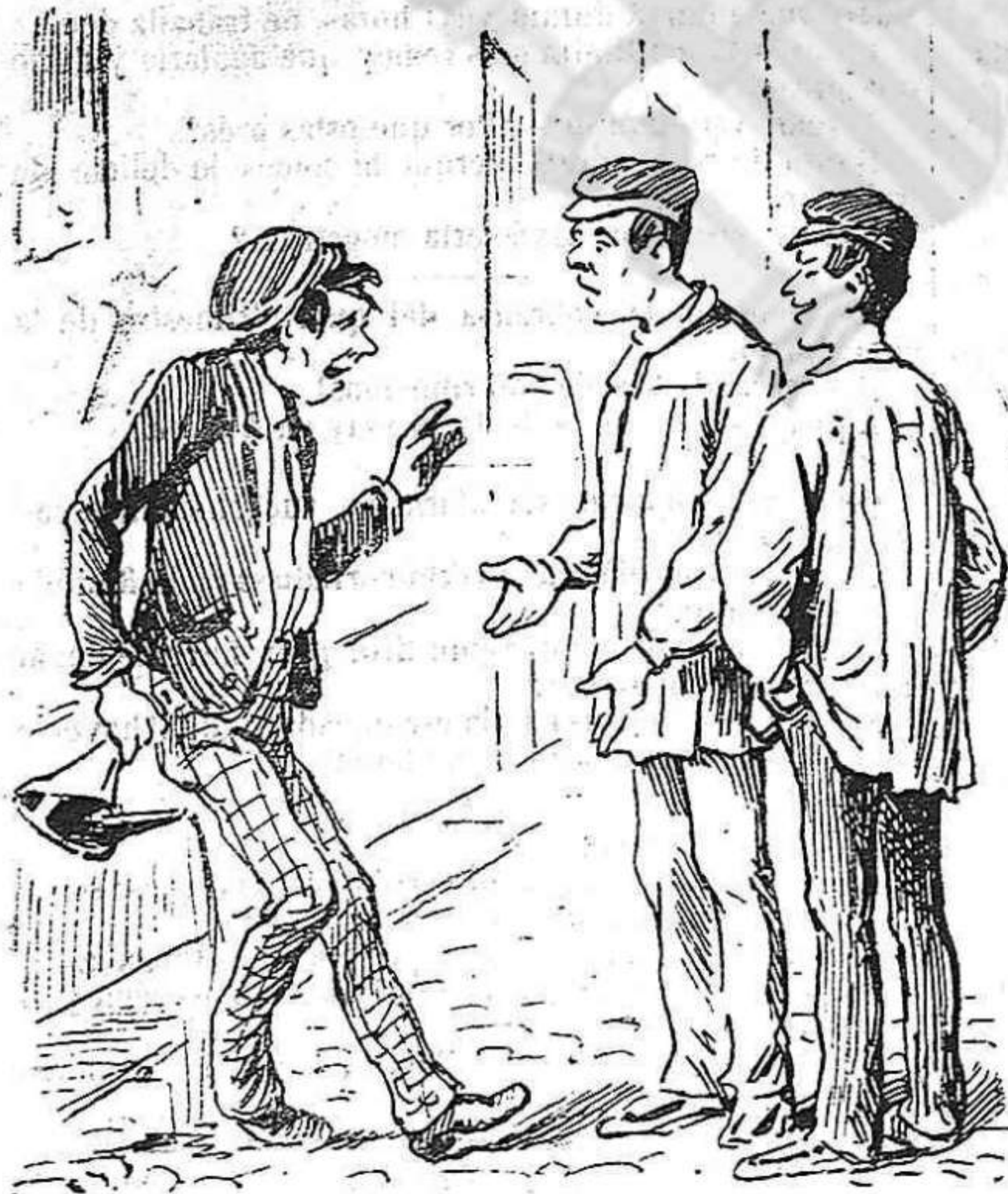
—Ahont vas Peret tan ben guarnit? —Com que diu que s'han de fer provisions, lo qu'és jo, ja hi provehit de xaretlo.