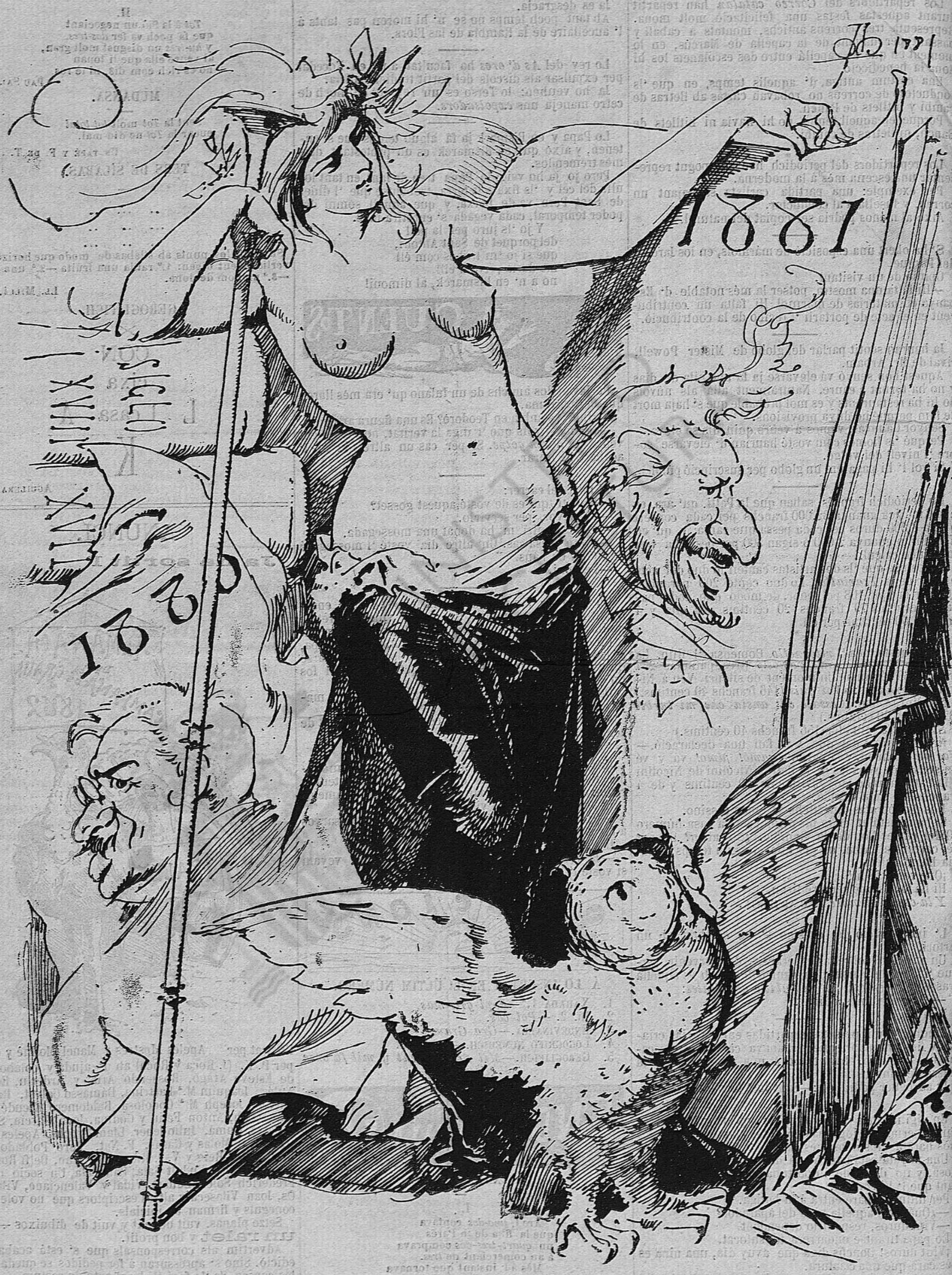
Poch á poch se vá lluny.