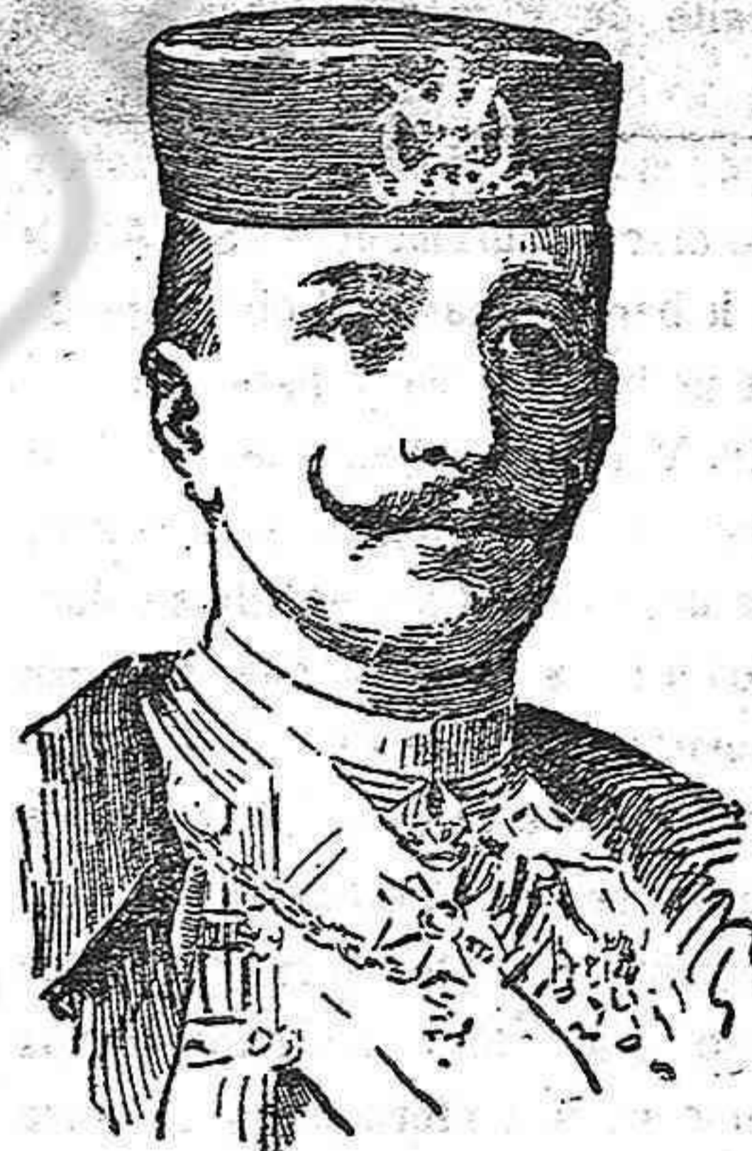
El príncipe Abirko de Montenegro, vencedor de los turcos en la batalla de Tuzi.