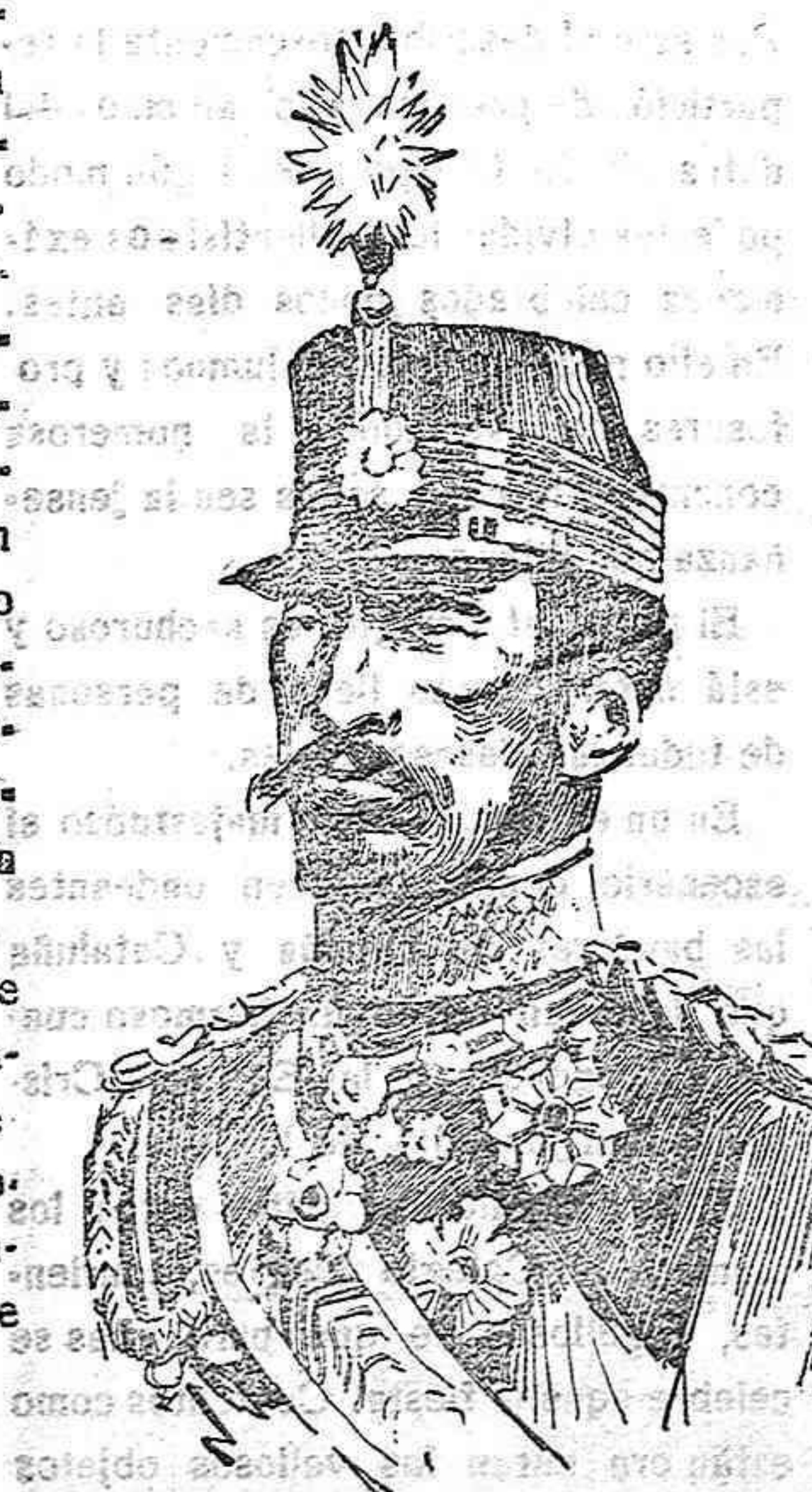
Mutsuhito emperador del Japón

Mutsuhito era una personalidad interesante y simpática; porque a él