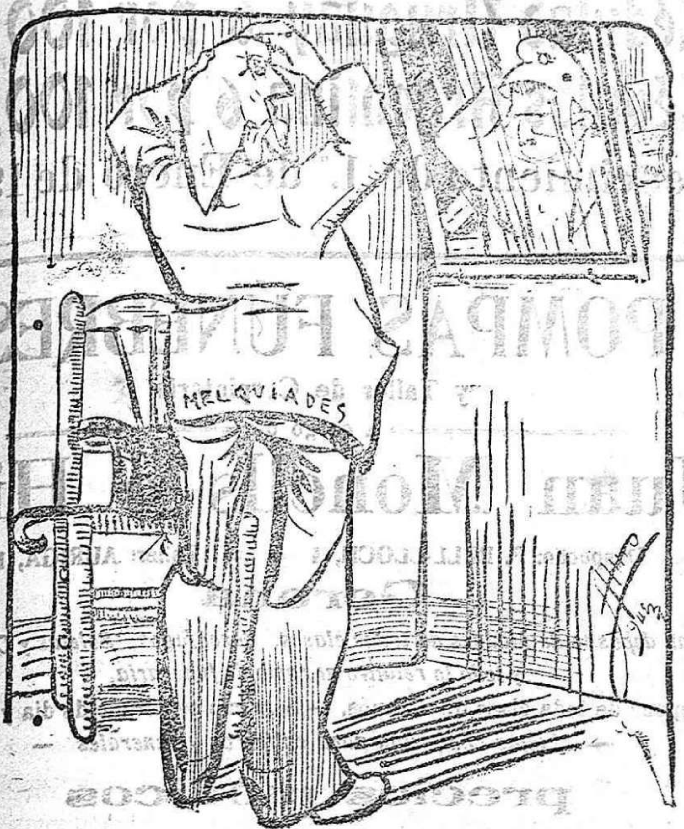
LA DUDA DE DON MELQUIADES

También éste me está grande; ¿si será que ha mermado mi cabeza?