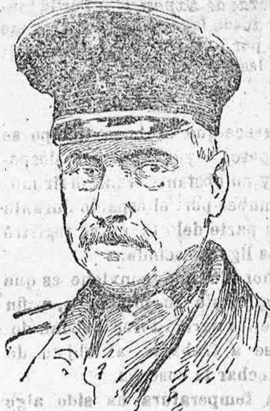
Liman von Sanders

General alemán, comandante del ejército que se opone al avance de los aliados en los Dardanelos.