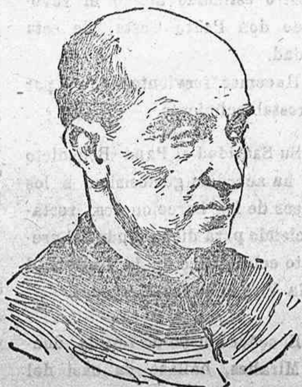
P. Luis Coloma