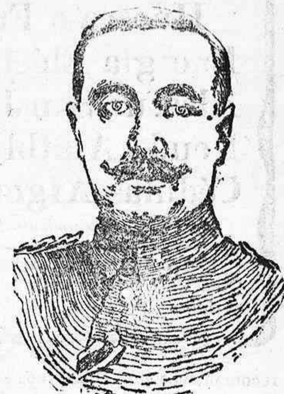
General cuartel maestro Wild von Hoenborn

Nuevo ministro de la guerra de Alemania.