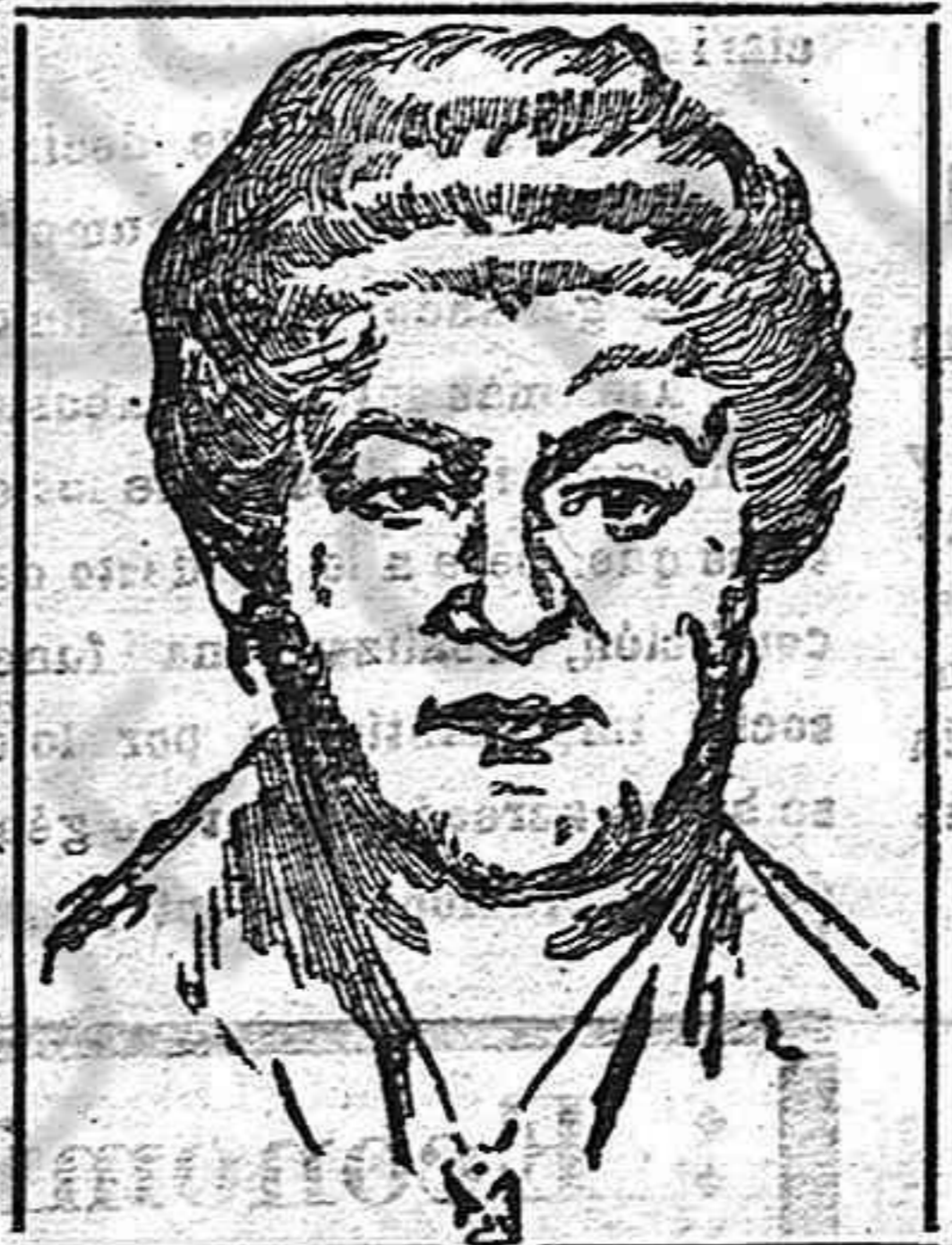
Doña Emilia Pardo Barán proposada para desempeñar la cá- tedra de Literatura de la Univer- sidad Central.