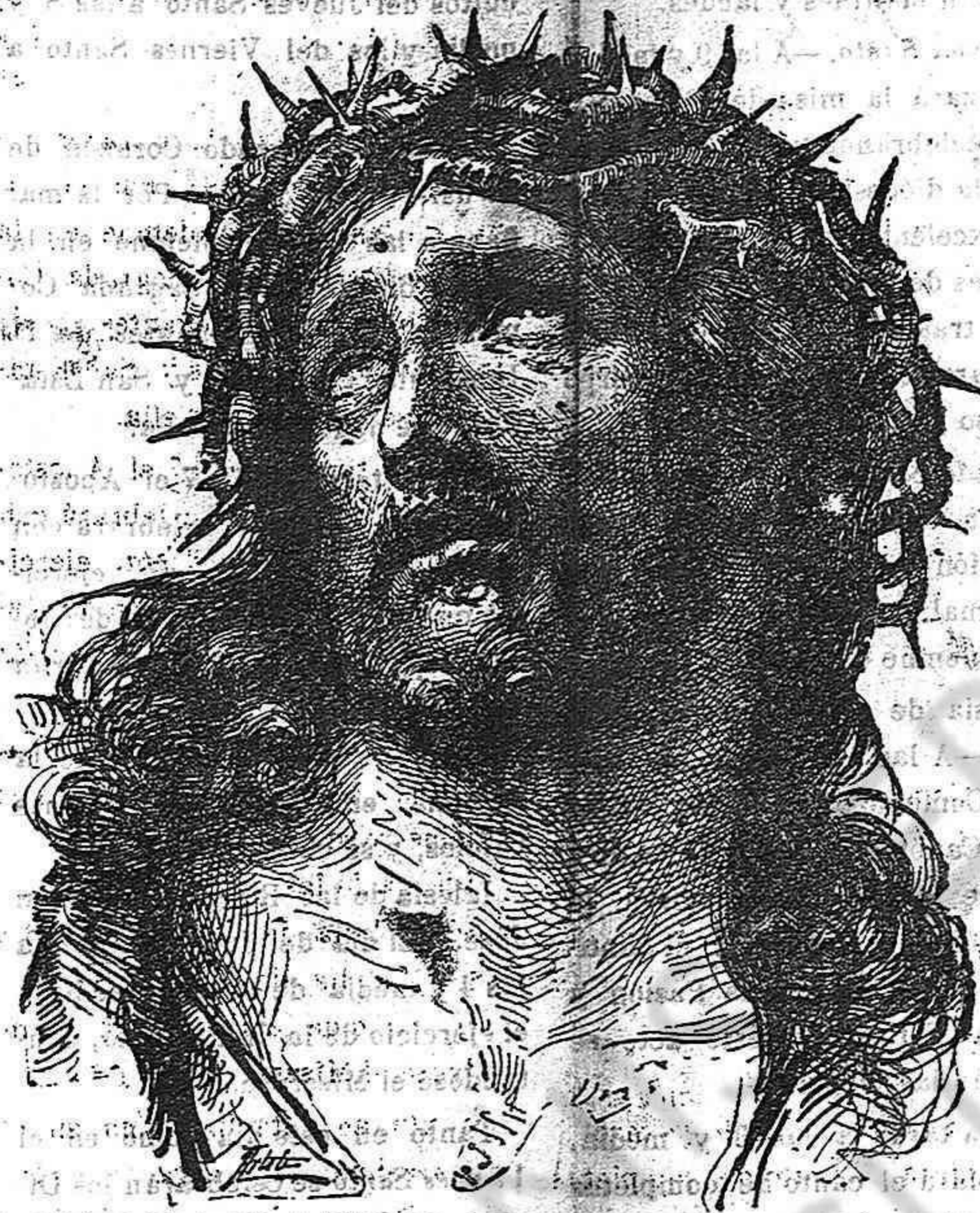
CUADRO DE HOFFMANN

bestides embarnicades de cultura i de ciencia, a moltes animes juvenils a que cegarà l'orgull, frecturosos d'honor i de gloria humana, pro no temeu, germans en la fé. Aquell qui resuscita una vegada, ja no morirà més; contra d'Ell i sa Esposa l'Iglesia res podran les portes del Infern; el fallo está ja donat, en la lluita eterna entre'l bé i el mal sabem de cert que triantarán els que lluitin en el camp de la ciutat de Deu. No defallim donchs devant de la contrarietat; per més sacrificis que se ns demanin, siguem constans que cantarem victoria.