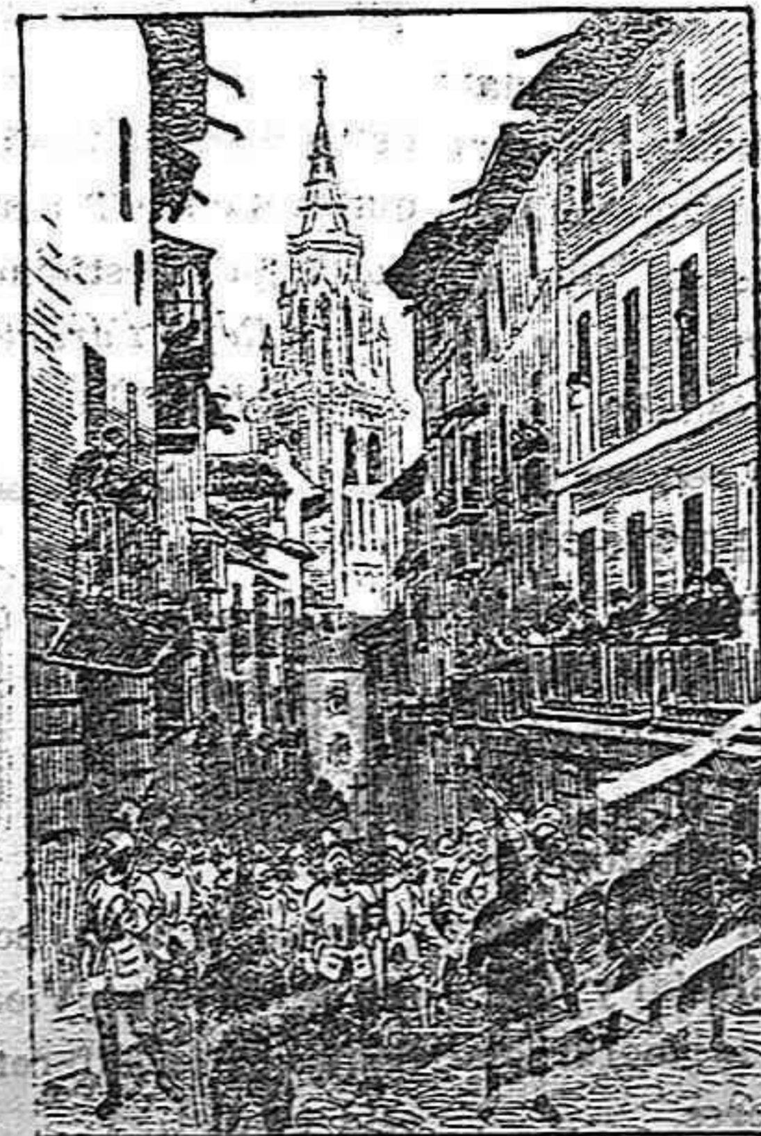
La procesión del Viernes Santo en la calle del Hombre de Palo.