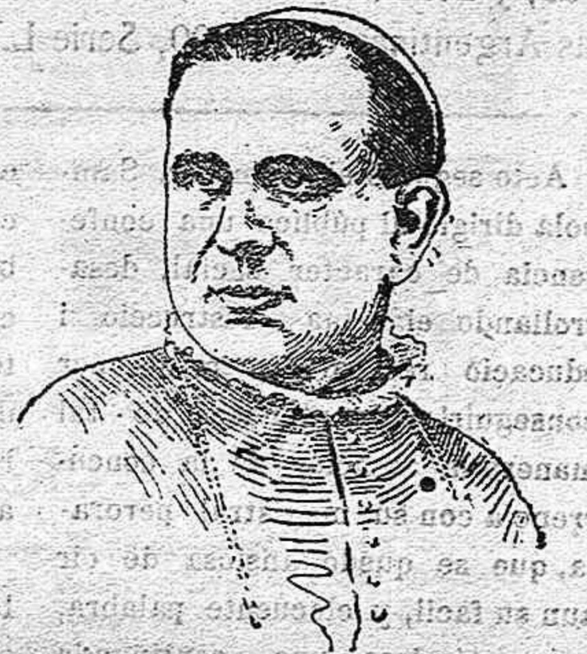
Ilmo. Señor D. Manuel de Castro, nuevo Obispo de Jaca, que el domingo último tomó posesión de su nuevo cargo.

La HORMIGA DE ORO Ilustración católica que se publica en Barcelona, contiene 16 páginas de información gráfica mundial y 23 páginas de lectura amena y ortodoxa con interesantes novelas intercaladas en forma encuadrable. Suscripción, diez ptas. al año. Se suscribe en todas las librerías.