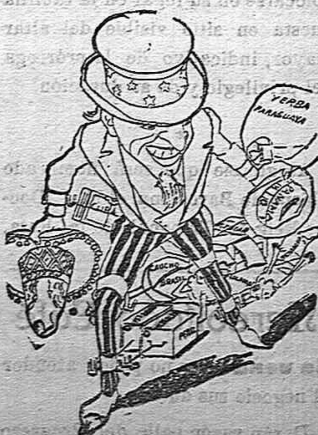
El sueño del tío Sam