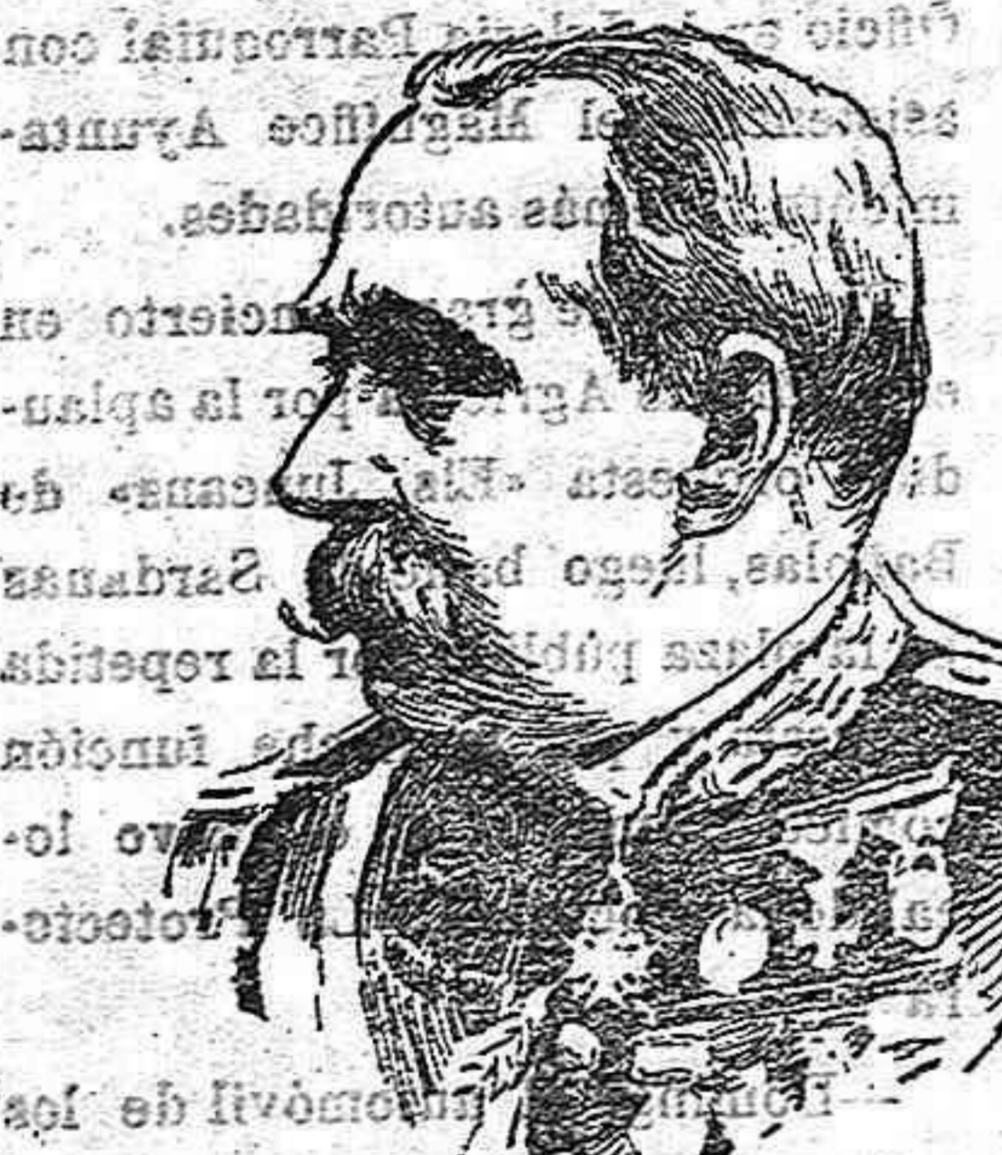
General D. Camilo Polavieja