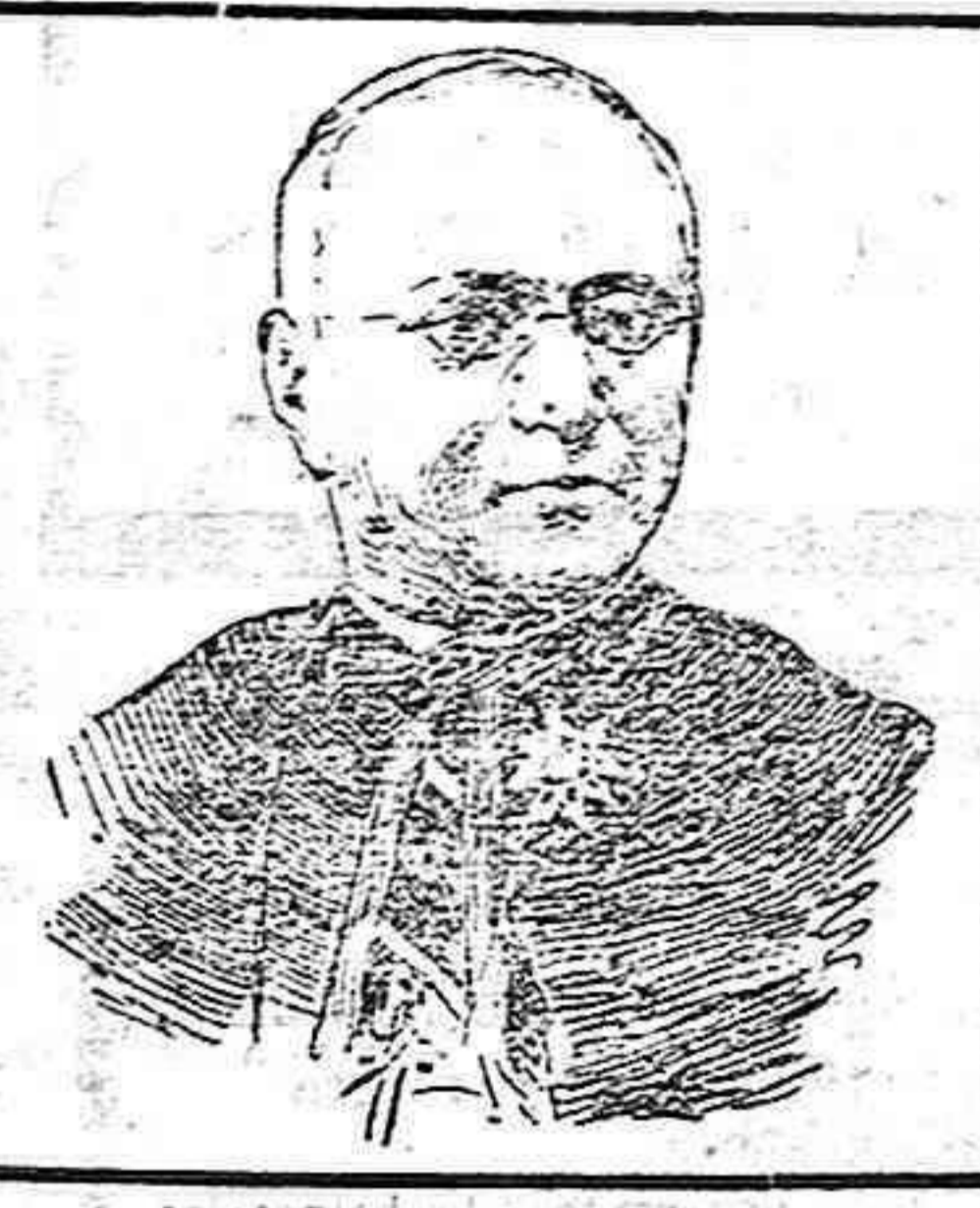
Benedicto Lorenzelli Cardenal fallecido en Roma.