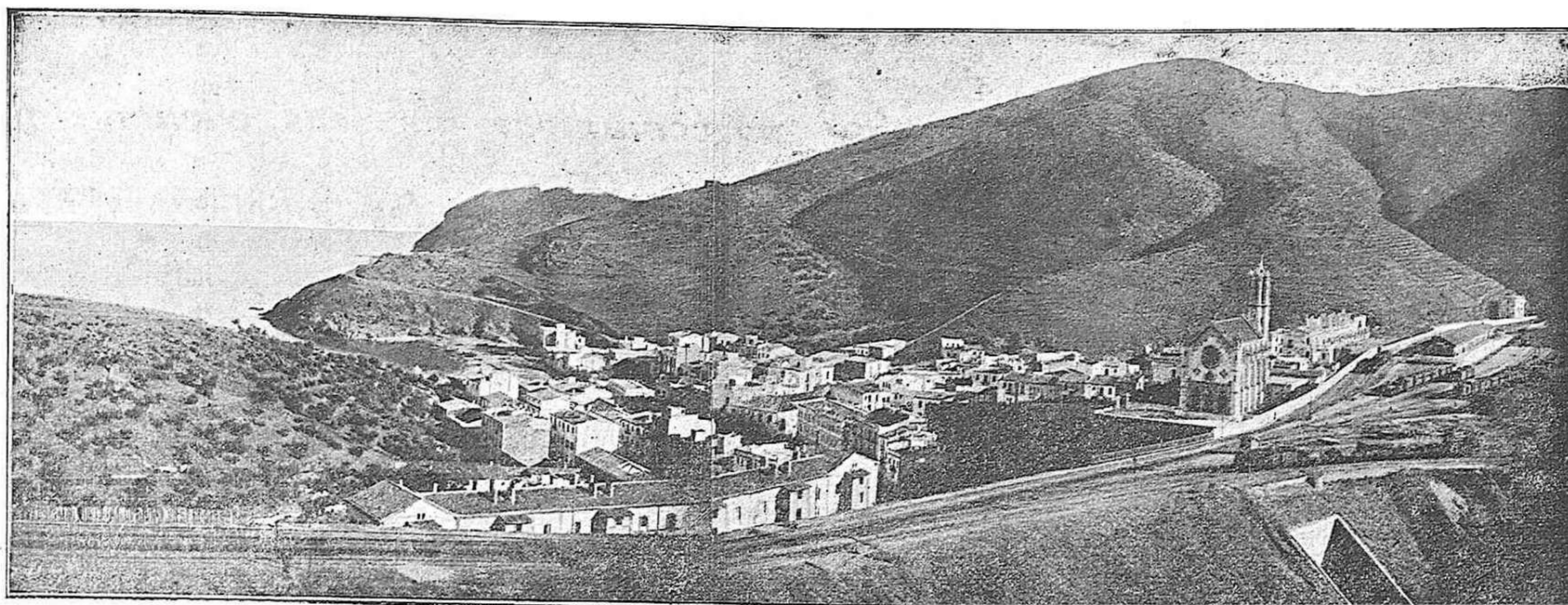
Vista panorámica de Port-Bou tomada antes de la construcción de la nueva estación de ferrocarril, hoy orgullo de nuestra primera población fronteriza.

Recuerde el Padre Burgas y sus acólitos, que su Iglesia en 18 años condenó a penas infamantes e hizo quemar a más de 200.000 personas de ambos sexos, pereciendo en sus calabozos del Santo Oficio de la Iglesia Católica cerca de cuatro mil.