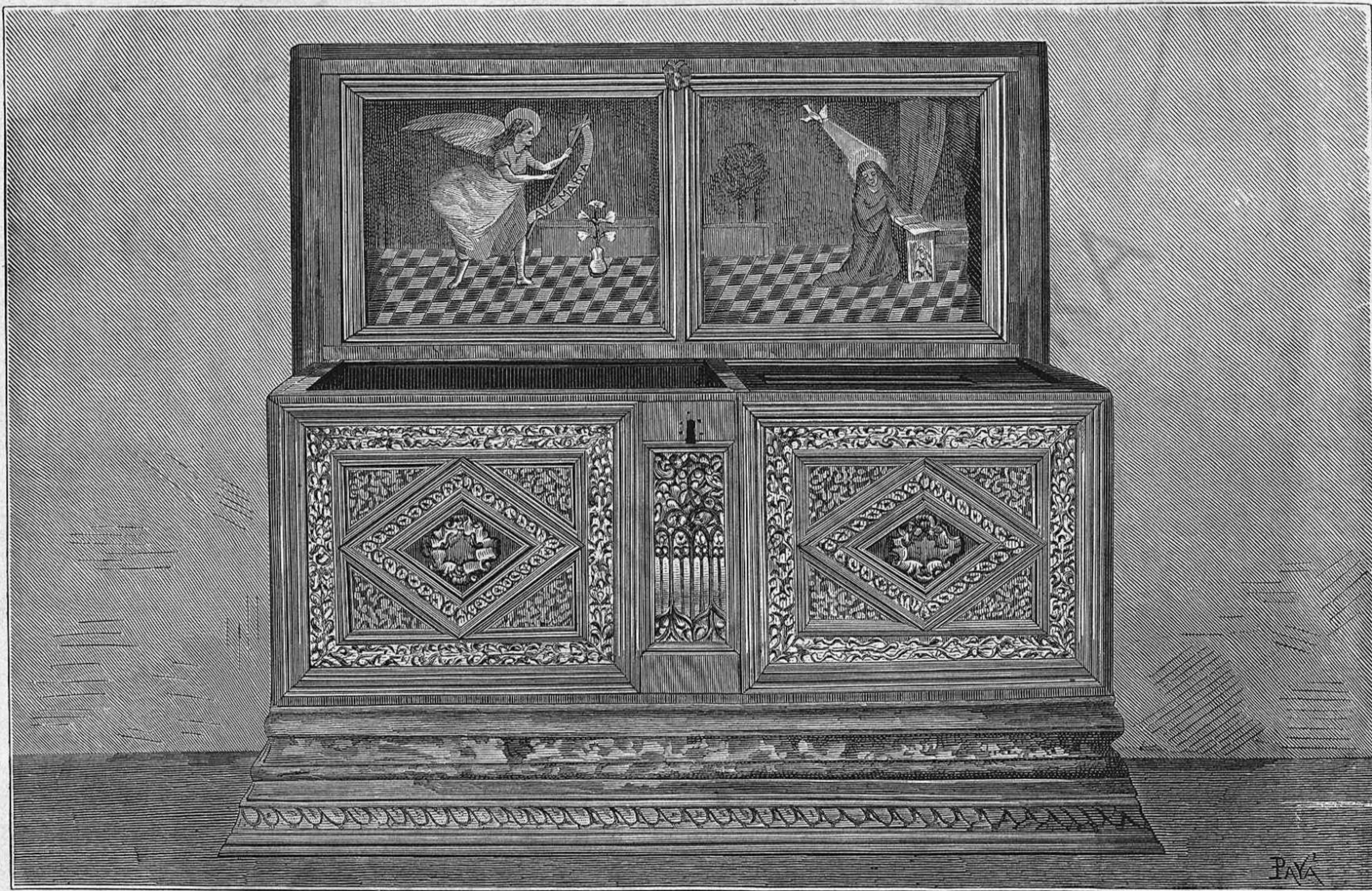
CAIXA DE NUVIA DEL SIGLE XVI, EXISTENT EN MONISTROL

Terminarém aconsellant al senyor Curros que no