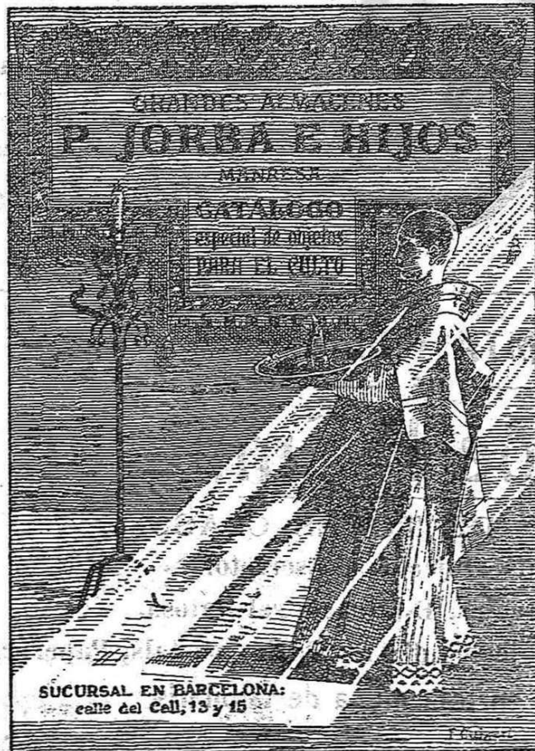
SUCURSAL EN BARCELONA: calle del Call, 13 y 15

NOTA.—Essent aquest anunci dedicat als senyors sacerdots i ordres religioses, no's mencionen altres nombrosos articles a que's dedica la casa.