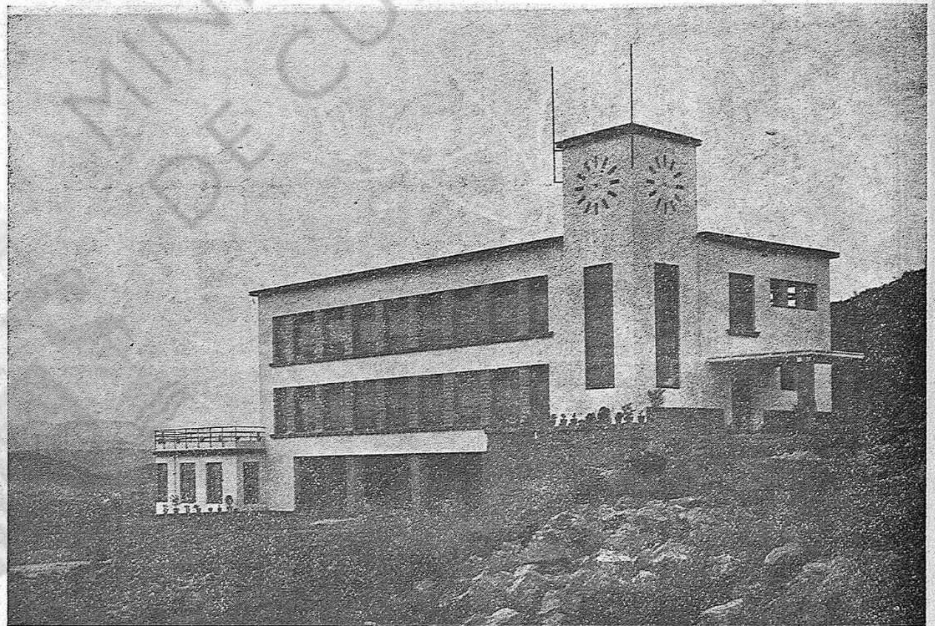
ESCOLA IGNASI IGLÉSIAS. - Vista del conjunt de l'Escola

El President revisà la tropa de la Companyia del Batalló de Muntanya núm. 2 de guarnició en aquesta ciutat, comandada pel capità Jacint Calderon i entrà seguidament a la Sala de Sessions de l'Ajuntament. Ací fou saludat i complimentat per totes les personalitats assistents a l'acte, entre les quals hi havia el Governador general de Catalunya senyor Selves, el diputat i alcalde d'aquesta ciutat senyor Santaló, el sots-secretari del Ministeri d'Instrucció Pública, senyor Jaume Pi i Sunyer, el qual portava la