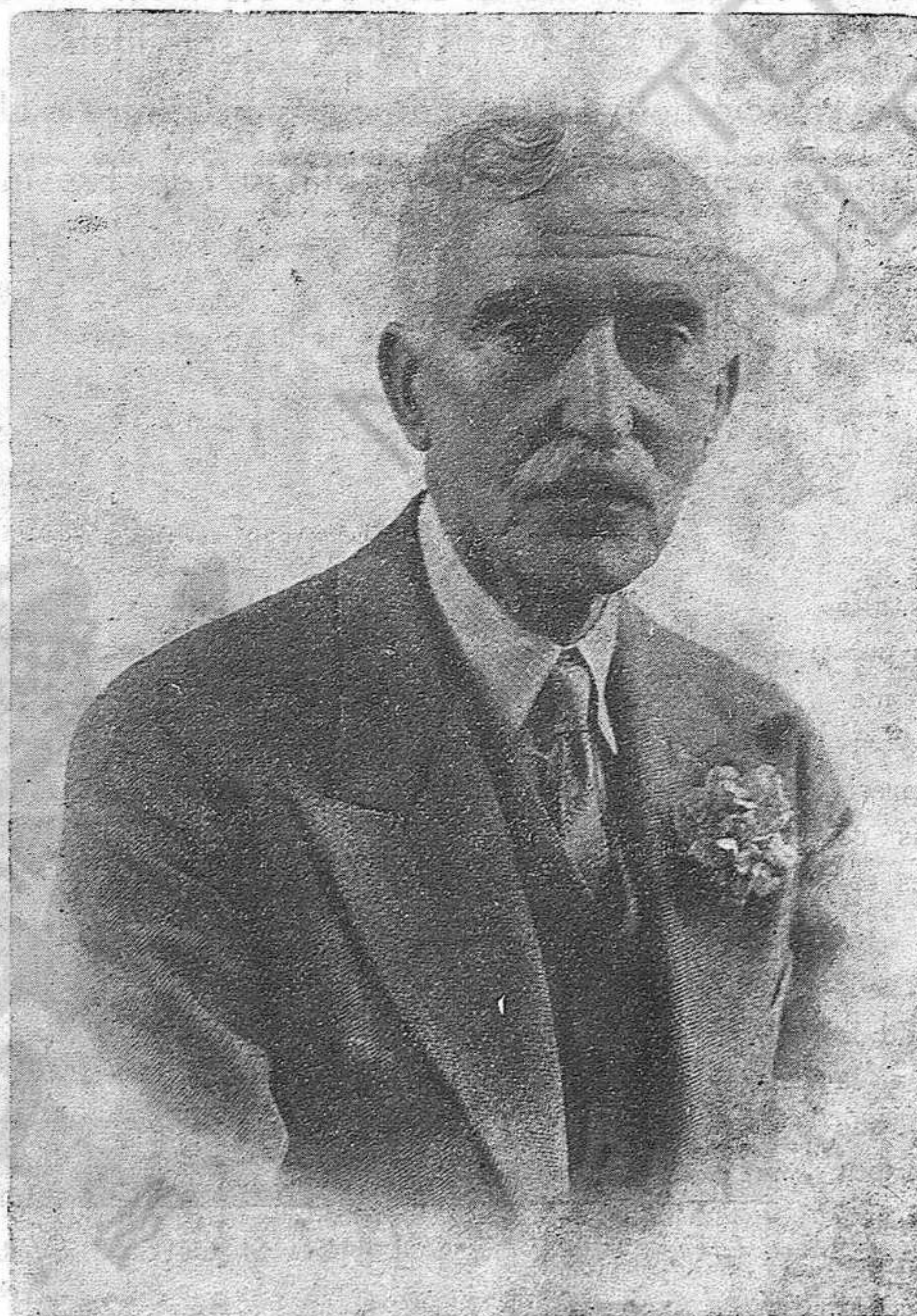
Francesc Macià Llussà President de la Generalitat de Catalunya

SETMANARI DEL PARTIT R.F.N DE LES COMARQUES GIRONINES