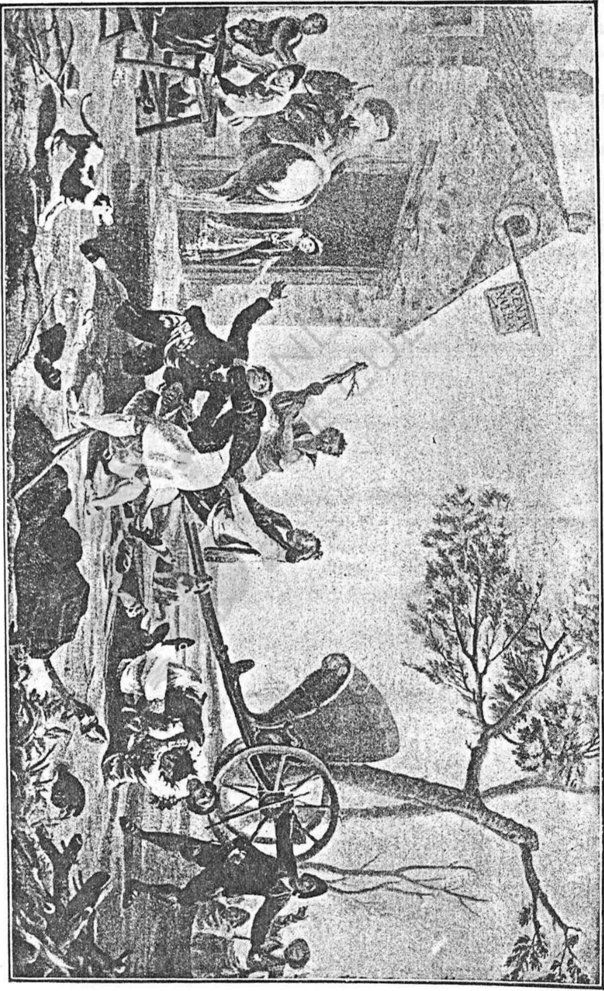
Els buscarradns: tapis de Goya.—Propietari de la Casa Real d' Espanya.

Madrid, en la Academia de San Fernando: Interior de una casa de los de la casa de una zorra, Sazon del Tribunal de la Inquisición, Los disci-