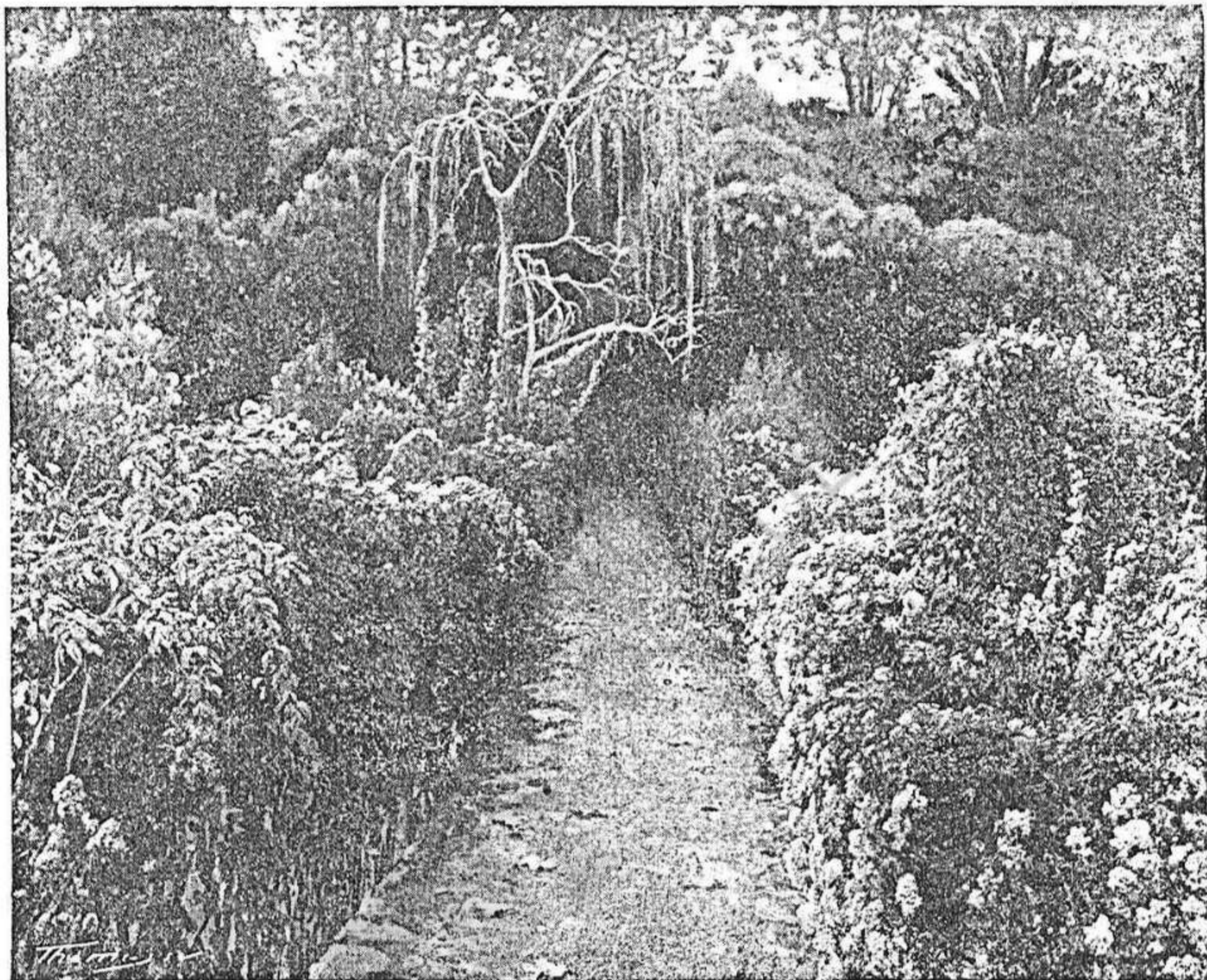
Flores azules.—Cuadro de Rusiñol.

Aquest es Maillol: un artista que sap crear amb un estil propi coses viscudes, d'una natura ben seva. Això es el classicisme veritable. Sense teories, sense els moderns prejudicis, respectuós del passat, savi y sincer,