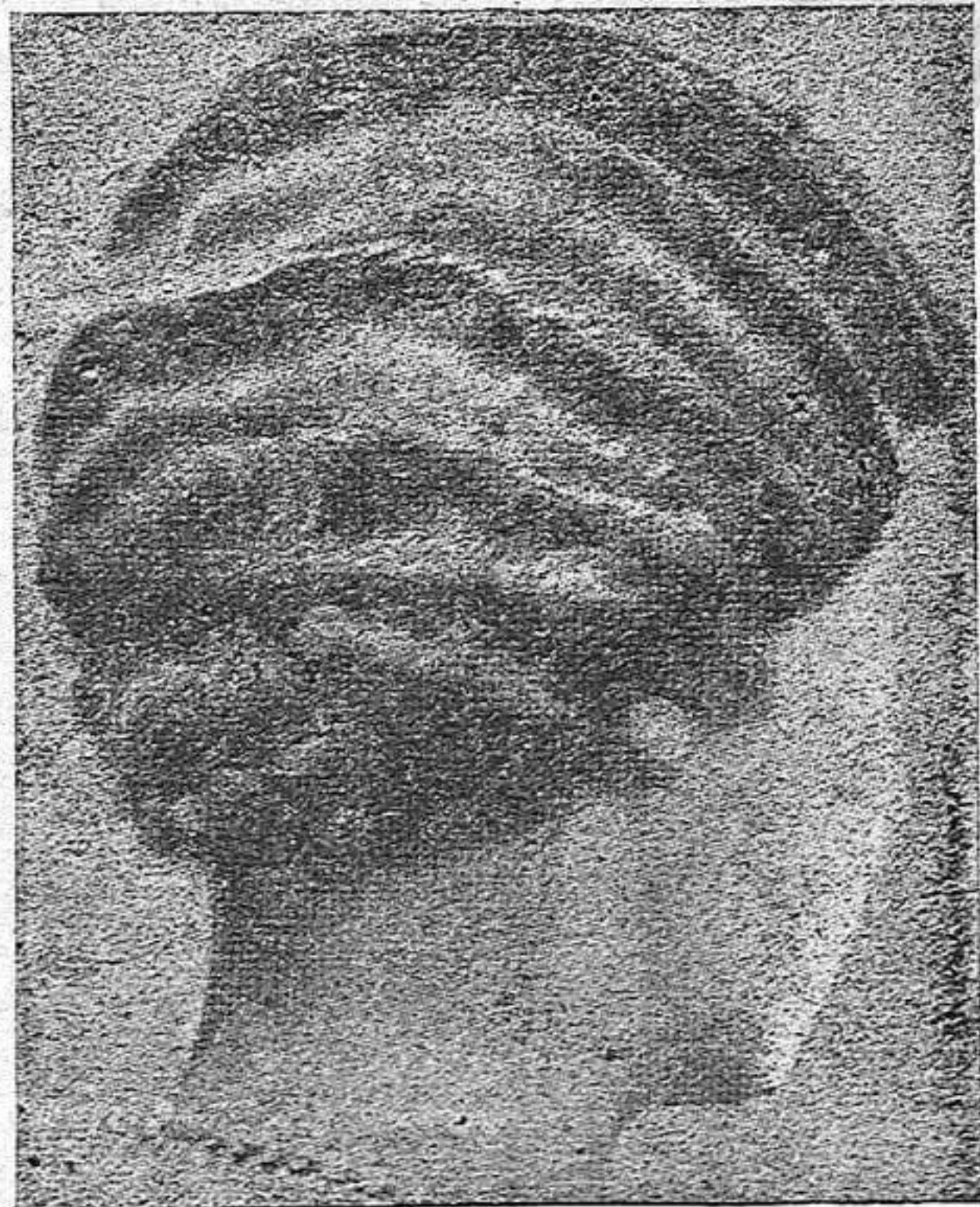
Creació de Josep S. Melció