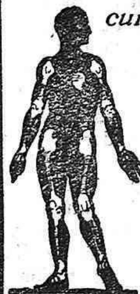
GRÁFICO INDICADOR DE LOS PUNTOS DONDE SE SITUA EL REUMA

cura el reuma porque disuelve el ácido úrico