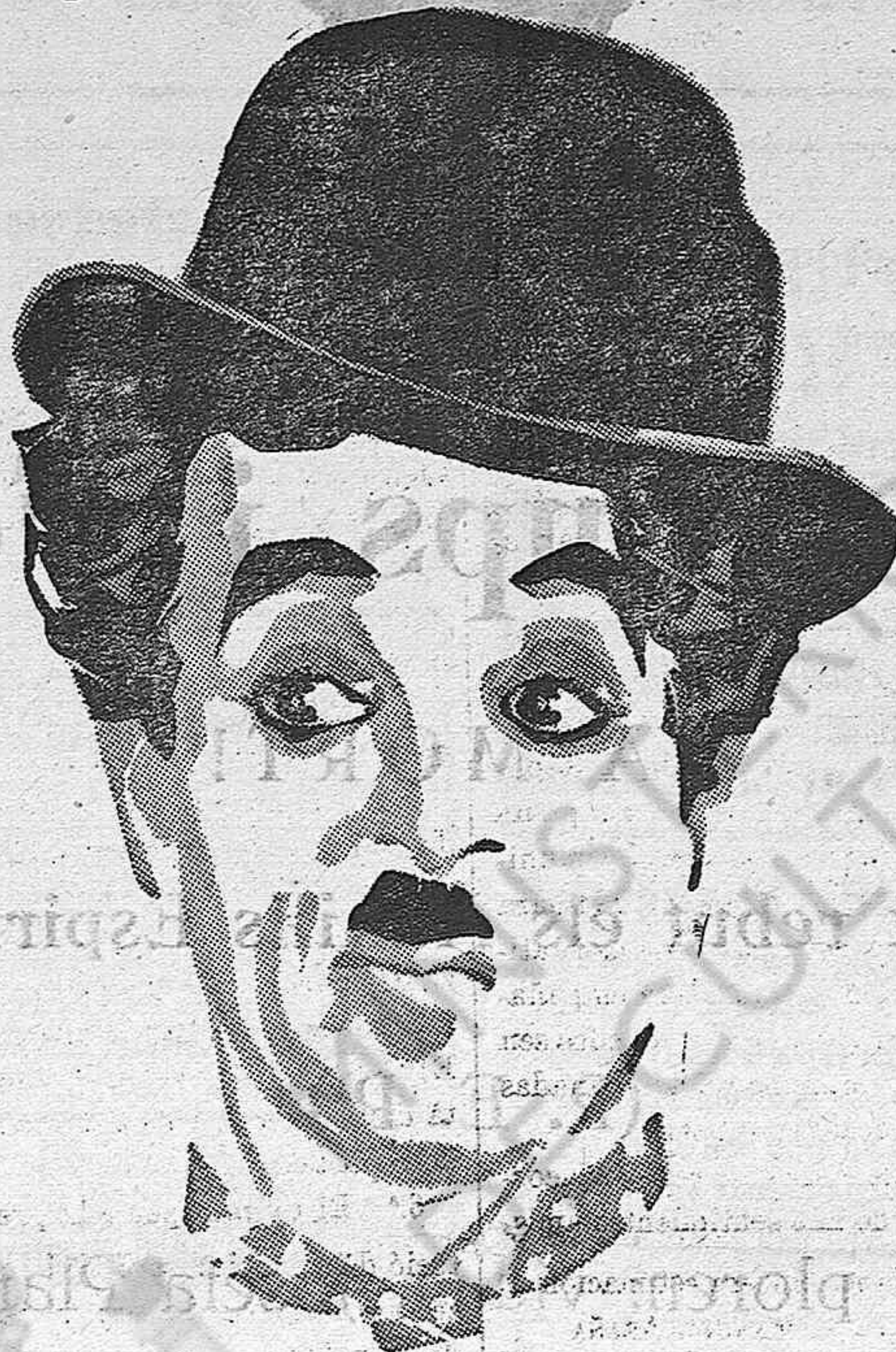
CHARLES CHAPLIN (CHARLOT)

Sincronitzada amb música i efectes sonors.