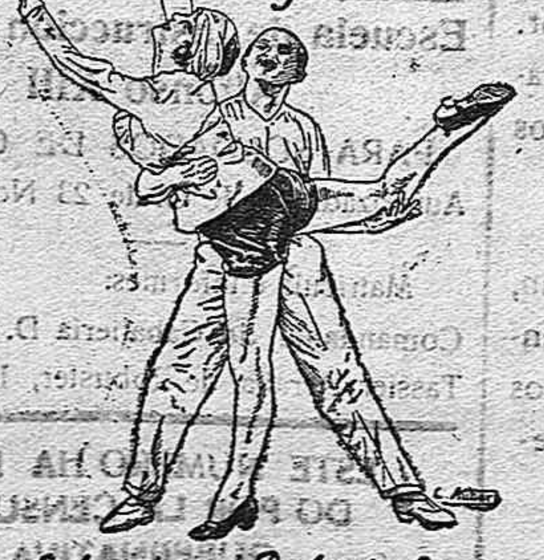
Selecciones Balart y Simó