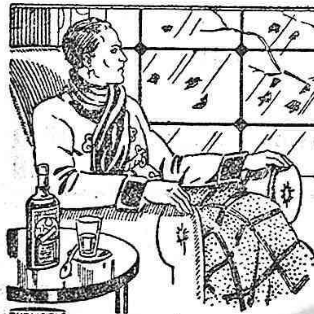
Se vende en todas las buenas Farmacias, a Ptas 5'00 el frasco